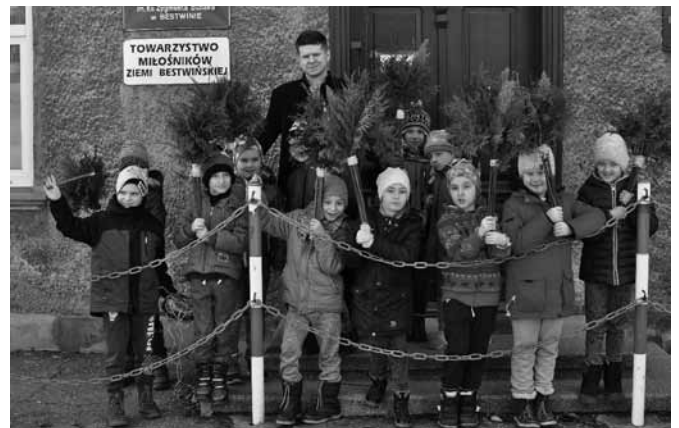
Uczestnicy wielkanocnych warsztatów