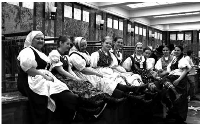
Zespół „Bestwina” w oczekiwaniu na występ

Tekst: Sławomir Lewczak