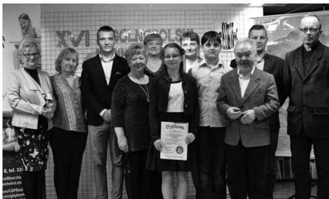
Laureci, jurorzy i goście gali konkursowej