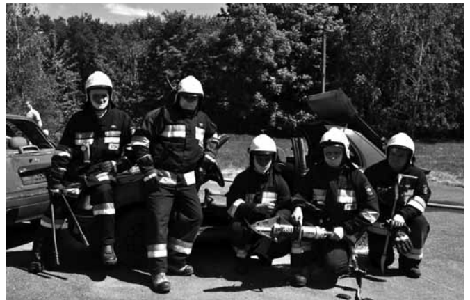
Ratownicza ekipa OSP Janowice