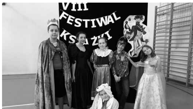
Reprezentacja szkoły w Janowicach