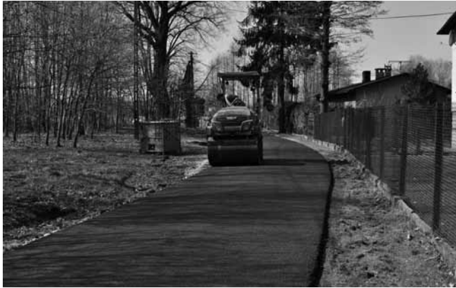
Asfaltowanie ul. Podpolec

Na przełomie marca i kwietnia rozpoczęte zostały prace związane z wykonaniem remontu ulicy Podpolec łączącej Bestwin-