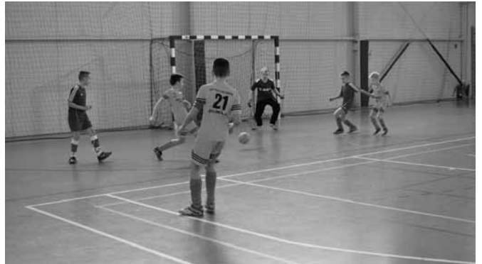
O Puchar Wójta rywalizowali młodzicy

Turniej toczył się w atmosferze „fair play” i był doskonałą okazją do integracji i podszlifowania umiejętności przed sezonem letnim. Uczestnicy otrzymali dyplomy i puchary, sprzęt sporto-