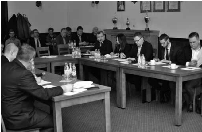
Radni zgromadzeni na XXXVI Sesji

pomniki. Jeśli zmiany nie dokona Rada Gminy, czyni to wojewoda, niemniej nowa nazwa konsultowana jest z mieszkańcami i w przypadku Bestwinki na ul. Długą zgodziła się Rada Sołectwa. Zarządzenie zastępcze uprawnia do bezpłatnej wymiany potrzebnych dokumentów takich jak prawa jazdy, dowody rejestracyjne, osobiste itd.