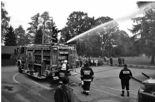
Prezentacja możliwości samochodu „Scania”

Uczniowie Zespołu Szkolno – Przedszkolnego w Kaniowie z radością włączyli się w obchody 110 – lecia powstania Ochotniczej Straży Pożarnej w swoim sołectwie. Pod opieką swoich nauczycieli licznie uczestniczyli w zorganizowanym 4 maja przez samych strażaków Dniu Otwartej Strażnicy i pokazie ratownictwa na terenach rekreacyjnych. Komendant gminny Grzegorz Owczarz serdecznie przywitał wszystkich uczestników imprezy i na bieżąco komentował to, co działo się pod estradą. Druhowie z użyciem specjalistycznego sprzętu uwolnili ofiarę wypadku z wraku samochodu a następnie udzielili poszkodowanemu pierwszej pomocy. Z wielkim aplauzem spotkał się również „pokaz siły” ciężkiego samochodu bojowego „Scania”. Po użyciu działka gaśniczego nawet dalej stojący widzowie byli nieco przemoczeni. Nowy nabytek OSP Kaniów można było swobodnie oglądać, wystawiono ponadto pozostały sprzęt pożarniczy. Rozstrzygnięto także konkursy współorganizowane przez