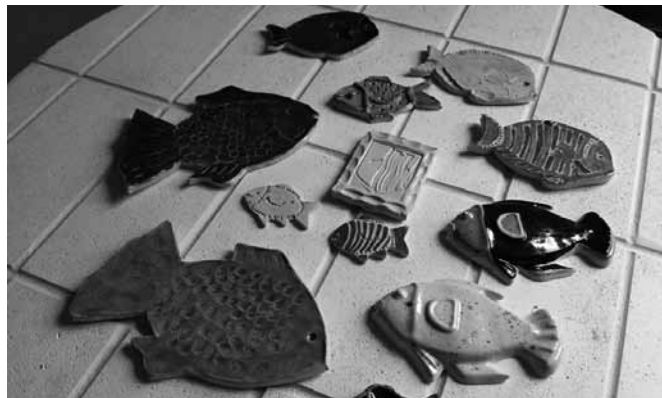
Symbole gminy Bestwina - karpie