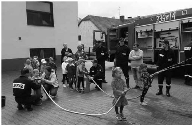
Bestwinka - atrakcje dla dzieci

gólnie dzieciaki – wiele z nich chciałoby zostać w przyszłości druhami i druhami, zasilić szeregi MDP a potem OSP. Podobnie jak w Kaniowie (o czym mowa w innym artykule), specjalne pokazy zorganizowały także OSP Janowice (6 maja) i OSP