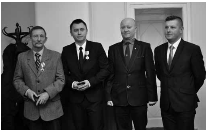
Z odznaczonymi krwiodawcami

Krwiodawcy z gminy Bestwina należą do najaktywniejszych lokalnych społeczności, akcje oddawania krwi organizowane są cyklicznie, często też przy okazji imprez plenerowych. Wtedy