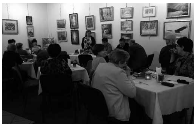
Członkowie Towarzystwa Miłośników Ziemi Bestwińskiej

Zjazd rzeczywiście odbił się w regionie szerokim echem i był komentowany w mediach. Na nim jednak działalność się nie koń-