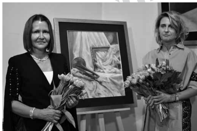
Autorki wystawy zaprezentowanej w muzeum

Biznesu i podyplomową historię sztuki. Była nauczycielką, a także prowadziła szkolenia. Poznając innych malarzy wspiniała się stopniowo na artystyczny parnas, co w końcu poprowadziło ją na konkursowe salony (m.in. XX Ogólnopolski Konkurs Sztuki im. Vincenta van Gogha). Maluje akwarelami i olejem.