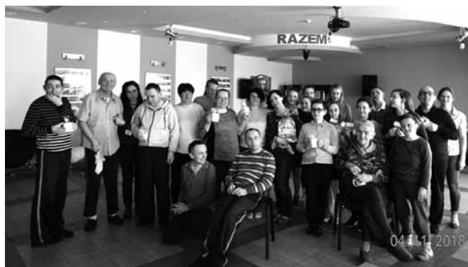
Z podopiecznymi „Razem”

11 kwietnia wolontariusze Szkolnego Klubu Wolontariatu z ZSP Janowice udali się z wizytą do ośrodka w Bestwinie, w którym przebywają osoby z upośledzeniem umysłowym. Mieszkańcy wraz z opiekunami przygotowali dla nas program artystyczny, symboliczne przedstawienie o dwóch dzbanach, tańce, do których i my zostaliśmy zaproszeni oraz słodki poczęstunek. My podarowaliśmy im kubki zakupione z pieniędzy zebranych podczas akcji sprzedaży toreb wielokrotnego użytku. Na kubkach zostały umieszczone imiona mieszkańców, co sprawiło obdarowanym wielką radość. Dużo większą sprawiły im jednak nasze odwiedziny, wspólne rozmowy i tańce. My w ramach podziękowań otrzymaliśmy ręcznie wykonaną przez mieszkańców ośrodka pamiątkę z podziękowaniami.