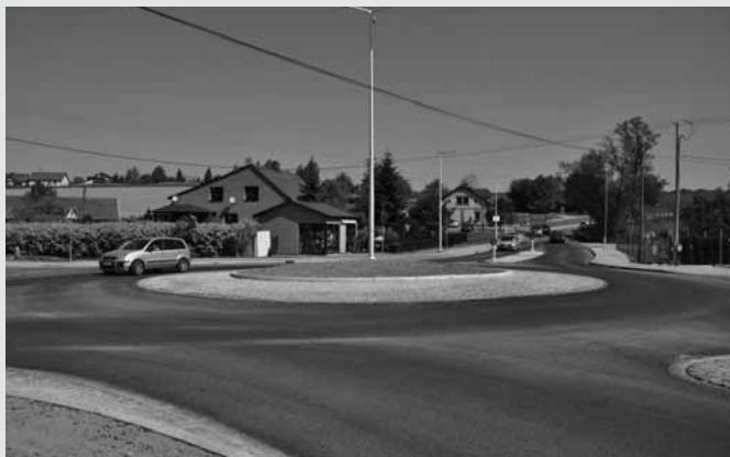
Rondo przy Piekarni w Bestwinie

Kierowcy przejeżdżający w okolicach piekarni w Bestwinie mogą już bez przeszkód podążać drogą na „Magówkę” i na Janowice. Powstało tam kolejne w naszej gminie rondo: zadanie współfinansowane jest ze środków gminy Bestwina oraz bielskiego Starostwa Powiatowego.