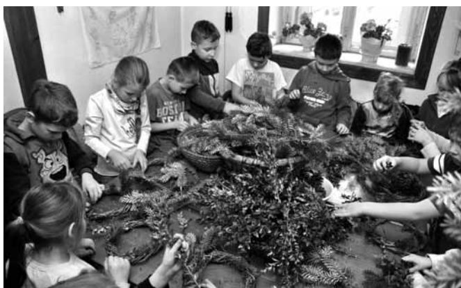
Dzieci tworzyły wieńce z naturalnych surowców

Muzeum Regionalne im. ks. Zygmunta Bubaka proponuje dzieciom stworzenie oryginalnych ozdób na bożonarodzeniowy stół lub jakiegokolwiek eksponowane miejsce w domu rodzinnym. Wieńce świąteczne wykonane w dniu 13 grudnia nawiązują przecież do lokalnych, bestwińskich tradycji!