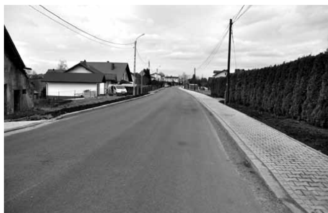
Ul. Janowicka po remoncie

Wartość dofinansowania: 1 018 937,00 PLN