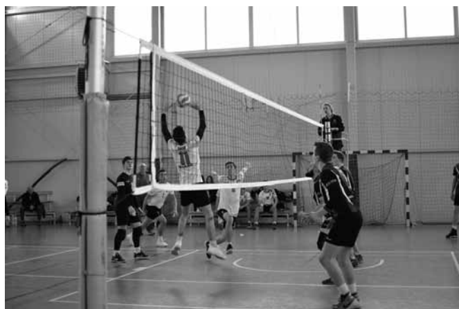
Emocji pod siatką nie brakowało

Klub Sportowy Gminy Bestwina zaproponował sportowcom – amatorom w różnym wieku ciekawe turnieje siatkarskie. 27 stycznia w hali przy ZSP w Kaniowie miał miejsce Noworoczny Turniej Mini Piłki Siatkowej dla Dziewcząt i Chłopców, natomiast w niedzielę, 28 stycznia rozgrywano III Noworoczny Turniej Piłki Siatkowej Mężczyzn.