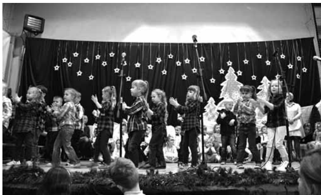
Seniorzy podziwiali występy swoich wnucząt