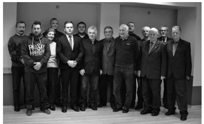
Nowy zarząd Spółki Wodnej