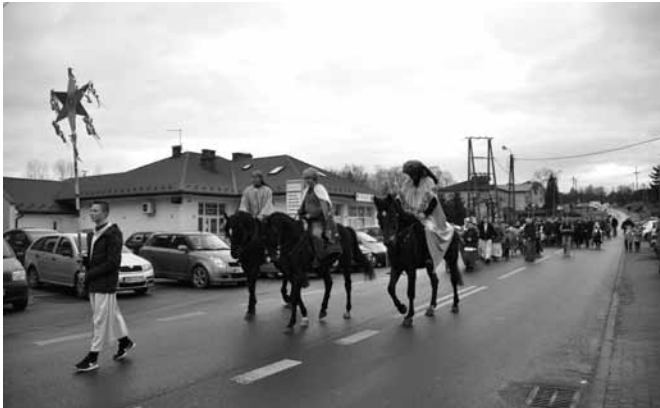
W janowickim pochodzie uczestniczyli również jeźdźcy konni

Kim byli słynni „Mędrcy ze Wschodu”? - Jedni mówią o uczonych, inni o magach, jeszcze inni o astrologach, zaś tradycja i słowa kolędy wskazują wręcz na monarchów. Jedyną wzmiankę o tych fascynujących postaciach znajdujemy w Ewangelii według św. Mateusza (Mt 2, 1-12). Zobaczywszy gwiazdę, mędrcy wyruszyli do Betlejem by oddać hołd nowo narodzonemu Jezusowi a także złożyć dary – złoto, kadzidło i mirrę. W Kościele katolickim święto Trzech Króli znane jest jako uroczystość Ob-