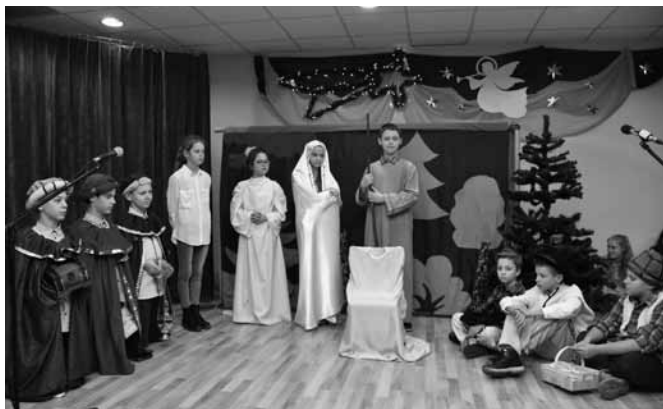
Pokłon pasterzy i Trzech Króli