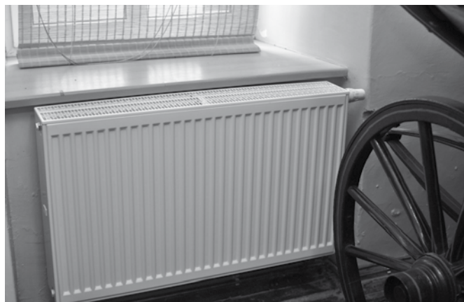
Muzeum Regionalne zyskało nowe grzejniki

W bestwińskim Muzeum Regionalnym zostało wykonane w ostatnim czasie zadanie inwestycyjne polegające na montażu centralnego ogrzewania. Oto krótka charakterystyka obiektu i przeprowadzonych działań: