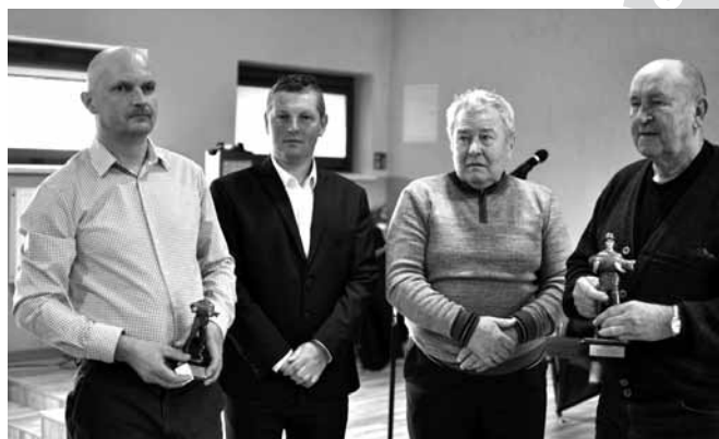
Wręczenie nagród w klasyfikacji „Wędkarz Roku”

Podczas zebrania (już trzeciego od przekształcenia sekcji wędkarskiej w Stowarzyszenie) nastąpiło wręczenie nagród dla