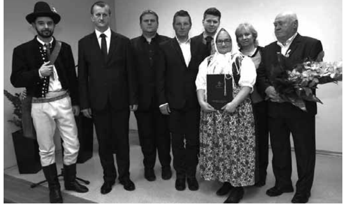
Laureaci nagród oraz reprezentacja gminy Bestwina

wyróżniony został odznaką honorową „Zasłużony dla Kultury Polskiej”.