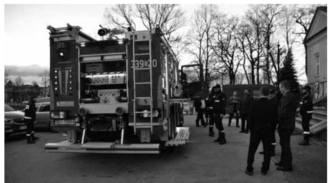
Radni oglądali nowy wóz bojowy OSP Kaniów