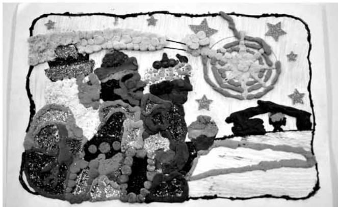
Jedna z nagrodzonych prac