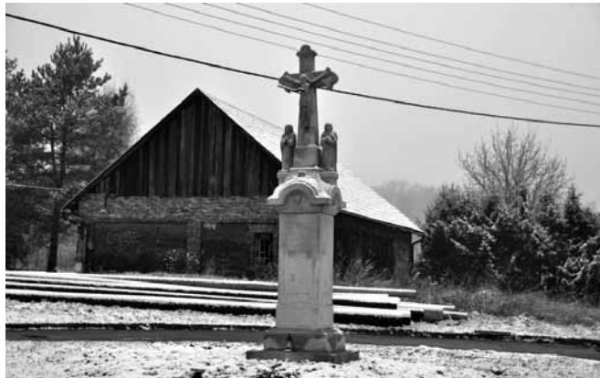
Odnowiony krzyż w Janowicach