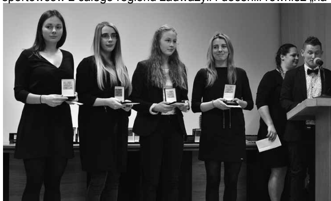
Nagrodzone zawodniczki UKS „Set” Kaniów