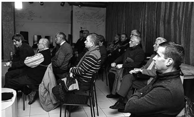
Mieszkańcy Czechowic - Dziedzic wysłuchali wykładu o królewskim karpniu

renie Włoch, z eksportem karpia do Ameryki i troską o zdrowie hodowanych ryb. Prześledzili życie rodzinne kaniowskiego