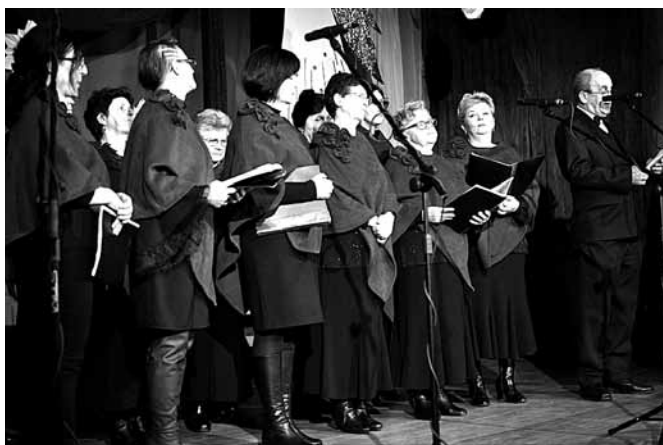
Śpiewa chór „Ave Maria”

Są na świecie takie miejsca, gdzie zamiast kolęd ludzie słyszą wybuchające bomby. Zamiast prezentów otrzymują cierpienie, zamiast radości – rozpacz. Przedłużający się konflikt w Syrii zwraca uwagę opinii publicznej na ten zakątek świata, przynagla również organizacje charytatywne do pospieszenia z pomocą humanitarną. Co możemy zrobić my, mieszkańcy gminy Bestwina? Do Syrii nie pojedziemy, lecz jeśli odpowiemy na wezwanie Caritas Polska, nasze datki wywołają uśmiech na twarzy niejednej poszkodowanej rodziny.