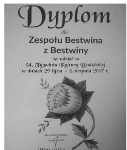
Dyplom dla Zespołu za udział w TKB