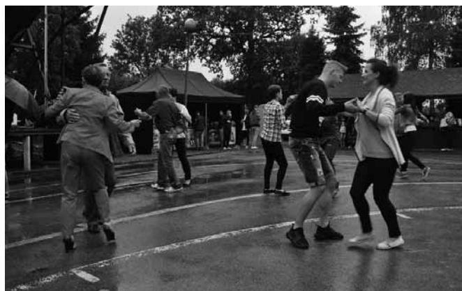
Zabawa taneczna na terenach rekreacyjnych