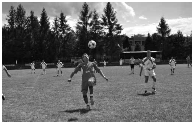
Mecz strażaków z zarządem i przyjaciółmi LKS „Przełom”

młodzików najlepiej spisał się LKS Bestwina. Mecze towarzyskie rozegrali strażacy z OSP Kaniów z Zarządem i Przyjaciółmi „Przełomu” jak również reprezentacja Zagłębia Dąbrowskiego z klubem Concordia Knurów.