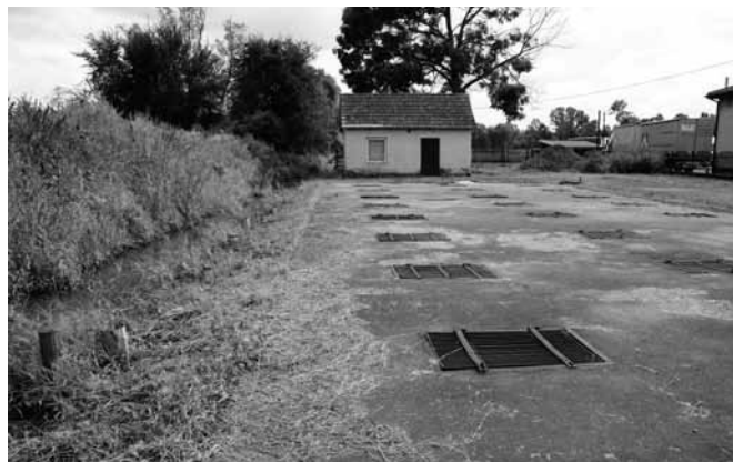
Fot. 3. Magazyny spółki 2016 rok

Przyjęte założenia organizacyjne spowodowały, że wspólnymi działaniami jest zainteresowanych do dzisiaj większość hodowców ryb w Bestwinie. Aktualnie funkcjonują tam dwa centra magazynowe, jedno przedwojenne oraz drugie wybudowane już po wojnie według podobnych założeń projektowych (fot. 3).