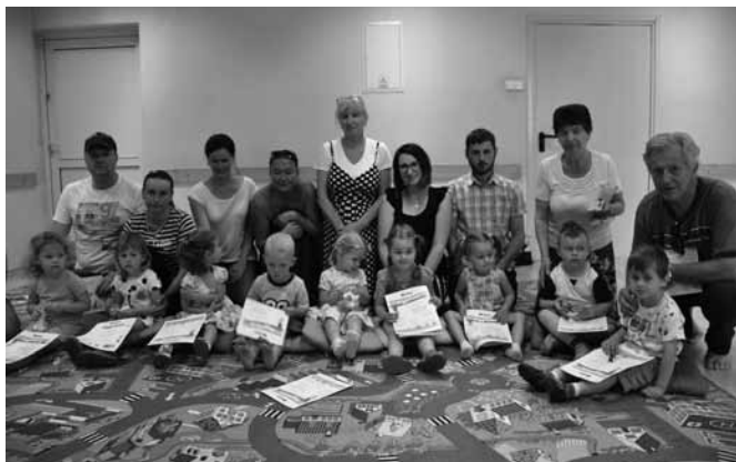
Jedna z grup kończących całoroczne zajęcia