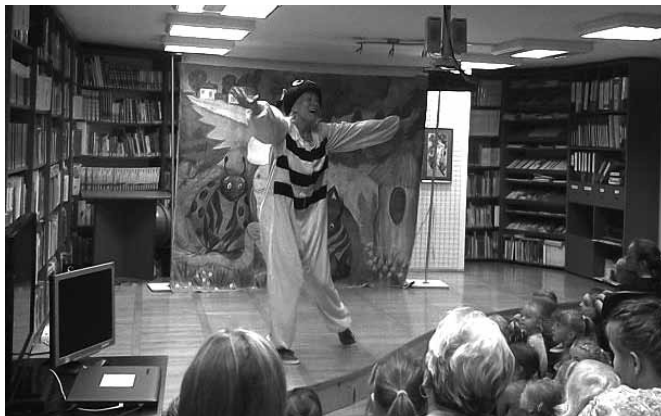
Przedstawienia cieszyły się wysoką frekwencją