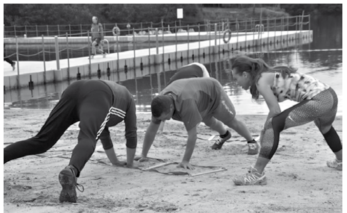
Jedna z konkurencji