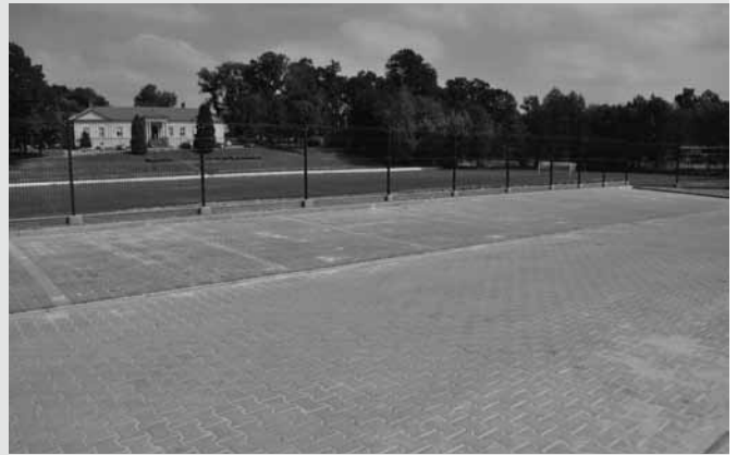
Parking na ul. Podzamcze w Bestwinie

Zakończono budowę parkingu przy ul. Podzamcze w Bestwinie. Inwestycja ta objęła budowę 42 miejsc postojowych. Ponadto wykonano chodnik dla pieszych, drogę manewrową, mur oporowy od strony boiska LKS Bestwina, ogrodzenie i kanalizację deszczową. Na zadanie wydano ok. 300 tys. zł.