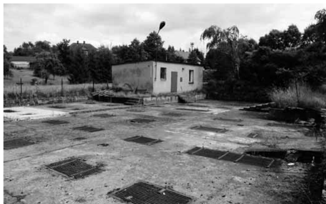
Fot. 2. Teren starych magazynów, obecnie nieużytkowanych

Pod egidą Krajowego Towarzystwa Rybackiego w Krakowie wybrano teren na magazyny ryb nad potokiem Łękawka i za-