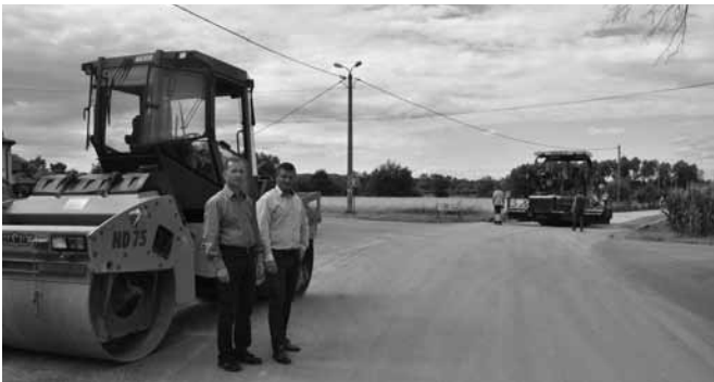
Asfaltowanie ul. Czechowickiej w Kaniowie