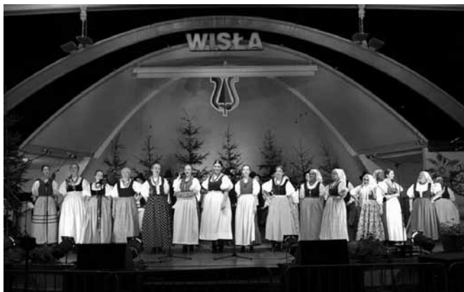
Występ na scenie w Wiśle

ce zamawiał u orkiestry mężczyzna, ten jeden zarezerwowano dla kobiet. Nasz Zespół Regionalny wykonywał go w szesnastu parach.