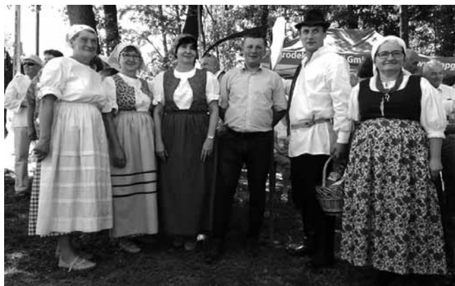
Reprezentacja gminy Bestwina w Jasienicy

Relacja fotograficzna: archiwum wójta Artura Beniowskiego