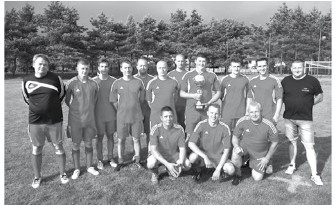
Drużyna OSP Kaniów