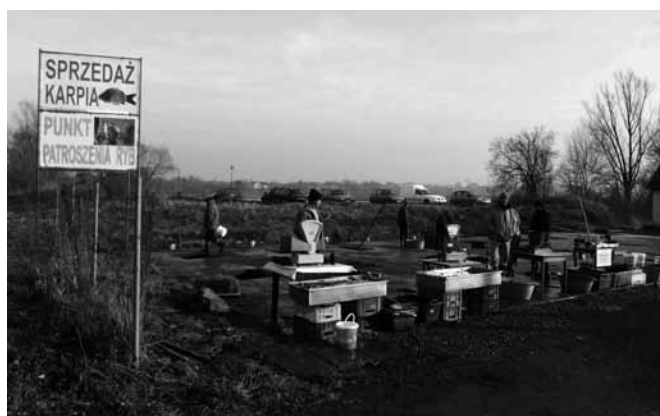
Fot. 4. Sprzedaż detaliczna w grudniu

Przy nowych magazynach, w grudniu uruchomiany jest punkt patroszenia ryb, formalnie dopuszczony przez Powiatowego Lekarza Weterynarii. Fakt ten również świadczy o operatywności rybaków bestwińskich, śledzących zmiany preferencji konsumenckich i wprowadzający nowe formy sprzedaży w życie. Dozór magazynów przez wynajętego pracownika finansowany jest przez członków spółki, ustalana jest również jedna obowiązująca w grudniu cena detaliczna karpia (fot. 4).