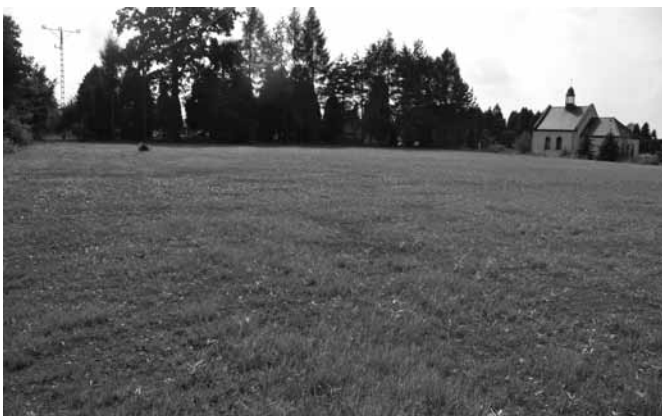
Terren pod boisko przy szkole w Kaniowie

Tyle same fakty. Zapytaliśmy wójta Artura Beniowskiego, jakie przełożenie te zmiany będą miały na funkcjonowanie skomplikowanej „szkolnej machiny”.