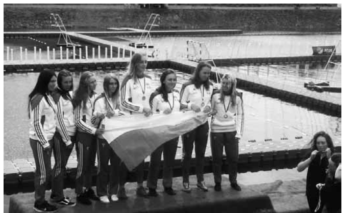
Kobiety U19 na podium w Belfaście