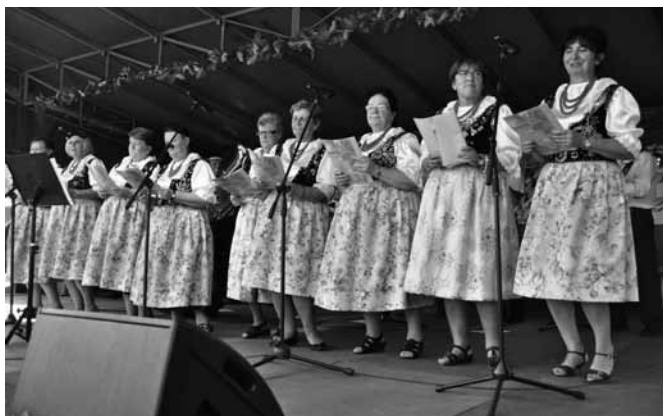
Panie z KGW w Janowicach

Koło Gospodyń Wiejskich w Janowicach zdecydowało się na przekształcenie w stowarzyszenie. Panie podjęły tę decyzję na zebraniu w dniu 15 lipca, natomiast 29 VII zostały przegłosowane wymagane prawem uchwały, wybrano zarząd i komisję