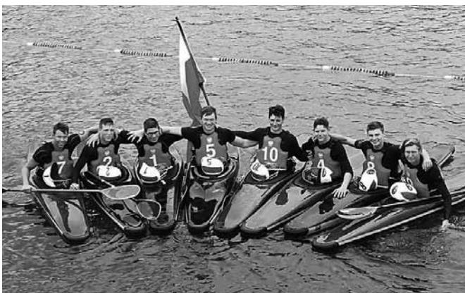
Męska reprezentacja juniorów

5:1, natomiast reprezentacja U16 zwyciężyła 4:0 z CR PAYS DE LA LOIRE 4 (Francja). Panie U19 nie ustąpiły nawet mężczyznom – w ich grupie zajęły trzecie miejsce! Słabszy występ na „The World Games” został zatem w pełni zrekompensowany.