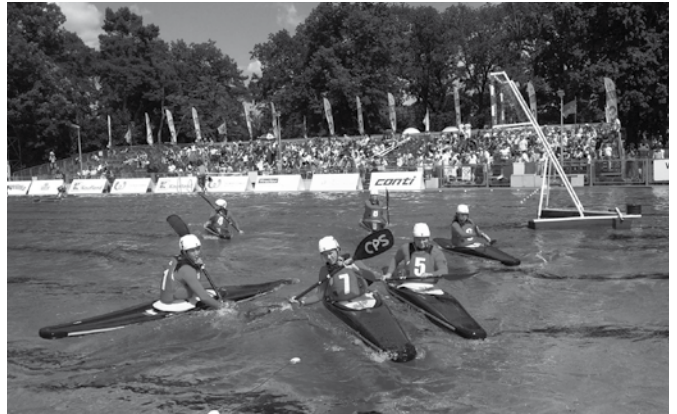
Rozgrywki na basenie we Wrocławiu

„The World Games 2017” niestety, nie będę wspominać zbyt dobrze. Zajęć ostatnie miejsce, podczas gdy liczyło się na me-