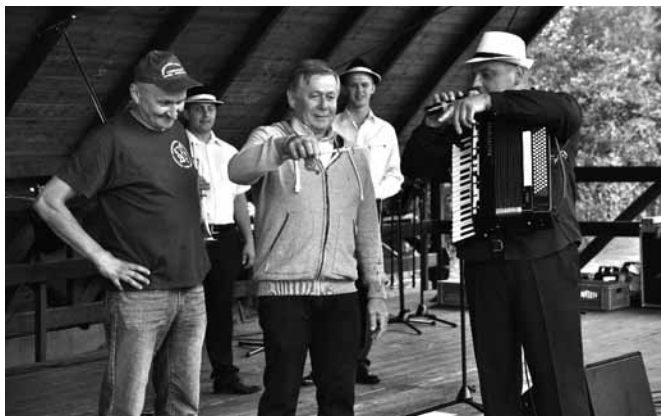
Gry i zabawy przeprowadziła kapela „Janowianka”