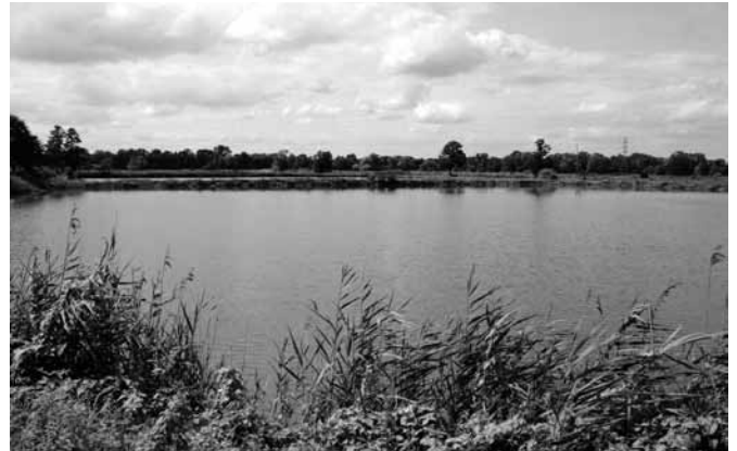
Fot. 6. Widok ogólny na stawy w Bestwinie

Niezależnie jednak od szyldu i formy organizacji, do dzisiaj zachowana została idea zrzeszania rybaków z Bestwiny i okolic, dbania o dobry stan techniczny systemu nawadniania i odwadniania stawów, wspólnego magazynowania ryb, uzgadniania korzystnych cen zbytu ryb, prowadzenia szkoleń, itd. Aktualnie zrzeszonych jest ok. 100 hodowców z Bestwiny i przyległych miejscowości, wnoszących indywidualną roczną stawkę, w zależności od powierzchni stawu na rzecz spółki w wysokości 80-125 zł/ha.