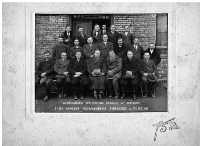
Fot. 1. Włościańska spółka

W 1937 roku z inicjatywy Krajowego Towarzystwa Rybackiego w Krakowie 80 lat temu powstała „Włościańska Spółdzielnia Rybacka”, której celem była poprawa opłacalności produkcji ryb prowadzonej przez członków spółdzielni (fot. 1). Jako priorytetowe zadanie uznano budowę magazynów rybnych i zorganizowanie wspólnej sprzedaży ryby kupieckiej, dzięki której bestwińscy chłopcy mogli uwolnić się od nierzetelnych handlarzy oferujących nieatrakcyjne ceny i terminy płatności.