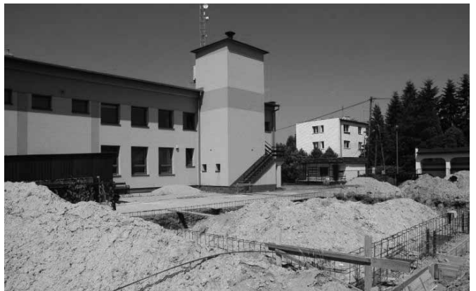
Budowany magazyn przeciwpowodziowy

Przy lokalizacji wzięto również pod uwagę to, że tutejsza jednostka OSP specjalizuje się w ratownictwie wodnym i jest dobrze przygotowana do działań przeciwpowodziowych, na dodatek miejsce jest łatwo dostępne, każdy mieszkaniec bez trudu tutaj trafi.