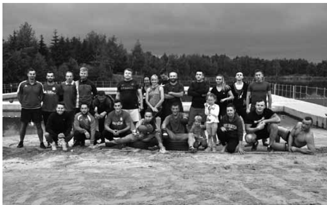
Uczestnicy treningu w komplecie

Przed rozpoczęciem zawodów ekipy podzielono na trójki zmieniające się na poszczególnych stacjach. Stanowiska nieco przypominały znane niektórym z wojska place do ćwiczeń. „Boot camp” wywodzi się przecież bezpośrednio ze szkolenia armii Stanów Zjednoczonych. Publiczność mogła zobaczyć biegi, czołganie się pod przeszkodą, przeciąganie opony, boks, ćwi-