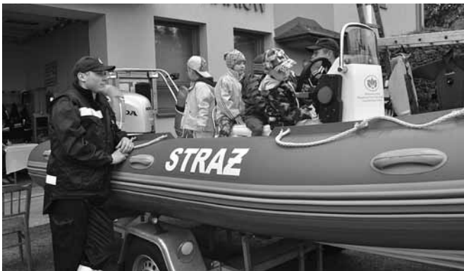
Pokaz sprzętu strażackiego w OSP Kaniów

Z okazji Dnia Świętego Floriana, patrona strażaków i Tygodnia Ochrony Przeciwożarowej, druhowie z naszych jednostek urządzili dla mieszkańców, wzorem lat ubiegłych, „Dni Otwartej Strażnicy”. Imprezy cieszyły się dużym zainteresowaniem najmłodszych miłośników pożarnictwa. Uczniowie Zespołów Szkolno – Przedszkolnych chętnie wsiadali do samochodów bojowych i łodzi pontonowej, przymierzali elementy umundurowania, próbowali swoich sił w polewaniu wodą z hydronetki. Wspólnie z nauczycielami złożyli strażakom życzenia a na końcu pozowali do