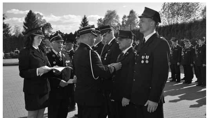
Wręczenie odznaczeń pożarniczych