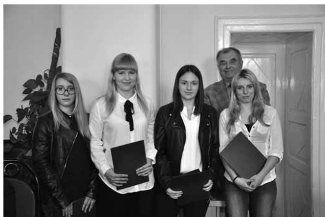
Nagrodzone zawodniczki UKS „Set” Kaniów

gały sukcesy na arenach województwa, Polski, Europy a nawet i światowych, zwracając oczy publiczności na herb z rybą i kłosem. Nie tylko dla medali, statuetek ale i szeroko rozumianej promocji. Wójt gminy Bestwina Artur Beniowski wręczając nagrody ustanowione przez radnych w 2013 r. wyraził w imieniu mieszkańców podziękowanie i zachęcił do rozwijania licznych talentów. Trzeba powiedzieć, że sukcesy nie są sprawą wyłącznie indywidualną – zapracowali na nie także trenerzy, instrukto-