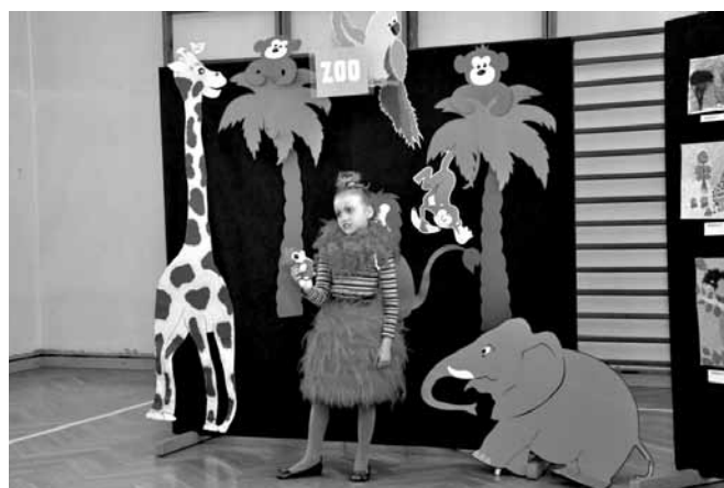
Nie brakowało pomysłowych kreacji!