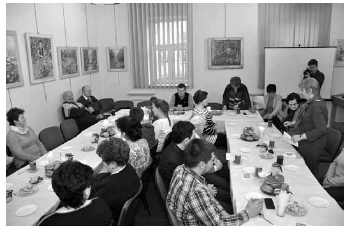
Członkowie TMZB spotkali się na zebraniu podsumowującym rok pracy