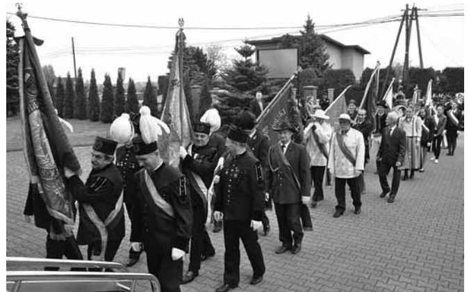
Przejście pocztów sztandarowych