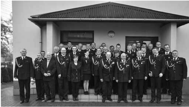
Zarząd gminny OSP oraz zaproszeni goście