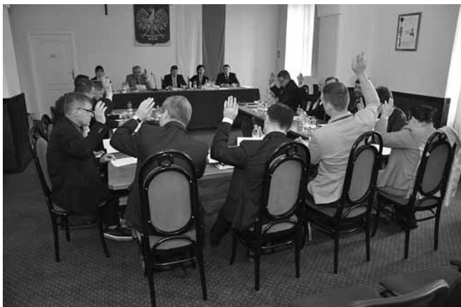
Głosowanie nad udzieleniem absolutorium za wykonanie budżetu