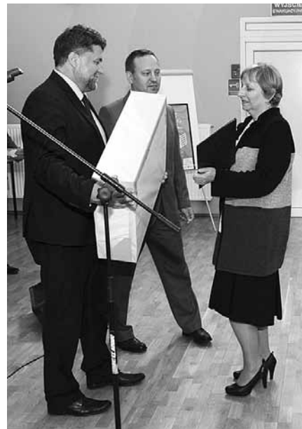
Powiatowa nagroda dla GBP w Bestwinie