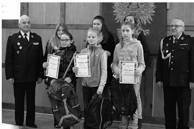
Rozdanie nagród na zakończenie etapu gminnego