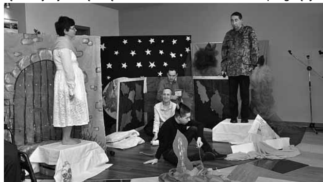
Występ podopiecznych stowarzyszenia „Razem”

Ośrodek Mieszkalno – Rehabilitacyjny dla osób niepełnosprawnych przy ul. Sikorskiego w Bestwinie jest miejscem niejako „zawieszonym między niebem a ziemią”. Placówką powstają i utrzymywane dzięki ludziom o sercach aniołów pragnącym