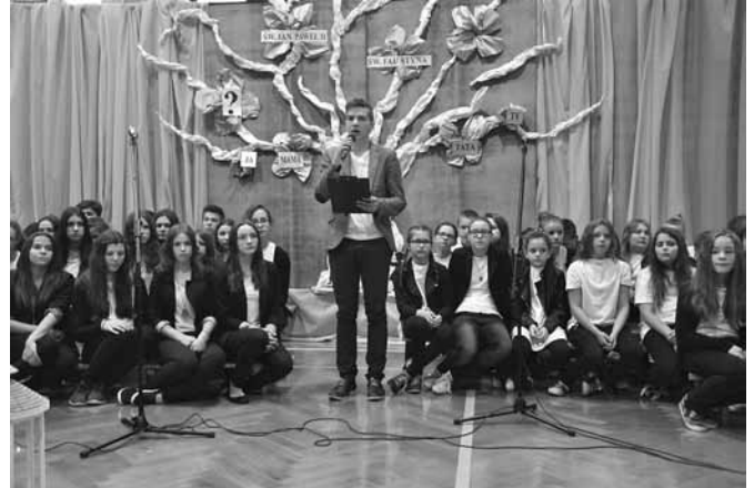
Uczniowie opowiedzieli o życiu Jana Pawła II