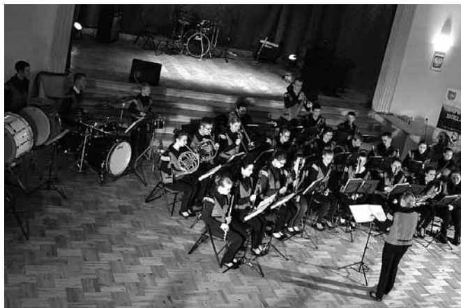
Występ „Con Fuoco Band” w Kozach