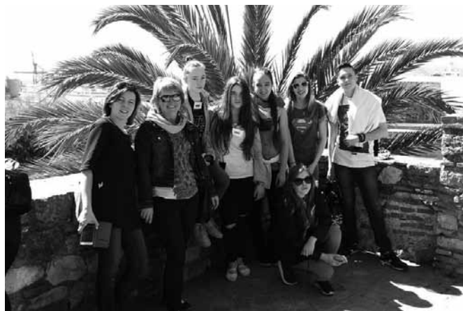
Uczniowie z Bestwinki w Hiszpanii

stwa naturalnego regionów, z których pochodzą poszczególni partnerzy. Po południu każdy z partnerów zaprezentował również przywiezione ze sobą plakaty na temat ochrony środowiska. Przez kolejne dni uczniowie wzięli udział w warsztatach, podczas których wykonywali biżuterię i różnego rodzaju akcesoria z materiałów recyklingowych.