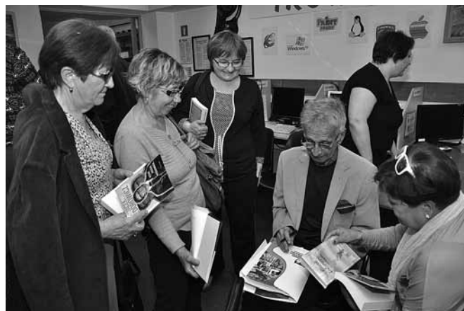
Po spotkaniu przyszedł czas na autografy