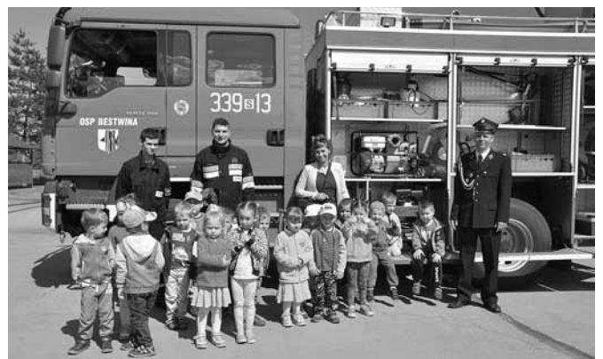
Spotkanie ze strażakami w Bestwinie

pamiątkowych fotografii. Akcje takie jak ta mają na celu popularyzację Straży Pożarnej w społecznościach lokalnych, przyczyniają się do zwiększenia wiedzy na temat zakresu działalności OSP obejmującej nie tylko gaszenie pożarów, lecz również ratownictwo specjalistyczne. Gospodarze Dni Otwartych opowiedzieli ponadto o podstawowych zasadach bezpieczeństwa – numerach alarmowych 998 i 112, obowiązku używania pasów oraz fotelików dziecięcych. To ratuje życie!