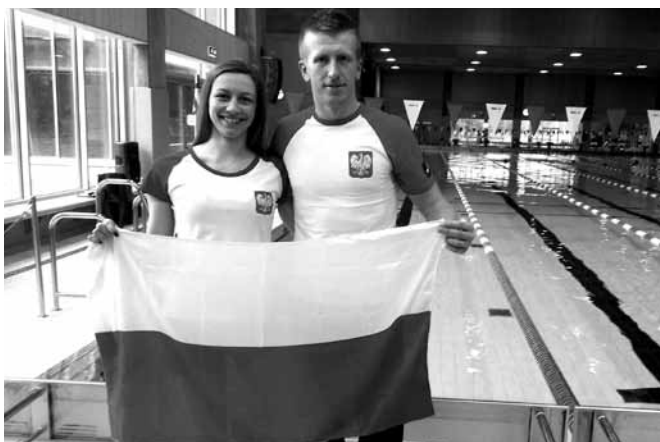
Nasza mistrzyni pobiła dwa rekordy Polski

Od 1 do 3 kwietnia 2016 r. w mieście Turku na arenie tegorocznych czerwcowych Basenowych Mistrzostw Świata startowałam w otwartych mistrzostwach Finlandii. Podczas zawodów startowaliśmy w 3 konkurencjach: DNF, STA i DYN. Dolecieliśmy na miejsce w piątek nad ranem. Miałam cały dzień na odpoczynek, wieczorem odbył się trening – niezwykle istotna część zawodów, kiedy to poznajemy pływalnię i warunki tam panujące. W sobotę odbywała się rejestracja i odprawa zawodników, po której mogliśmy przystąpić do części głównej – startów. Roz-