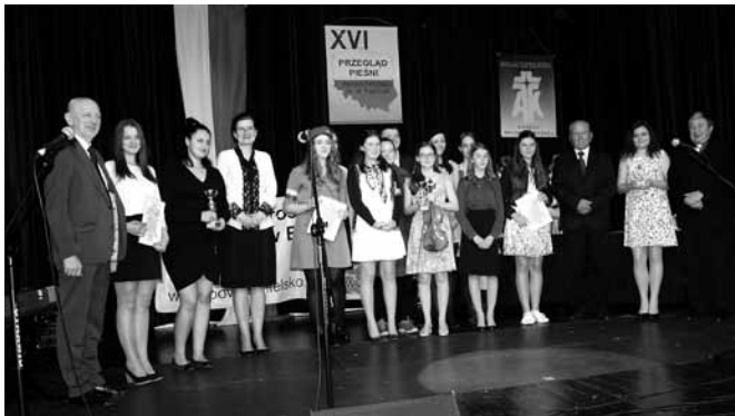
Wśród wyróżnionych - młodzi artyści z gminy Bestwina