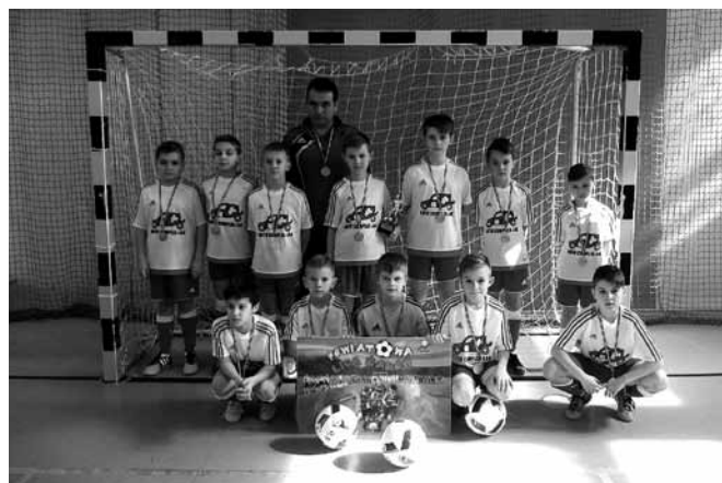
Drużyna żaków KS Bestwinka