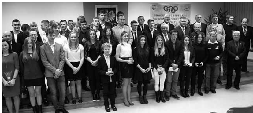
Wśród nagrodzonych znaleźli się sportowcy z gminy Bestwina

Opracowanie: Sławomir Lewczak Więcej na stronach Starostwa Powiatowego oraz Urzędu Gminy Bestwina