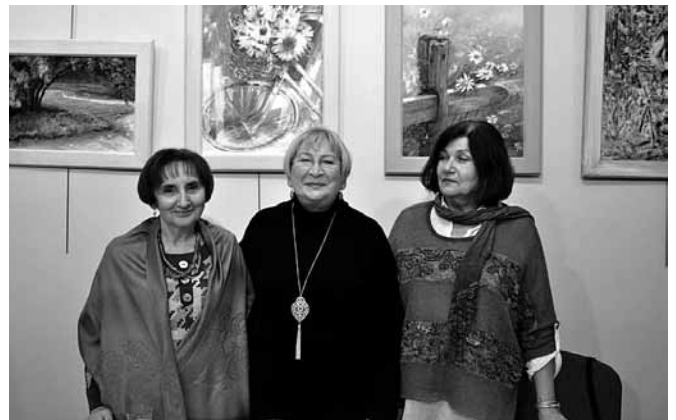
Autorki wystawy i ich obrazy