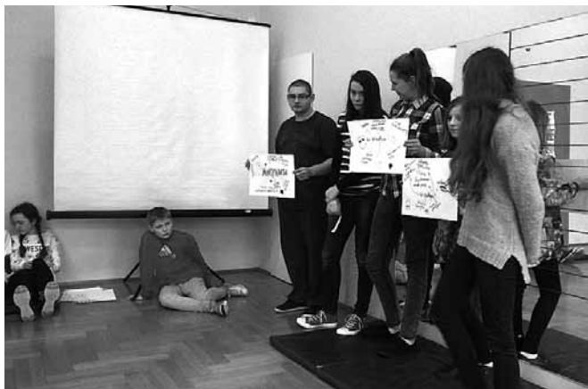
Zajęcia w ramach projektu

Projekt „Wyedukowany uczeń – aktywny obywatel” dofinansowany był ze środków Ministerstwa Pracy i Polityki Społecznej