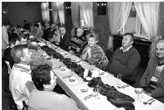
Zebranie walne Klubu Seniora