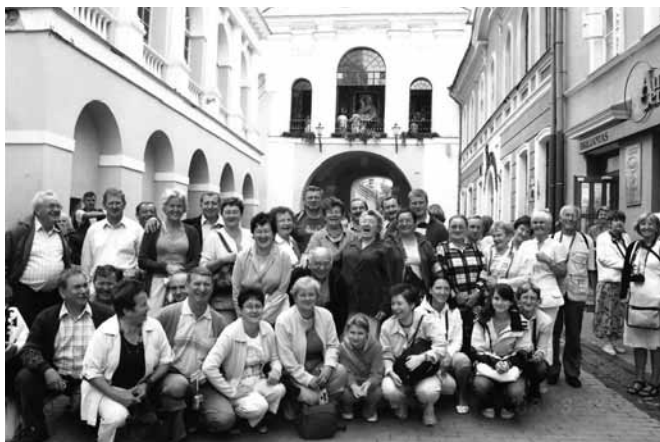
Przed Ostrą Bramą w Wilnie