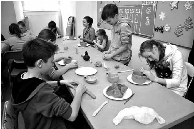
Wyjazdowe zajęcia w Bielsku-Białej

Skuteczna działalność każdej organizacji charytatywnej opiera się przede wszystkim na ludziach. Im więcej otwartych serc, tym większa szansa na dotarcie z pomocą do potrzebujących. Na walnym zebraniu Stowarzyszenia Pomocy Dzieciom, Młodzieży i Rodzinom „Z Sercem na Dłoni” w dniu 4 marca kwestię zaproszenia do współpracy nowych wolontariuszy poruszono szczególnie mocno i apel ten należy ponowić także w tym miejscu. Działające w Kaniowie i poza nim Stowarzyszenie od kilku lat zabiega o poprawę sytuacji życiowej osób chorych (zwłaszcza