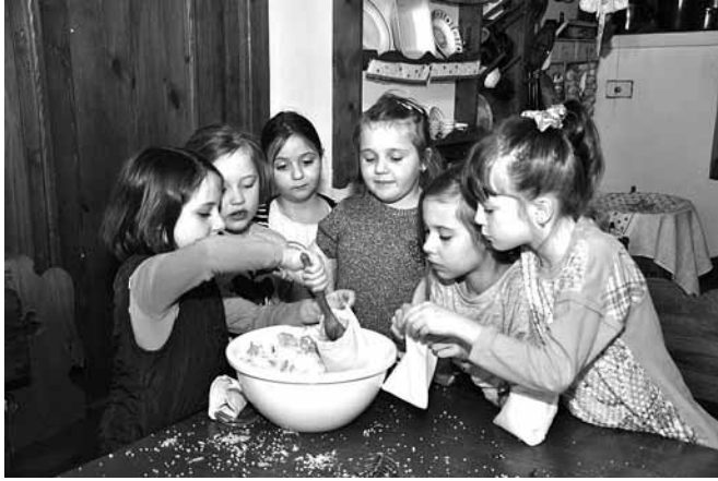
Wyrabianie soli kąpielowych to świetna zabawa

innymi na wytwarzaniu przedmiotów), że swoje wytwory dzieciaki zabierają do domów.