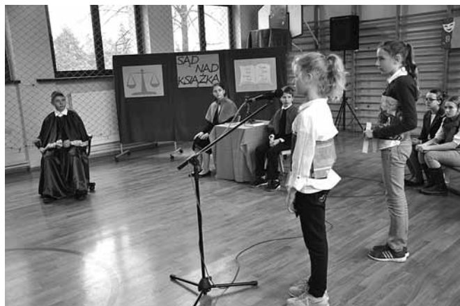
Uczniowska rozprawa sądowa

planie znanego sądowego filmu „Dwunastu gniewnych ludzi” bądź serialu „Sędzia Anna Maria Wesołowska”.