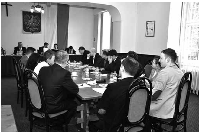
Rada Gminy podczas podejmowania uchwał