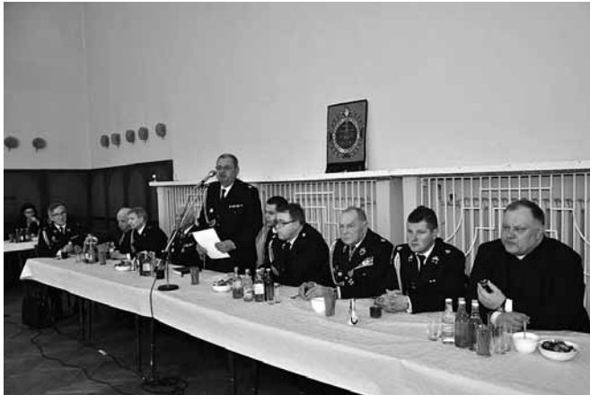
Zebranie w OSP Bestwina - stół prezydalny