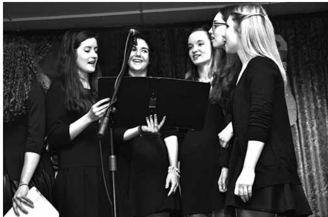
Bestwinka - Występ chóru „Allegro”