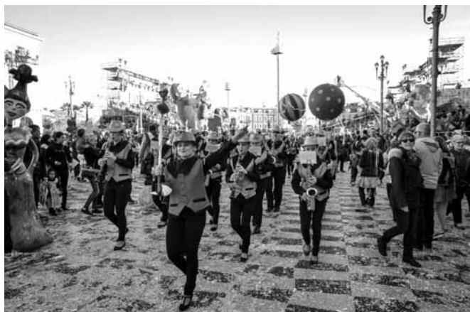
Nasza orkiestra na paradzie w Nicei

W dniach 19 – 25 II 2016 r. Orkiestra Dęta Gminy Bestwina z Siedzibą w Kaniowie udała się do Francji a konkretnie do Nicei, by uczestniczyć w paradach podczas trwającego tam przez 15 dni karnawału. Impreza trwała od 13 do 28 lutego - ma ponad 140-letnią tradycję i jest jedną z największych na świecie. Nie bez powodu Nicea nazywana bywa europejskim Rio de Janeiro. Najważniejsze turystyczne wydarzenie sezonu zimowego na całym Lazurowym Wybrzeżu przyciąga milion widzów – zarówno miejscowych jak i przyjezdnych. Tym razem