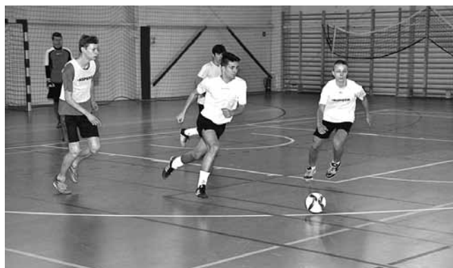
Halowe rozgrywki w ramach turnieju