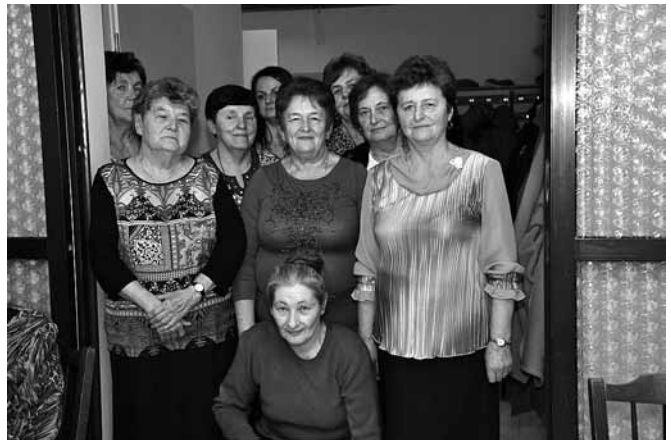
Zarząd KGW w Bestwinie