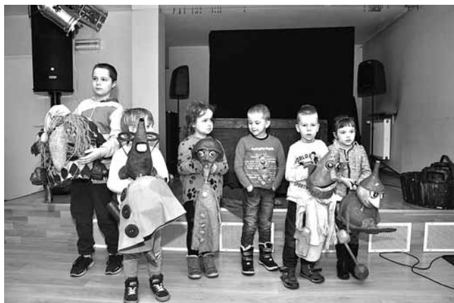
Warsztaty lalkarskie w CKSiR