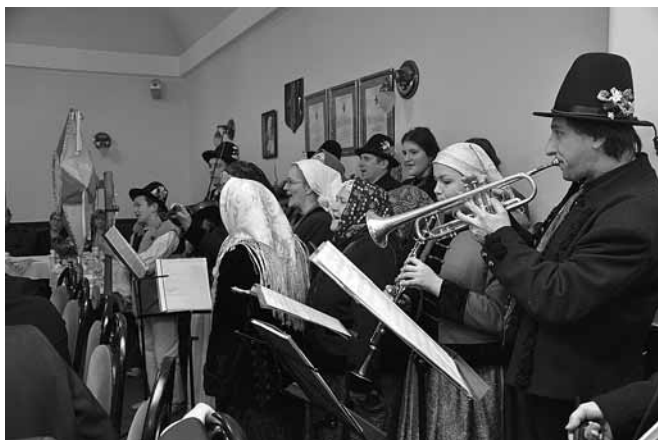
Koncert zespołu regionalnego „Bestwina”