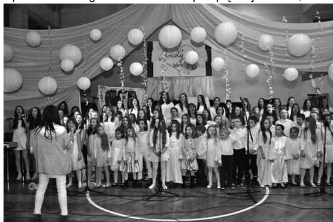
Koncert kolęd i piosenek

białych dekoracji, przez prawie trzy godziny przybyli goście odkrywali świat muzyki i teatru, świat dostępny na wyciągnięcie ręki dla tych którzy mogą i chcą zrobić dobro.