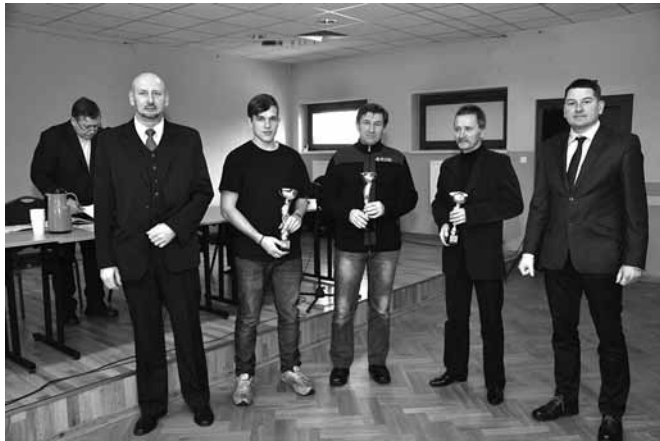
Podsumowanie klasyfikacji „Wędkarza Roku”