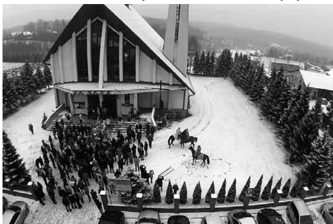
Orszak Trzech Króli w Janowicach z lotu ptaka

Przekaz biblijny nie precyzuje, ilu dokładnie było mędrców przybywających za gwiazdą do Betlejem. Jednakże wielowiekowa tradycja wskazuje, że było ich trzech, jak wynika z ilości darów. Tymże gościom ze wschodu przypisuje się imiona Kacpra, Melchiora i Baltazara. Inicjałami Trzech Króli znaczymy drzwi