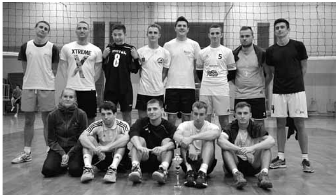
Seniorska drużyna siatkarki UKS „Set” Kaniów