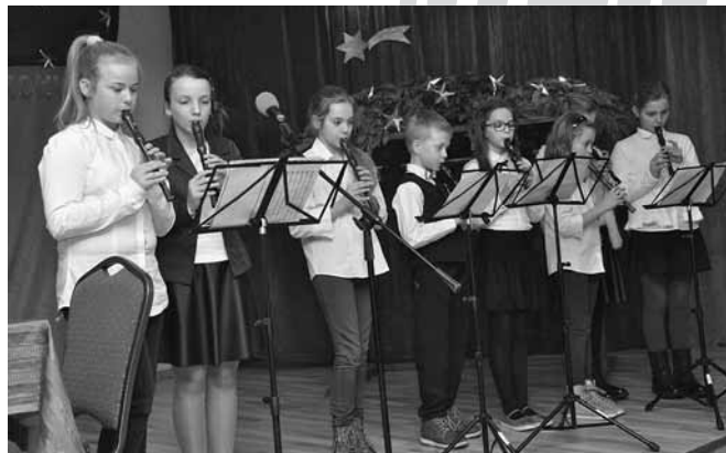
Występy dzieci z ZSP Kaniów