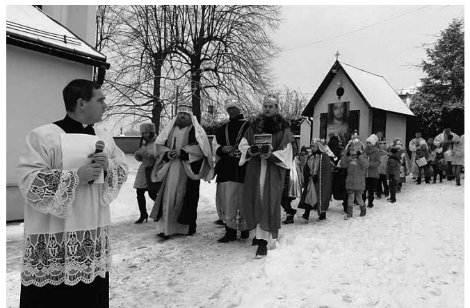
Barwny korowód w Bestwinie

W wielu krajach świata Objawienie Pańskie 6 stycznia obchodzi się bardzo uroczysto organizując na przykład orszaki Trzech