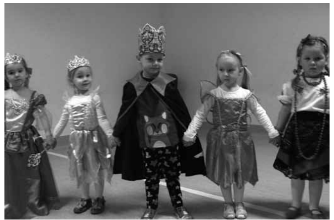
Pomysłowe i oryginalne stroje przedszkolaków

Wystrój sali wprowadził w radosny nastrój oraz zachęcał do wesołej zabawy. Przedszkolaki świetnie się bawiły, uczestni-