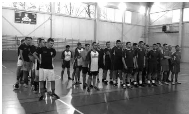
Piłkarskie drużyny jednostek OSP

21 Listopada w Kaniowie odbył się Gminny Turniej Piłki Halowej między jednostkami Ochotniczych Straży Pożarnych, organizowany przez OSP Janowice. Po rozegraniu meczów na zasadach „każdy z każdym” klasyfikacja końcowa przedstawia się następująco: