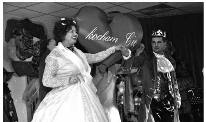
Scena z przedstawienia

Tak oto zawiązuje się akcja przedstawienia, które mieszkańcy gminy Bestwina będą wspominać przy rodzinnych stołach chyba do końca życia. Sztuki przygotowanej przez osoby dobrze znane, gdyż pełniące w samorządzie i różnorodnych organizacjach rozmaite funkcje. Premiera w dniu 5 grudnia w kaniowskim Domu Strażaka doszła do skutku dzięki staraniom Stowarzyszenia