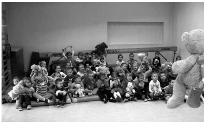
Przedszkolaki przyniosły swoich pluszowych ulubieńców

Każdy człowiek - czy mały, czy duży, zna pluszowego misia - przytulankę, powiernika dziecięcych radości, smutków, zmartwień i sukcesów. W wielu utworach literackich oraz w piosenkach Miś jest ważną postacią. Kubuś Puchatek, Miś Uszatek czy Colargol towarzyszom dzieciom i dorosłym od zawsze. Światowy Dzień Pluszowego Misia ustanowiono w setną rocznicę powstania maskotki w 2002 roku. Pierwszy miś miałby dziś