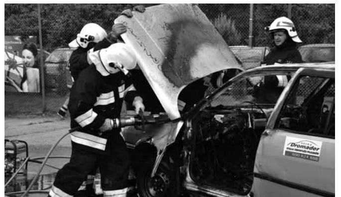
Pokaz ratownictwa technicznego

Pożarna w Bestwinie. Został z tej okazji zakupiony lekki samochód ratowniczo – gaśniczy Opel Movano, dofinansowany m.in. przez Zarząd Wojewódzki ZOSP RP w Katowicach, Krajowy System Ratowniczo – Gaśniczy i Urząd Gminy Bestwina. 9 maja odbyła się tradycyjna akademie gminna połączona z poświęceniem zestawu pływającego dla OSP Kaniów. Nie mogło zabraknąć strażaków na uroczystościach państwowych i kościelnych, ich reprezentacja wzięła udział w obchodach 25 rocznicy samorządności terytorialnej w Bestwinie (27 maja). Zabezpieczali gminne imprezy plenerowe dając przy okazji dla mieszkańców szkoleniowe pokazy umiejętności ratowniczych i gaśniczych. Dzieciom i młodzieży, oprócz systematycznej działalności MDP organizowali pogadanki i Dni Otwartej Strażnicy. Rywalizacja sportowa obejmowała letnie i zimowe (halowe) rozgrywki piłkarskie strażaków, turniej siatkówki i tenisa stołowego.