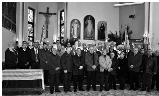
Pamiątkowa fotografia pszczelarzy i ich przyjaciół

Niezwykle pracowity będzie rok 2016. Już w styczniu zostanie wybrany nowy zarząd GKP. Odbędą się jubileusze 40 – lecia istnienia Koła i 20 – lecia stworzenia działu pszczelarzkiego w Muzeum Regionalnym im. ks. Z. Bubaka w Bestwinie.