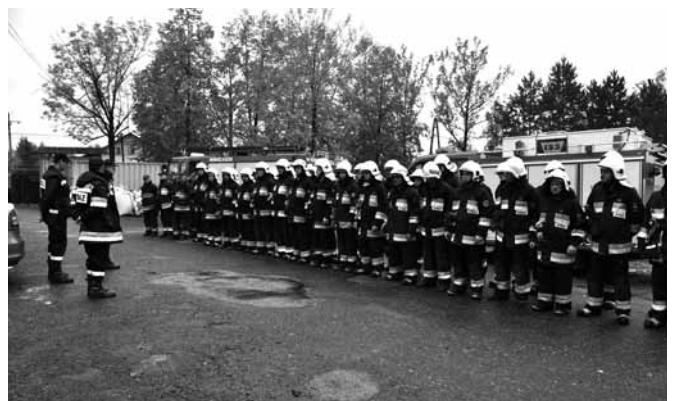
Odprawa po zakończonych ćwiczeniach

i likwidowania zagrożenia. Udzielono pierwszej pomocy osobie poszkodowanej (pozorant), wyniesiono również butlę grożącą wybuchem – skierowano na nią strumień wody. Po zakończeniu działań strażacy zgromadzili się na podsumowującej odprawie. Jak przyznał komendant, nie stwierdzono poważniejszych błędów, jednakże umiejętności należy „szlifować” systematycznie.