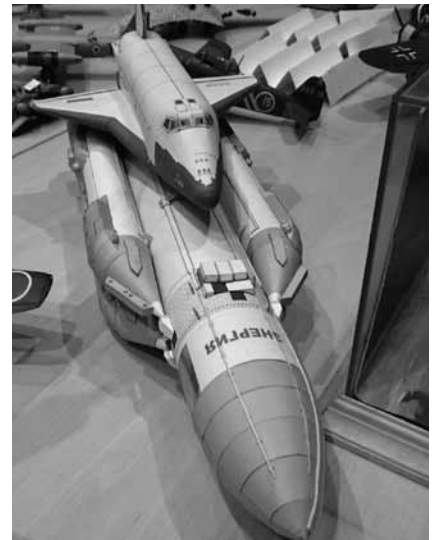
Model promu kosmicznego „Buran”