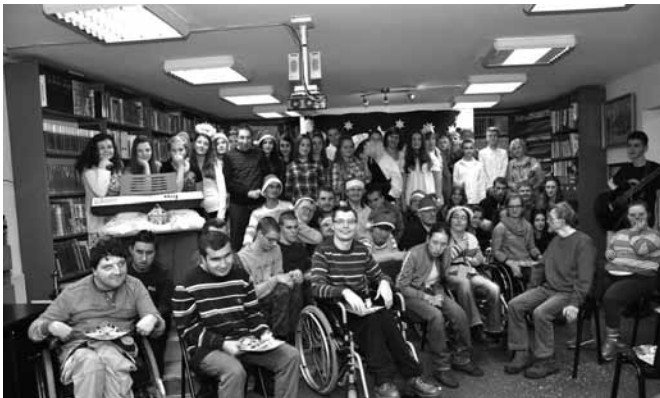
Uczniowie i osoby niepełnosprawne z „Centrum”

Już pierwszego grudnia do Bestwiny przybył Święty Mikołaj, przynosząc podopiecznym Środowiskowego Domu Samopomocy „Centrum” miłe prezenty, a przede wszystkim chwile pełne radości. Uczniowie Gimnazjum im. Jana Pawła II przygotowali