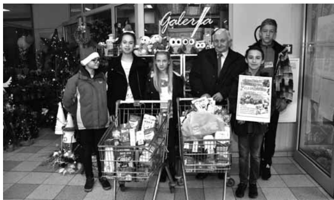
Wolontariusze biorący udział w akcji

Oraz przetwory, majonezy, konserwy, kawę, kakao, olej itp.