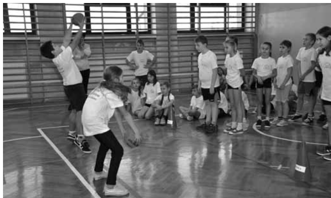
Konkurencja rzutu piłką

Klasyfikacja przedstawia się następująco: 1. Kaniów 2. Bestwinka 3. Bestwina 4. Janowice