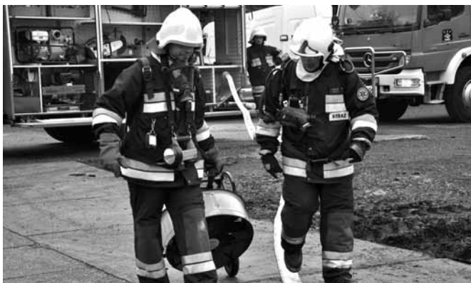
Strażacy w akcji

Zapisany w konspekcie cel ćwiczeń to „Doskonalenie w zakresie gaszenia budynków przemysłowych, ewakuacja ewentualnych osób poszkodowanych oraz dostarczanie wody na duże odległości”. Około godziny 11.00 jednostki z Bestwiny, Bestwinki, Janowic i Kaniowa otrzymały wezwanie do pożaru lakierni. Po przybyciu na miejsce odbyła się ewakuacja pracowników zaś druhowie przystąpili do przeszukiwania pomieszczeń