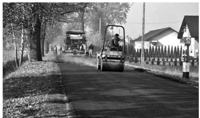
Przygotowywanie nowej nawierzchni