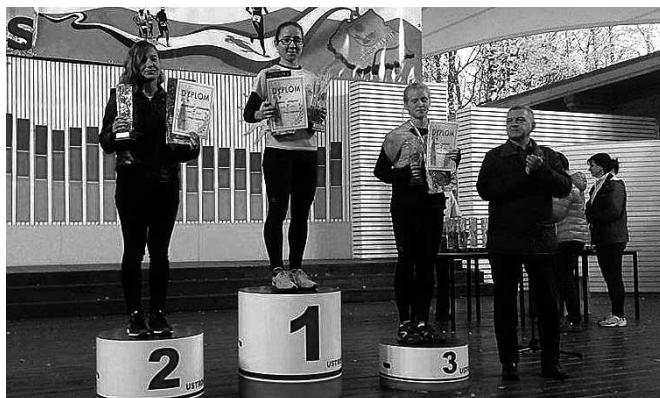
Na drugim stopniu podium stanęła biegaczka z Bestwiny