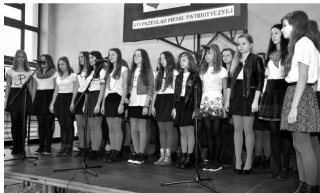
Zdobywcy Grand Prix - chór „Andante”