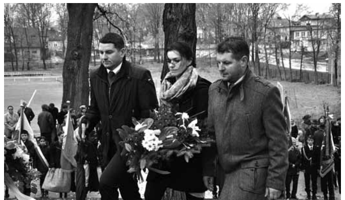
Złożenie kwiatów pod pomnikiem

Wyzwaniem XXI wieku, nie mniejszym niż geopolityczne zawirowania, okazuje się być relatywizowanie podstawowych wartości. Ks. Józef Walusiak głoszący homilię w kościele Wniebowzięcia NMP powiedział: Europa wstydzi się dziś własnej historii, korzeni. Pozwala zarazem by pustkę pozostawioną przez pozbycie się swojej tożsamości wypełniał nihilizm czy hedonizm. Korzystają na tym ekspansywni przybysze z innych stron świata. Wspólnie z janowickim proboszczem modlili się księża z wszystkich parafii gminy, zaś po Mszy św. zapalono znicz pod epitafium poświęconym żołnierzom poległym w latach 1914 – 1920.