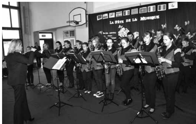
Młodzieżowa orkiestra „Con Fuoco Band”