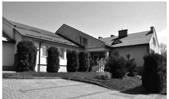
Siedziba bestwińskiej filii Ośrodka

Zadania statutowe „Centrum” są w głównej mierze realizowane poprzez aktywizację wszystkich uczestników zajęć. Osoby z różnym stopniem niepełnosprawności znajdują się pod opieką psychologa, technika fizjoterapii i terapeutów prowadzących poszczególne pracownie. Przy ul. Plebańskiej w Bestwinie mieści się pracownia witrażu, batiku i papieru, komputerowa i kulinarna. Podopieczni aktywnie współpracują z instytucjami z terenu gminy, szczególnie z Gminną Biblioteką Publiczną i Gimnazjum im. Jana Pawła II – można wymienić spotkania mikołajkowe, projekcje filmów, teatrzyki. Bestwińska filia „Centrum” została uruchomiona w październiku 2000 r. jako trzeci obiekt pobytu dziennego przewidziany dla 35 osób.