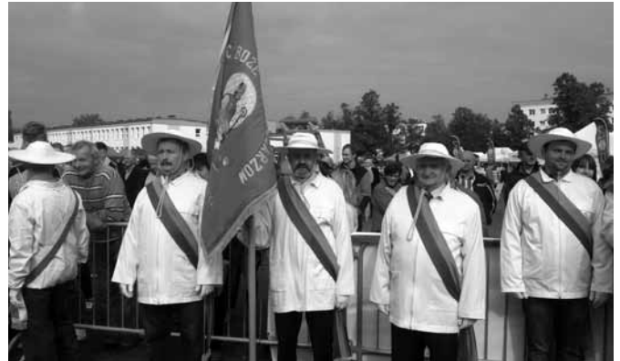
Na Dniach Pszczelarza w Wałczu

Centralne uroczystości rozpoczęły się przemarszem pocztów sztandarowych, orkiestry i wszystkich uczestników, spod ratusza