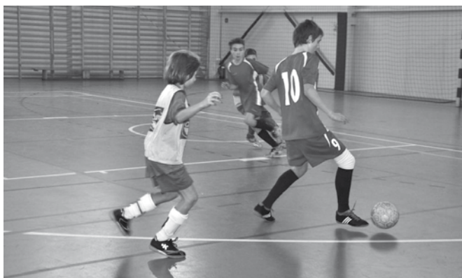
Rozgrywki w ramach memoriału