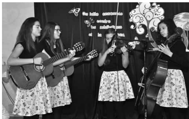
Występ Gimnazjum z Koszarawy

Przed liczną zgromadzoną publicznością wystąpili: Gimnazjum w Bestwince, Niepubliczne Gimnazjum Fundacji Świętej Jadwigi w Koszarawie, Agrupamento de Escolas de Eixo – Aveiro (Portugalia), IES Miguel Romero Esteo Malaga (Hiszpania),