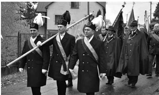
Pochód pod Urząd Gminy