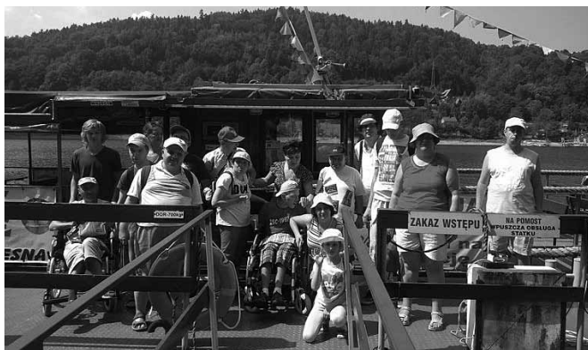
Rejs po jeziorze w Międzybrodziu.

W trakcie całej półkolonii wychowawcy animatorzy zorganizowali uczestnikom półkolonii wiele godzin ciekawych zajęć, prowadząc różnorodne zajęcia sportowe (zajęcia rozciągające i relaksujące, turnieje sprawnościowe, tory przeszkód),