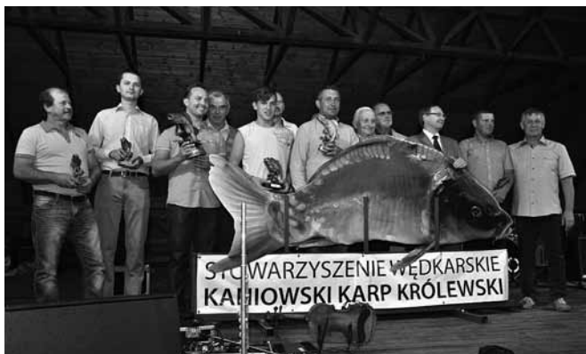
Pamiątkowa fotografia po rozdaniu statuetek