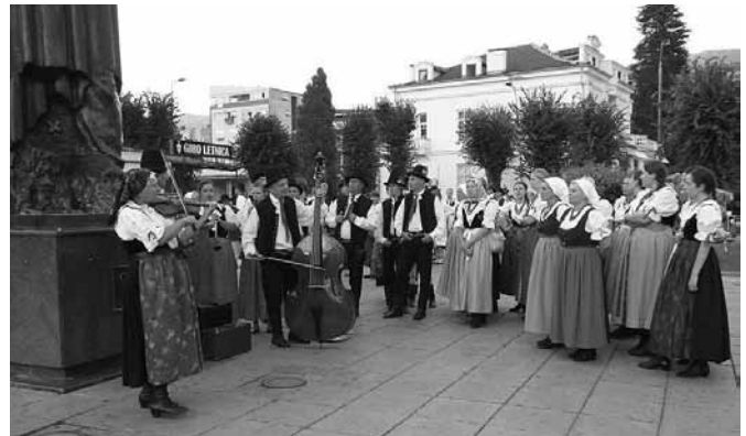
Zespół koncertował również na ulicach.

Wyprawa na Bałkany oznaczała dla członków zespołu także wypoczynek połączony ze zwiedzaniem. Zobaczyli m.in. Albanie (Tirana, Durres), Medziugorie w Bośni i Hercegowinie i Dubrow-