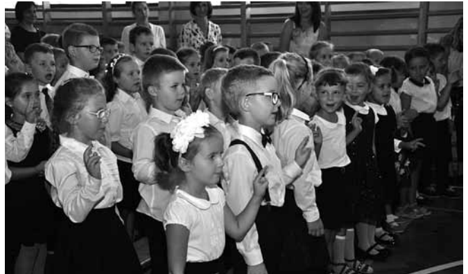
Ślubowanie pierwszaków z Bestwiny.

- W Janowicach planujemy przebudowanie klatki schodowej – jest to związane z wytycznymi przeciwpożarowymi wskazanymi po wizytacji strażaków. Wykonano przed rokiem szkolnym montaż pompy stymulującej obieg ciepłej wody w przedszkolu,