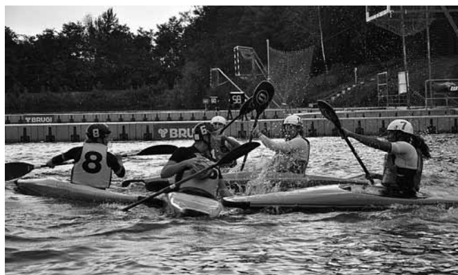
Francusko - niemiecki finał kobiet