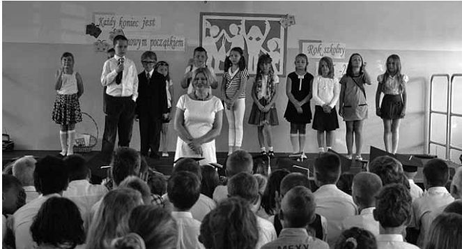
Rozpoczęcie roku w Janowicach.

- Głównym „frontem remontowym” był Zespół Szkolno – Przedszkolny w Kaniowie – nie ma tu mowy o tzw. kosmetyce, ale trzeba wyraźnie napisać o prawdziwym remoncie, likwidacji szkód górniczych przez PG SILESIA. Wymalowane zostały sale lekcyjne, korytarze, szatnie, wymieniono podłogę w sali gimnastycznej. Firma wykonująca zlecenie zrobiła to na szczęście w terminie. Całość wygląda bardzo estetycznie. Mamy świadomość, że szkody mogą jeszcze wystąpić, ale w miarę potrzeb