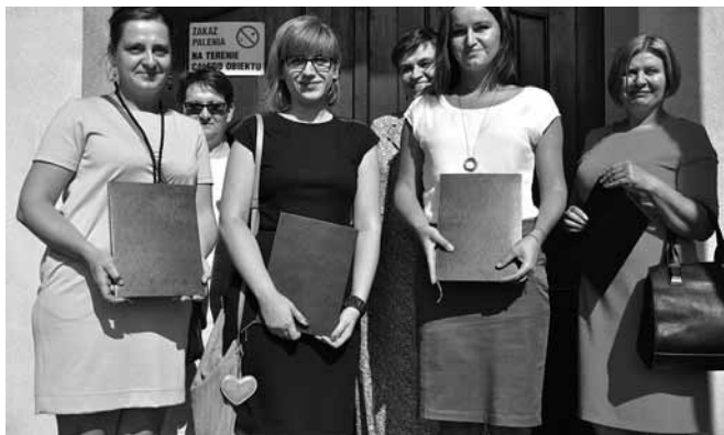
Nauczyciele którzy uzyskali kolejny stopień awansu

7. Powołania zespołu opiniującego zgłoszonych kandydatów na ławników do Sądu Okręgowego w Katowicach i Sądu Rejonowego w Pszczynie na okres kadencji 2016 – 2019.