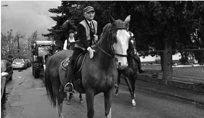
Atrakcją pochodu były konie z okolicznych stadnin.

Ulicami sołectwa przejechał korowód maszyn rolniczych – traktorów, kombajnów i innych pojazdów, niekiedy zabytkowych lub specjalnie na tę okazję skonstruowanych – przykładem może być platforma Stowarzyszenia Wędkarskiego „Kaniowski Karp Królewski”. Na przyczepach zasiedli mieszkańcy Bestwiny, Bestwinki, Janowic i Kaniowa. Śpiewali, grali, prezentowali barwne stroje i pomysłowe dekoracje. Dzieciom najbardziej podobał się jeźdźcy konni w przebraniach z różnych epok.