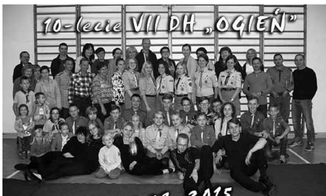
Harcerze i ich przyjaciele.