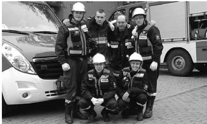
Zwycięska reprezentacja z Bestwiny i Kaniowa.

Przykładowe zadania, z jakimi należało się zmierzyć to wybuch beczki z nieznaną substancją na skraju lasu (udzielenie pomocy ofiarom); odwodnienie linii gaśniczej, ponowne rozwinięcie i napełnienie wodą; ratowanie woźnego, który spadł z w szkole z drabiny; ratowanie drwała przygniecionego przez drzewo i wsparcie psychologiczne udzielone świadkowi; pomoc zakrzutu-