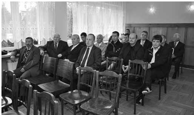
Mieszkańcy sołectwa Bestwina.

Wyczyszczony został rów i przepust pod ul. św. Floriana jak również przepust na ul. Olchowej i rów do firmy „Nicromet”;