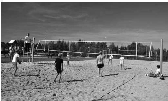
Rozgrywki w najmłodszej kategorii.