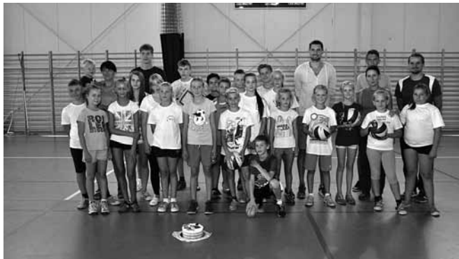
Pamiątkowe zdjęcie z siatkarzami BBTs Bielsko-Biała