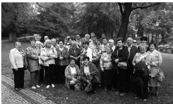
Strażacy i gospodynie z Janowic na wspólnym wyjeździe.

19 września członkinie KGW i druhowie OSP z Janowic wyjechali na wspólną wycieczkę do Cieszyna i Wisły. Była to miło i ciekawie spędzona sobota. W Cieszynie zwiedziliśmy Wzgórze Zamkowe, byliśmy pod Rotundą, Wieżą Piastowską, Pałacem Myśliwskim, przy Studni Trzech Braci oraz w kościele św. Marii Magdaleny. Uliczkami „Wenecji Cieszyńskiej” przeszliśmy na Most Przyjaźni, którym dotarliśmy do Czeskiego Cieszyna.