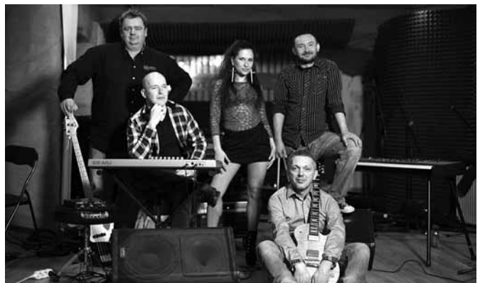
Zespół „Hydra” - warto ich posłuchać.

wyniesione ze szkoły aktorskiej w Katowicach i występów na różnorodnych konkursach, przeglądach, śpiewu w chórze. Nie jest „człowiekiem znikąd”.