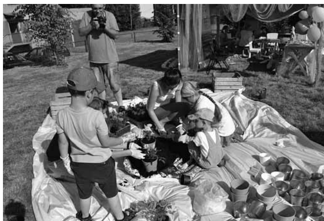
Zajęcia ogrodnicze na Święcie Gminy Bestwina

Przestrzeń sportu – podczas wydarzenia zaangażowano gry i zabawy sportowe, które miały na celu popularyzację zdrowego stylu życia, aktywności oraz ogólnego rozwoju. Największym powodzeniem cieszyło się łowienie rybek. Przestrzeń sportu przygotowało Stowarzyszenie Pomocy Dzieciom, Młodzieży i Rodzinom „Z sercem na dłoni”.