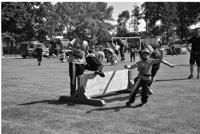
Rywalizacja Młodzieżowych Drużyn Pożarniczych

Regulamin zawodów jest bardzo skomplikowany i zajmuje aż 25 stron. Trening wymaga skoordynowania wielu elementów.