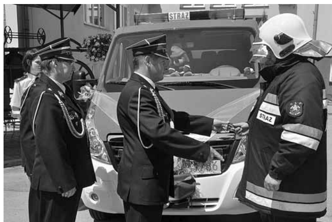
Wręczenie kluczyków do wozu bojowego