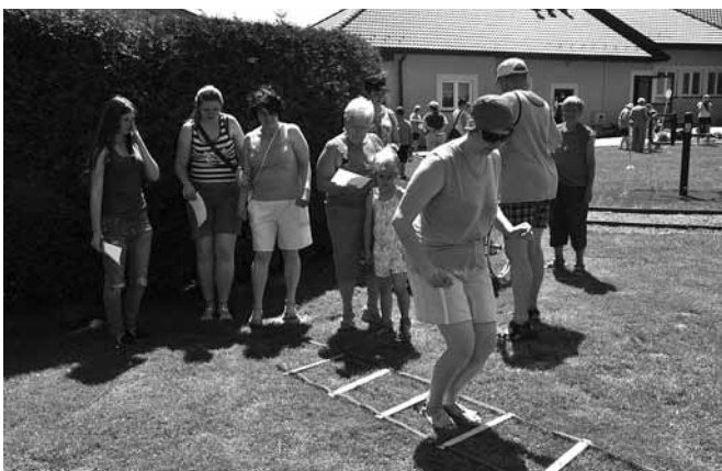
Konkurencje sportowe na terenie ośrodka mieszkalno - rehabilitacyjnego