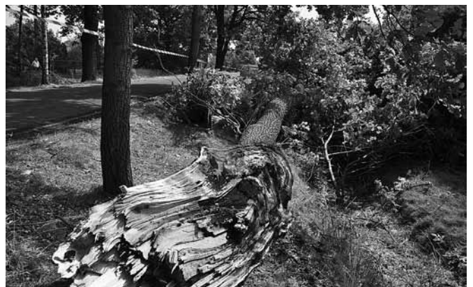
ul. Dankowicka w Kaniowie