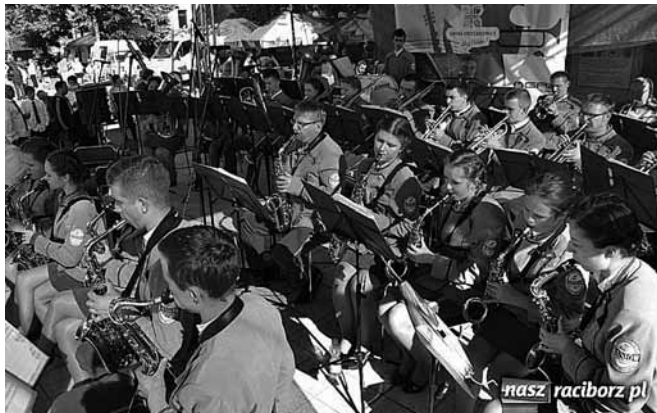
Orkiestra na festiwalu w Tworkowie

Wakacje już za pasem, lecz Orkiestra Dęta Gminy Bestwina z siedzibą w Kaniowie ciężko pracuje. Maj i czerwiec były szczególnie intensywne dla naszych muzyków. Zaczęli od zapewnienia oprawy świąt majowych i uroczystości strażackich. 17 maja wzięli udział w Przeglądzie Orkiestr Dętych w Dąbrowie Górniczej, później w jubileuszu samorządności gminnej, natomiast