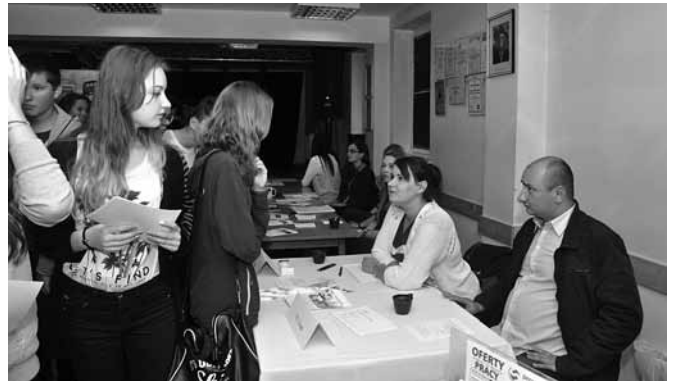
Młodzież zapoznawała się z ofertami pracodawców