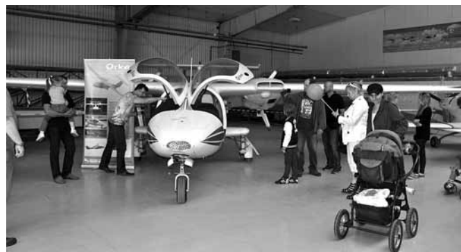
Samolot „Orka” cieszył się dużą popularnością