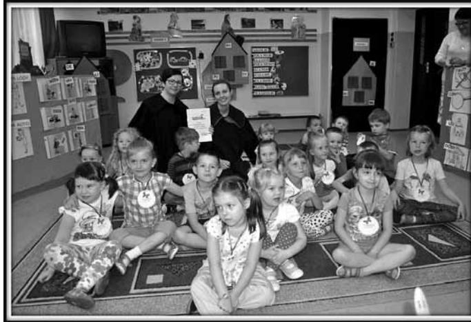
Przedшкоlaki aktywnie brały udział w zajęciach

W grupie średniaków już drugi rok prowadzona jest innowacja pedagogiczna: „Nauka czytania małych dzieci – metodą sylabową”. Dzieci w trakcie zabawy poznają różne sylaby, łączą je w wyrazy lub w proste zdania. Nauka czytania prowadzona jest trzy razy w tygodniu w formie różnych zabaw. Dzieci bawiąc się, jednocześnie uczą się czytać. Metoda symultaniczno – sekwencyjna rozwija pamięć słuchową, analizę i syntezę wzrokową oraz koordynację wzrokowo-ruchową. Ważną rolę odgrywają tutaj ćwiczenia ogólnorozwojowe, które urozmaicają pracę i wspomagają naukę czytania.