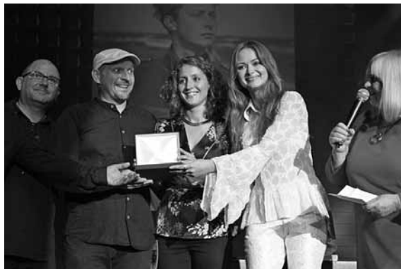
Zespół „Dzień Dobry” odbiera nagrodę

W dniu 7 sierpnia „Dzień Dobry” wzięło udział w Koncercie Laureatów Grechuta Festival „Jeszcze pożyje-