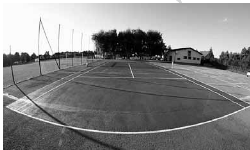
Kort tenisowy w Bestwinie

– Klub Sportowy Bestwinka zaprasza wszystkich do spróbowania swoich sił w tenisie na odnowionym pełnowymiarowym korcie asfaltowym, który pokryty został dwiema warstwami specjalistycznej nawierzchni. Wytyczone zostały nowe, regulaminowe linie, zakupiona została również nowa siatka, co w rezultacie dało znakomicie sprawdzający się efekt. W klubowym lokalu istnieje również możliwość wynajęcia rakiet oraz piłek. Każdy mieszkaniec może więc zacząć swoją przygodę z „białym sportem”.