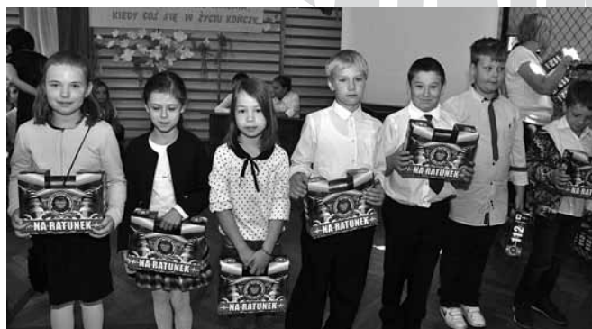
Uczniowie otrzymali zestawy pierwszej pomocy