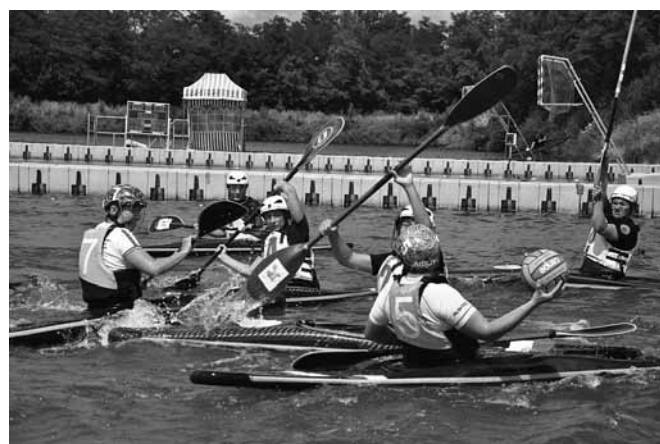
W mistrzostwach rywalizowały drużyny z całego kraju