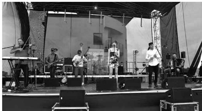
Koncert zespołu „Brathanki”

Program podzielono na część koncertową (sobota) i pokazową (niedziela). W pierwszej wystąpiło wiele znanych i lubianych zespołów z popularną grupą „Brathanki” na czele. Goście usłyszeli i zobaczyli także „Audio Cases”, DJ Kamila, Inez Bodjo, różnorakie grupy z MDK w Czechowicach – Diedzicach, CKSiR w Bestwinie i ZSP Janowice. Do imprezy włączono „Powitanie Lata” organizowane przez MOSiR Czechowice – Diedzice. W niedzielę rozpoczęto od pokazu pierwszej pomocy, na-