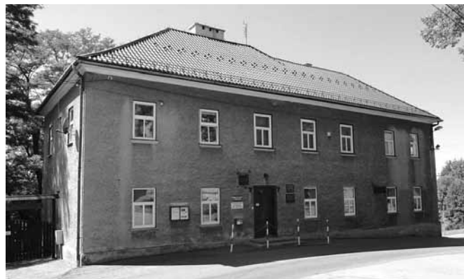
Muzeum Regionalne im. ks. Z. Bubaka w Bestwinie

pieczęciami oraz uczestnicy gry wiejskiej organizowanej przez Gminną Bibliotekę Publiczną. Dla wielu osób czas urlopowy to doskonała okazja do odkrywania korzeni rodzinnych. Zainteresowani mogli korzystać z udostępnionych przez muzeum zasobów. Warto podkreślić, iż wśród nich znalazły się osoby pochodzące nawet z odległych Stanów Zjednoczonych. Okres wakacyjny obfitował również w prace nad nowymi materiałami promocyjnymi, które już we wrześniu będą rozslawiać naszych rodzinnych artystów malarstwa, folkloru czy też najważniejsze zabytki.