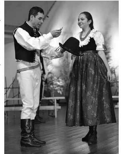
Zespół „Bestwina” na Tygodniu Kultury Beskidzkiej