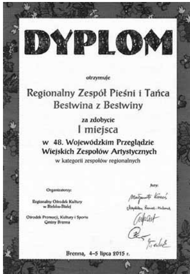
Dyplom z przeglądu w Brennej

na portalu społecznościowym. Napisała między innymi: „Zostaliśmy przywitani przez kapelę Polonii z Kanady, która była ubrana w stroje lachowskie. Na festiwal przybyły zespoły z każdego kontynentu. Goszczą u nas nawet Maorysi z Nowej Zelandii, którzy poruszyli nas swoim wigorem, tajemniczością, dodali ducha pokoju i radości. Spotkały się razem różne kultury, różne nacje i języki. Patrząc na to, miało się wrażenie, że w jednej chwili zobaczyłam prawie