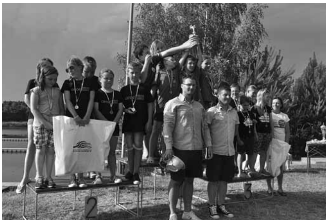
Triumf najmłodszych kajakolistów