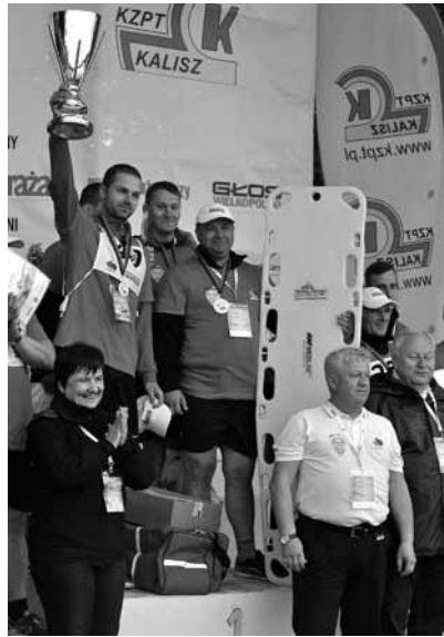
Nasi druhowie w chwili triumfu

W relacjach z walnego zebrania OSP Kaniów i Gminnego Dnia Strażaka wyraziliśmy nadzieję, że łódź dofinansowana przez Wojewódzki Fundusz Ochrony Środowiska i Gospodarki Wodnej w Katowicach sprawdzi się na zawodach, ale