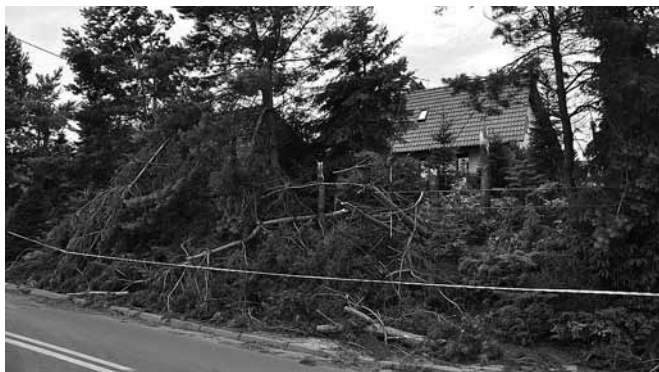
Bestwina - szkody na ul. Witosa

W związku z powstałymi zdarzeniami Bestwinę odwiedził