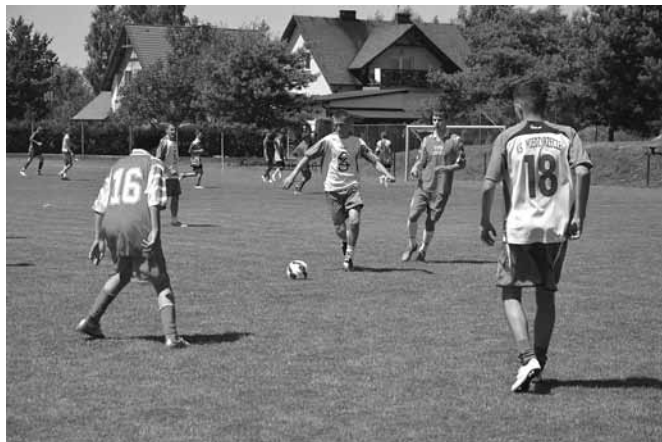
Turniej Młodzieżowych Drużyn Pożarniczych