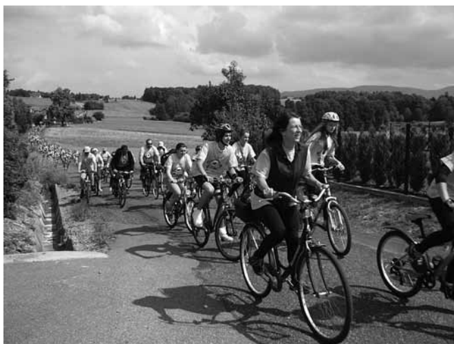
Na trasie Janowickiego Rajdu Rowerowego

Wszyscy Janowice z rajdów rowerowych doskonale znają i kochają, bo janowickie lasy i łąki na rowery wspaniale się nadają. Gdy tylko czerwiec się rozpoczyna, każdy rower szykować zaczyna. (Kamila Klasa, kl. 1 ZSP Janowice)