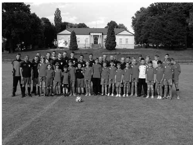
Młodzicy LKS Bestwina i ich rodzice

– 28 czerwca br. na bestwińskim stadionie spotkały się drużyny Młodzików LKS Bestwina z Rodzicami. Zespół młodzików dzielnie dotrzymywał kroku drużynie złożonej zarówno z rodziców, jak i zawodników oraz przyjaciół, nieznacznie im ulegając. Oba zespoły stworzyły niezapomniane widowisko, a co warto zaznaczyć, gra cały czas toczyła się w duchu fair play. Wynik nie był tak ważny jak dobra zabawa. Zaangażowały się również mamy zawodników przygotowując ciasta, kawę i racząc nimi przybyłych. Po spotkaniu odbyło się uroczyste podsumowanie sezonu połączone z wręczeniem nagród i pamiątkowych dyplomów drużynie młodzików. Rodzice dzielnie wspierali poczynania swoich pociech, natomiast, słowa uznania należą się również o trenerowi, kierownikowi, masażystę, zarządowi klubu, którzy dbali o wyszkolenie i uczestnictwo w rozgrywkach.