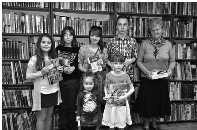
Najlepsi czytelnicy Gminnej Biblioteki Publicznej w Bestwinie