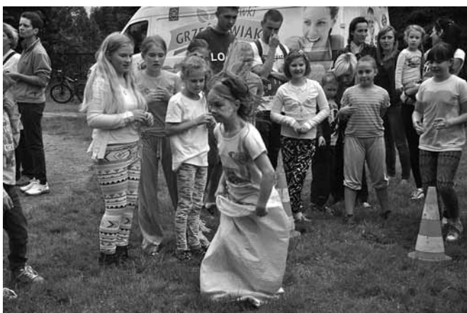
Jedna z konkurencji - bieg w workach

Z pewnością mile zaskoczyła obecność grupy „Zapaleńcy” z Czechowic – Dziedzic specjalizującej się w atrakcjach z zakresu sztuki cyrkowej. W końcu okazja do pochodzenia po linie, puszczenia olbrzymich baniek mydlanych czy chodzenia z powerizerem nie zdarza się na co dzień! Instruktor z „Za-