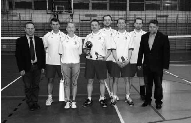
Siatkarze z pucharem za drugie miejsce

Siatkarski team samorządu gminy Bestwina utrzymał wysoki poziom gry i podobnie jak w ubiegłym roku stanął na podium zawodów odbywających się w hali sportowej w Wilkowicach. VI Powiatowy Turniej Piłki Siatkowej Radnych i Pracowników Samorządowych miał miejsce w dniu 17 kwietnia, a głównym trofeum był Puchar Starosty Bielskiego.