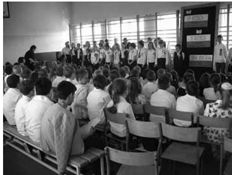
Janowiccy uczniowie wspólnie uczyli się historii

Uczniowie klas 4–6 przy akompaniamencie szóstoklasistek (na fletach) odśpiewali pieśń „Witaj majowa jutrzeńko”. Kolejnym elementem była recytacja wierszy