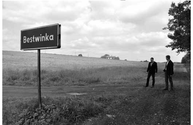
Remont nawierzchni ul. Starowiejskiej

– Ul. Podlesie w Janowicach – wykonany został przepust pod drogą, na jednej części drogi jest nawierzchnia bitumiczna a na drugiej wyremontowana nawierzchnia gruntowa. W sołectwie Janowice odwodniono ponadto całą ul. Miodową. Przeprowadzono tam konserwację rowów i przepustów.