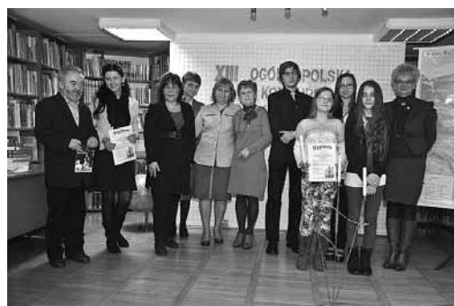
Finałiści i jurorzy konkursu