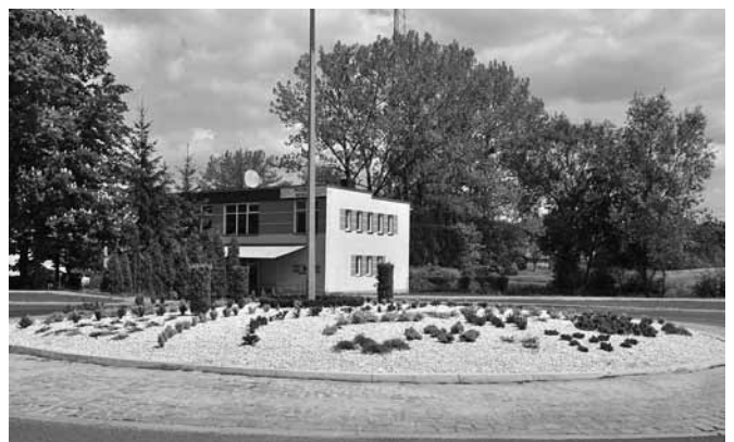
Rondo w Bestwinie po pracach wykończeniowych

Działania gminy w zakresie poprawy dróg gruntowych zmierzają do tego, by nie były to tylko naprawy doraźne. Podobnie z nawierzchniami asfaltowymi. Tak więc od czerwca rusza remont ul. Pisarzowickiej w Janowicach . Nie zapominamy również o budynkach użyteczności publicznej. Od dawna zapowiadaną inwestycją jest termomodernizacja Zespołu Szkolno – Przedszkolnego w Bestwinie , o czym jeszcze będziemy informować. Jesteśmy rzecz jasna bardzo otwarci na wszystkie wnioski i zapytania kierowane do Urzędu Gminy.