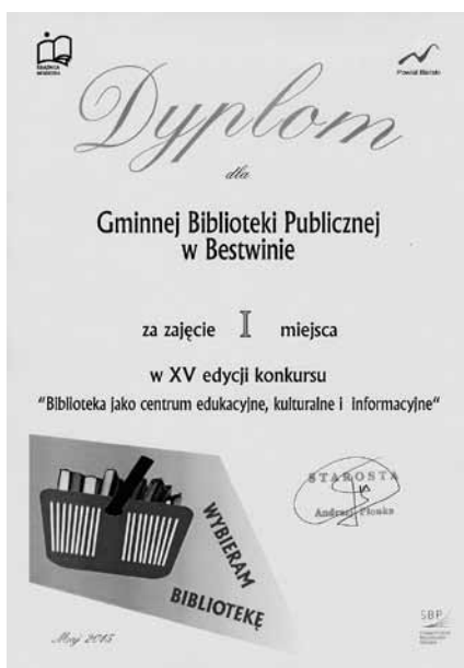
Dyplom dla GBP Bestwina