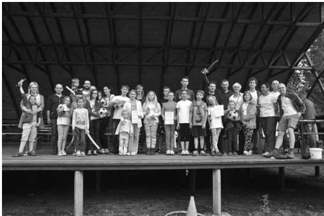
Uczestnicy Rodzinnego Dnia Radości

Tytułowe endorfiny są hormonami, które wywołują dobre samopoczucie i zadowolenie. Bodźce mogące uwolnić ich wydzielanie to na przykład śmiech i wysiłek fizyczny. Co roku Stowarzyszenie na Rzecz Pomocy Dzieciom, Młodzieży i Rodzinom „Z Sercem na Dłoni” regularnie dostarcza dzieciakom i ich najbliższymi sporą dawkę hormonów szczęścia organizując na terenach rekreacyjnych w Kaniowie „Dzień Radości”. W przygotowanie gier i zabaw włącza się również świetlica środowiskowa „Słoneczko”.