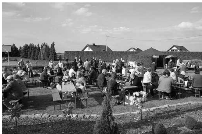
Goście stowarzyszenia „Razem”