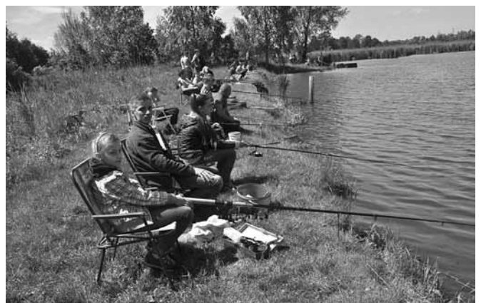
Cierpliwość została nagrodzona!