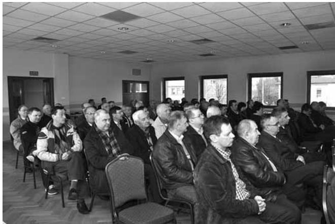
Mieszkańcy Kaniowa obecni na zebraniu