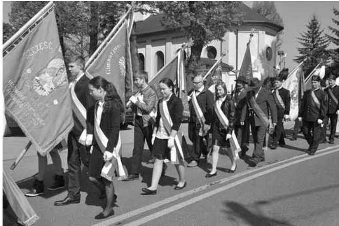
Początek sztafety sztandarowej szkół i organizacji z terenu gminy

w sobie patriotyzm, zaszczyścić go w młodym pokoleniu i nie przyjmować bezkrytycznie wszystkich prądów umysłowych, czasem może modnych, ale czy rzeczywiście prawdziwych, dobrych i wartościowych?