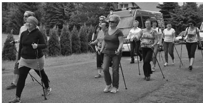
Rajd Nordic Walking ulicami Bestwinki

Bogato wyposażone stoiska zapewniały zimne i gorące posiłki, ciasta pieczone przez rodziców, napoje i słodczy. Bawiono się na eurobungee i dmuchanych zamkach, z których dzieci korzystały bezpłatnie co ufundowała Rada Rodziców dla wszystkich dzieci z okazji ich święta. Zaś w loterii fantowej można było