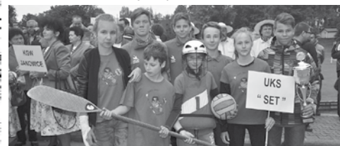
Reprezentanci UKS „Set” na 25-lecie samorządu gminnego