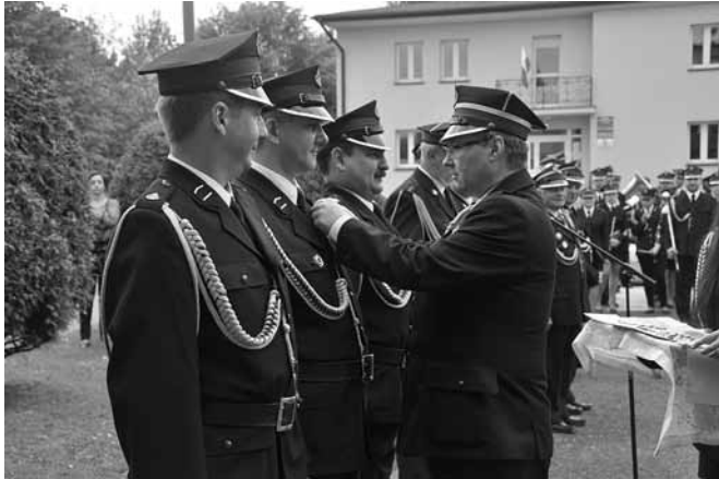
Przyznanie odznaczeń pożarniczych