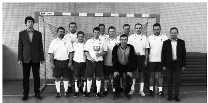
Samorządowcy z Bestwiny z „brązem” na hali