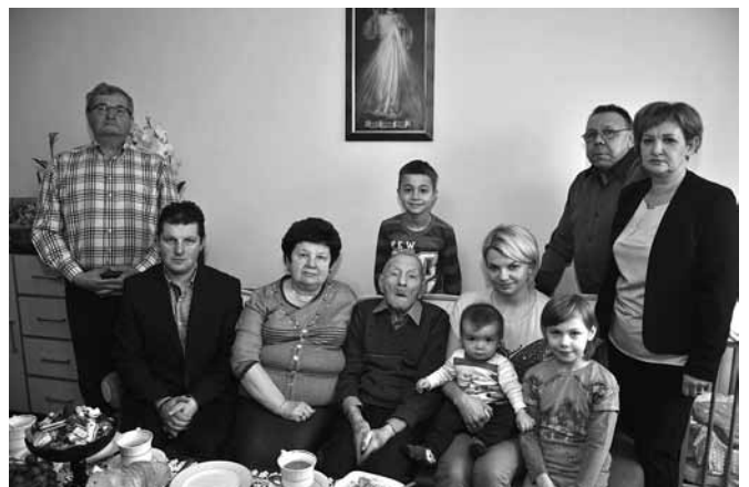
Pamiątkowa fotografia z jubilatą i jego rodziną