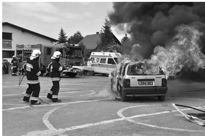
Pokaz strażacki OSP Bestwinka i OSP Janowice

Lista wszystkich sponsorów i rodziców do których skierowane są podziękowania znajduje na stronie internetowej Zespołu Szkolno – Przedszkolnego a także na stronie internetowej Urzędu Gminy – www.bestwina.pl