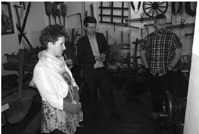
Zwiedzanie izby narzędzi rolniczych