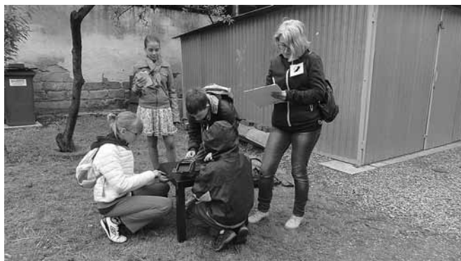
Jedna z konkurencji na trasie gry