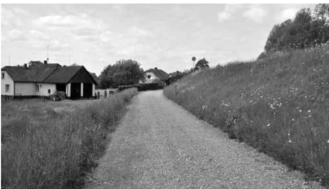
Gruntowy odcinek ul. Rybackiej

Przedstawię najważniejsze wiosenne inwestycje w każdym z naszych sołectw: