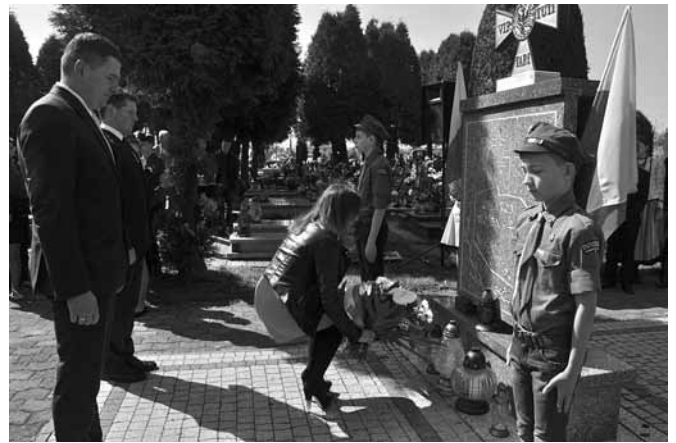
Złożenie kwiatów pod pomnikiem „Ofiarom wojen i nienawiści”