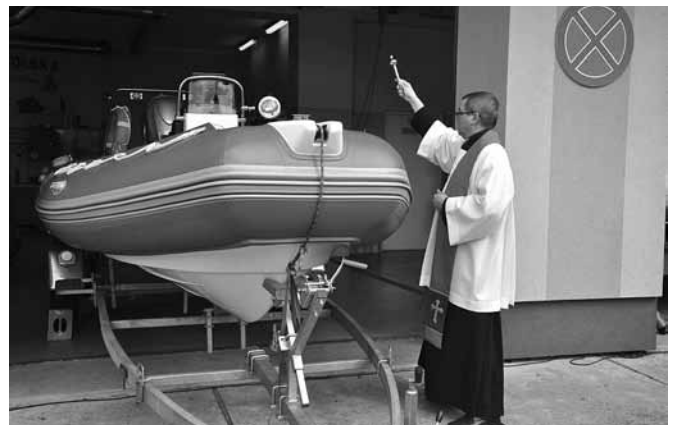
Poświęcenie zestawu pływającego