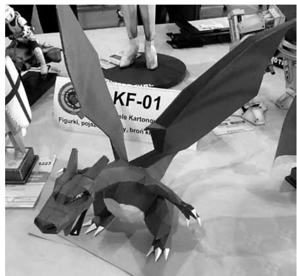
Smok - jeden z nagrodzonych modeli

Łukasz Fuczek – instruktor modelarstwa w CKSiR