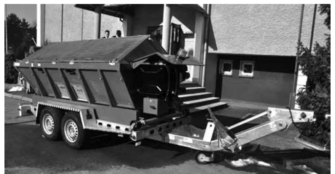
Bestwina - przyczepa z pakowarką piasku

W dniu walnego zebrania OSP Bestwina liczyła 86 członków zwyczajnych, 10 honorowych i 35 wspierających. W akcjach ratowniczo – gaśniczych brało udział 34 druhów i druhen – łącznie przepracowali przy akcjach 770 godzin. Do tego należy dodać kursy i szkolenia: I stopnia, KPP, naczelników, kierowców – konserwatorów, opiekunów kolonii. Drużyny MDP i OSP uczestniczyły w różnego rodzaju zawodach, często zajmując bardzo wysokie lokaty: 1 miejsce w V Manewrach Maltańsko - Strażackich, 2 miejsce w I Otwartych Mistrzostwach Śląska w KPP Strażaków Ochotników, 9 miejsce w X Zimowych Międzynarodowych Mistrzostwach w Ratownictwie Medycznym. Jak już wielokrotnie