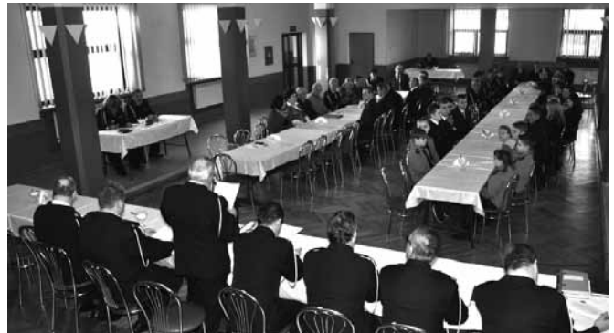
Bestwinka - strażacy i zaproszeni goście

OSP Bestwinka brała udział w 20 akcjach ratowniczo – gaśniczych, przy czym największą z nich był szereg wyjazdów podczas powodzi, jaka nawiedziła gminę w miesiącach letnich. Poza tym druhowie włączali się w różnego typu ćwiczenia i inicjatywy o charakterze edukacyjnym – prewencyjnym oraz sportowym. Można wymienić udział w uroczystościach, akademiach, turniejach wiedzy pożarniczej, wycieczki, kuligi, mikołajki, turnieje gier zespołowych,