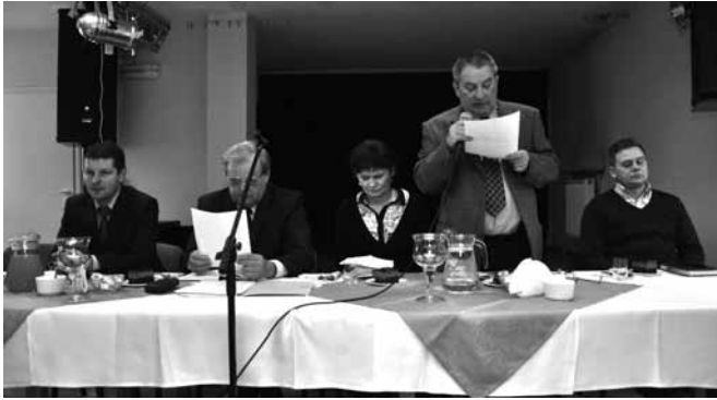
Zebranie Spółki Wodnej - stół prezydyalny

w protokole z zebrania dostępnym w siedzibie GSWM.