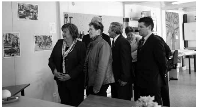
Anna Komorowska zwiedza ośrodek mieszkalno-rehabilitacyjny

Małżonka Bronisława Komorowskiego wyznała na spotkaniu z członkami stowarzyszenia i mieszkańcami domu, że swojego patronatu udziela tylko wybranym inicjatywom. Widząc piękny, dobrze zaopatrzony budynek wyraziła radość, że niemal kar-