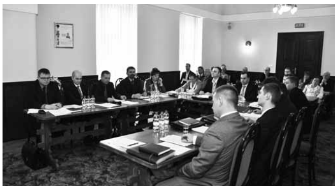
Na sesji przedstawiono plany pracy komisji stałych Rady Gminy