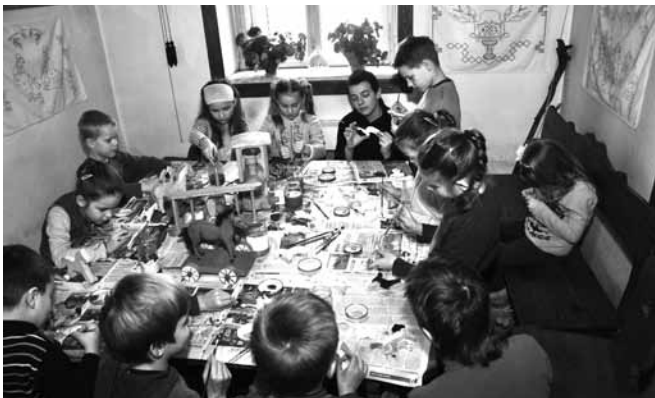
Tworzenie drewnianych zabawek

Bez komputerów, tabletów i telefonów, za to z pędzelkiem lub wiejczką do zboża w dłoni – tak właśnie wyglądają zajęcia podczas ferii zimowych w Muzeum Regionalnym im. ks. Zygmunta