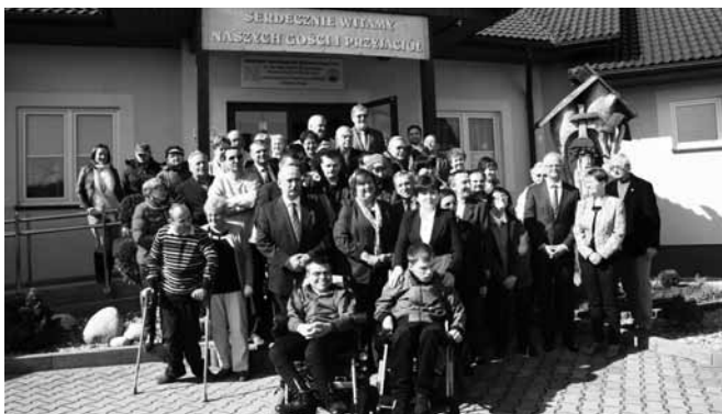
Pamiątkowe zdjęcie z Pierwszą Damą