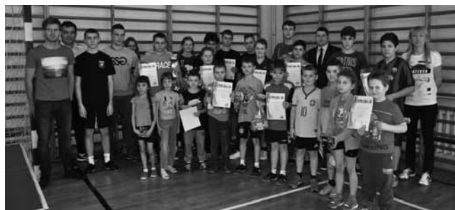
Pingpongiści i organizatorzy turnieju