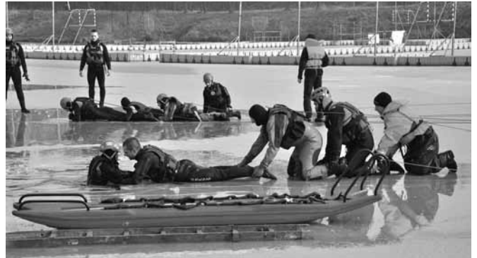
Ćwiczenia w ratownictwie lodowym

Uczestnicy podczas ćwiczeń wykorzystywali sanie lodowe,