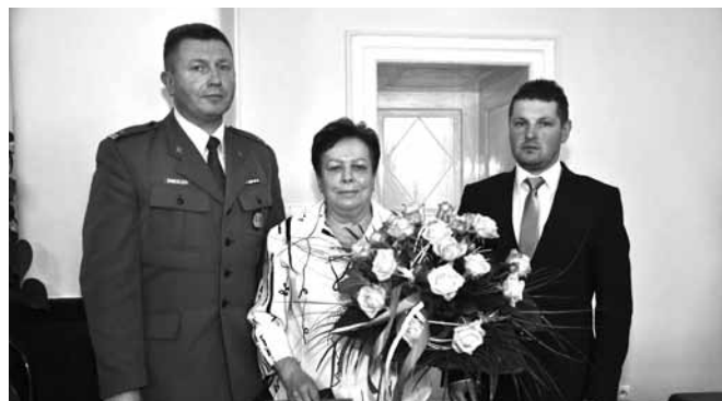
Wręczenie medalu „Za Zasługi dla Obronności Kraju”