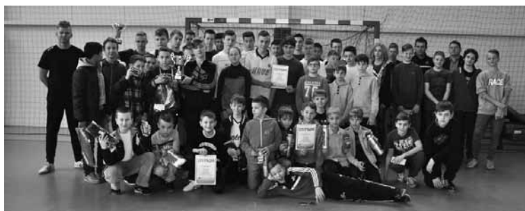
Ekipy rywalizujące o puchar