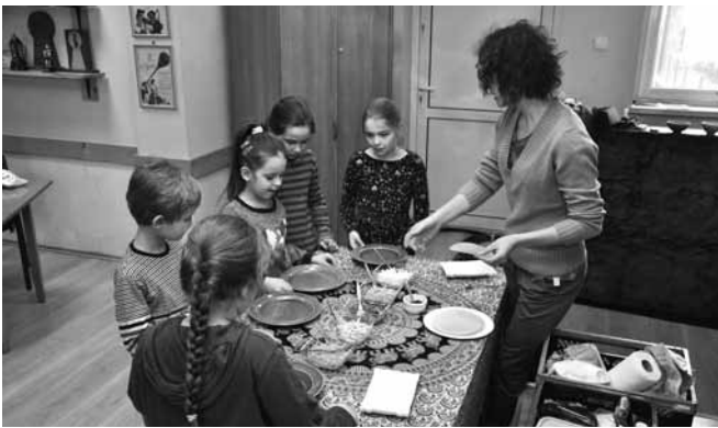
Warsztaty etnograficzne - przygotowywanie sajonek

Podróże do krajów Azji stały się motywem przewodnim zimowych warsztatów etnograficznych w Centrum Kultury, Sportu i Rekreacji. Wspólnie ze sprawdzoną już ekipą spod znaku „Opo-