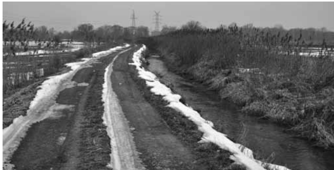
Kanał „Bartki” - planowany nowy kanał ulgi

Skierowanie wody do kanału „Bartki” położonego w okolicach