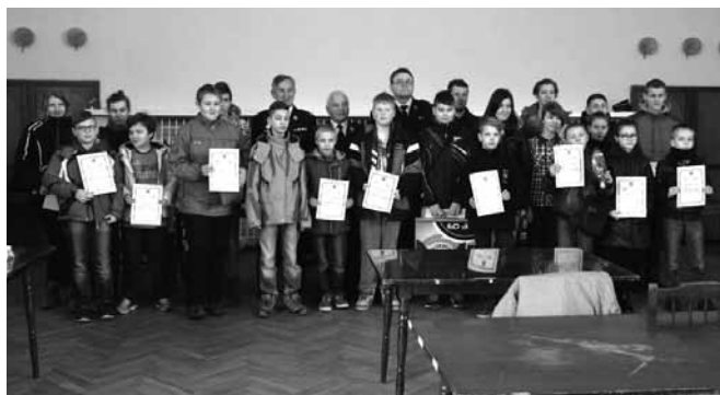
Pamiątkowe zdjęcie uczestników turnieju

prezesi jednostek oraz opiekunowie MDP bardzo zadowoleni z przygotowania uczestników – a trzeba dodać, że w etapie gminnym wzięły udział te osoby które z powodzeniem przeszły eliminacje szkolne.