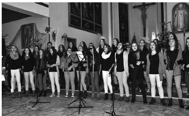
Połączone chóry „Andante” i „Allegro”