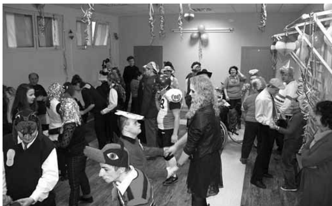
Bal karnawałowy w siedzibie Stowarzyszenia „Razem”

Stowarzyszenie RAZEM dziękuje wszystkim, którzy przyczynili się do zorganizowania tak wspaniałego spotkania. Więcej o stowarzyszeniu można przeczytać na stronie www.stowarzyszenierazem.org .