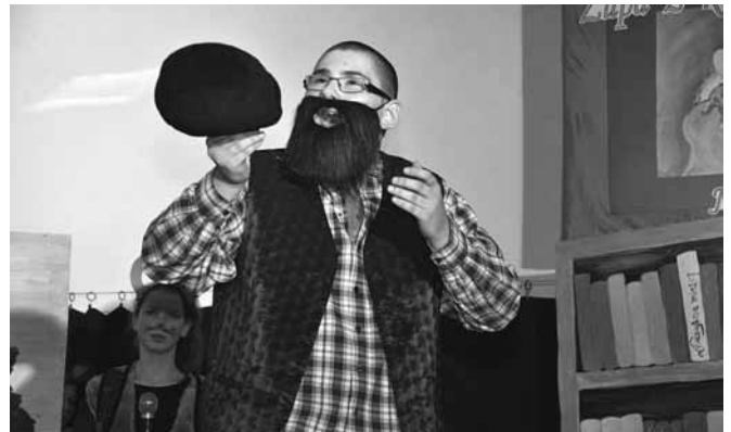
Aria „Skrzypka na dachu”

fantazji, odwagi i mądrości. Czasami zwykły kołek od kielbasy może okazać się masztem kwiatowym, a ogon Mysiego Króla fantastyczną przyprawą do zupy. A Król nie musi mieć racji tylko dlatego, że jest królem!