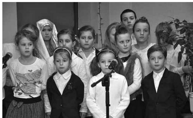
Śpiewają uczniowie z ZSP Kaniów