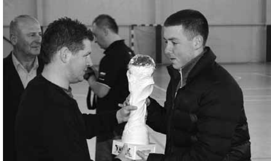
Kapitan zwycięskiej drużyny odbiera puchar z rąk wójta

Dla uczczenia srebrnego jubileuszu w hali sportowej w Kaniowie odbył się turniej piłki nożnej, w którym uczestniczyło osiem zespołów.