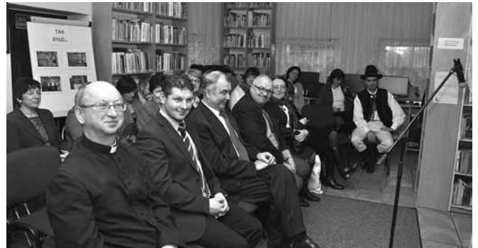
Samorządowcy i inni goście obecni na otwarciu

Tak radykalna odmiana umożliwi większy komfort korzystania z ksiąźnicy, mowa tu także o przeprowadzaniu ciekawych spotkań czy warsztatów z udziałem np. przedszkolaków, uczniów albo Koła Gospodyń Wiejskich. W ostatnich dniach odbywały się