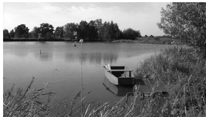
Stawy hodowlane - typowy widok w gminie Bestwina