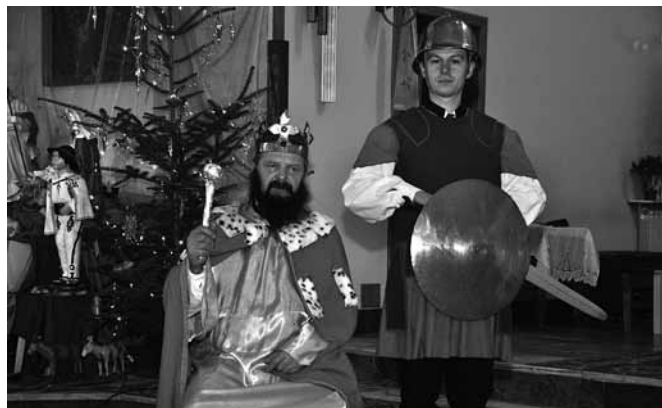
Król Herod i jego sługa Serfin - występ Zespołu Regionalnego