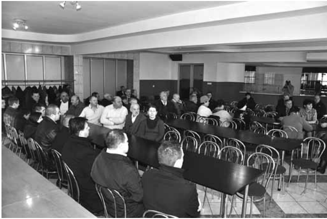
Mieszkańcy sołectwa Janowice