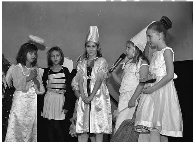
Postacie z różnych bajek

Zamysłem twórców jasełek stało się zrealizowanie ich w koncepcji nieco innej niż ta tradycyjna. W scenariusz wpleciono motywy z popularnych baśni Andersena, braci Grimm, Carlo Colodiego, Charlesa Perraulta i innych twórców. Dary Dzieciątka złożyli zatem Czerwony Kapturek, Kopciuszek, Pinokio, Dziewczynka z zapalkami oraz wiele postaci znanych z lektur naszego dzieciństwa. Pojawiły się jednak również nasze swojskie ak-