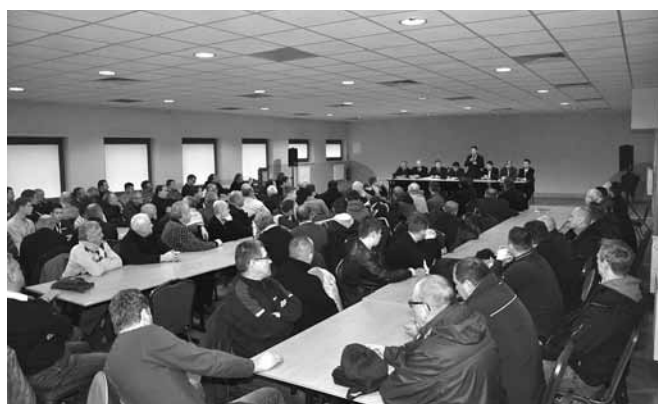
Wędkarze powołują nowe stowarzyszenie