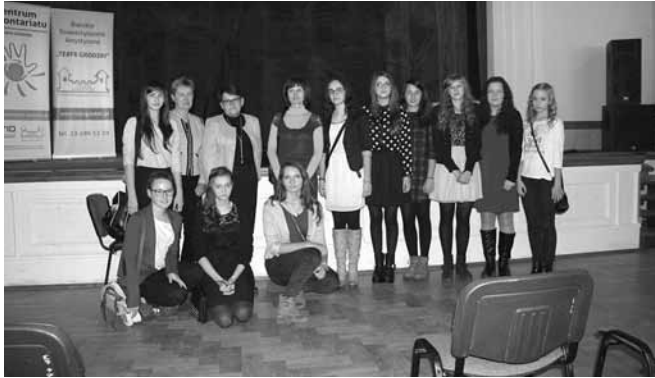
Uczniowie z ZSP Bestwina wraz z nauczycielami

W dniu 5 grudnia odbyła się 4 Gala Wolontariatu w Bielsku-Białej. Jej organizatorem było Bielskie Stowarzyszenie Artystyczne „Teatr Grodzki”. Impreza podzielona była na dwie części: obchody 15 - lecia BSA Teatru Grodzkiego i 10 - lecia Warsztatu Terapii Zajęciowej „Jesteś potrzebny”. Były podziękowania