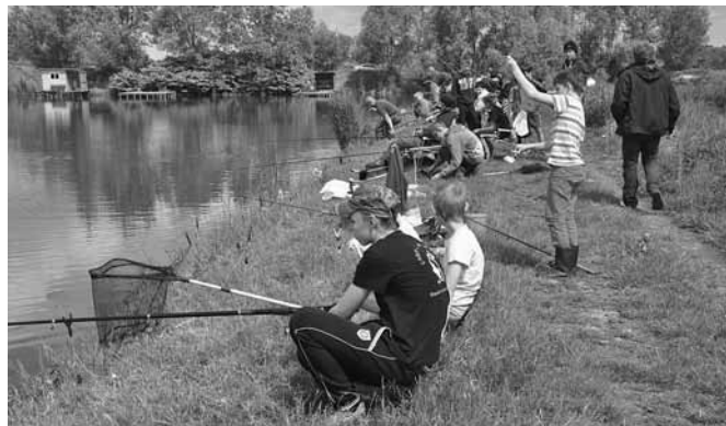
Zawody wędkarskie dla najmłodszych

Członkostwo w Stowarzyszeniu Lokalna Grupa Rybacka „Biel-