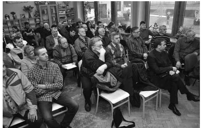
Zebranie wyborcze w Bestwince

Chociaż zebranie wyborcze formalnie nie przewiduje dyskusji i wolnych wniosków, to jednak w Bestwince dyskusja w zasadzie zdominowała całe spotkanie – wójt odpowiadał na pytania, które zadawali przedstawiciele Klubu Sportowego „Bestwinka” (zagadnienie finansowania klubów sportowych), jak również na pytania poszczególnych mieszkańców, związane np. z planowanym przebiegiem drogi S1 (ma ominąć sołectwo Bestwinka), naprawą dróg, kwestią parkingu przy szkole, termomodernizacją ZSP i innymi bieżącymi problemami.