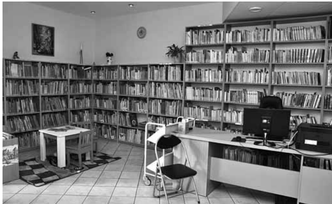
Wnętrze biblioteki w Janowicach

Biblioteki, zwłaszcza te w mniejszych miejscowościach, pełnią nie tylko funkcję wypożyczalni książek. Są prawdziwymi miejscami spotkań, ośrodkami kulturalno – edukacyjnymi. Oddana do użytku po remoncie filia biblioteczna w Janowicach wpisuje się w ten trend, a dzięki wyposażeniu jej w najnowsze zdobycze techniki będzie na pewno często odwiedzana przez mieszkańców sołectwa i całej gminy. W przyjaznym, nowoczesnym wnętrzu utrzymanym w pastelowej kolorystyce każdy znajdzie coś, co pozwoli mu rozwijać własne zainteresowania.