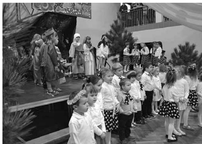
Bożonarodzeniowy spektakl dla babć i dziadków