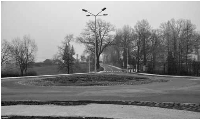
Rondo na skrzyżowaniu ul. Krakowskiej i Witosa

• Zostały zakończone na ten rok prace przy przebudowie ul. Krakowskiej. Drobne poprawki m.in. w obrębie chodników będą wykonane w okresie wiosennym.