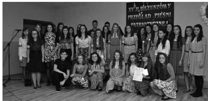
Chór „Andante” - zdobywcy Grand Prix

Kategoria przedszkola – solo, duet, zespół do 5 osób: