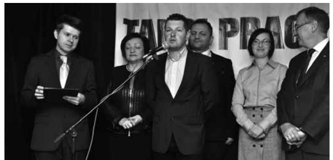
Otwarcie Targów Pracy

Zgromadzonych gości w imieniu organizatorów – Centrum Edukacji i Pracy Młodzieży OHP oraz Urzędu Gminy w Bestwinie