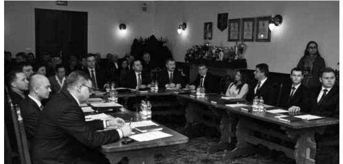
Nowo wybrani radni