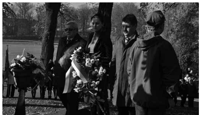
Złożenie kwiatów pod pomnikiem przy Urzędzie Gminy

Sto lat temu zabrzmiały pierwsze salwy pierwszej wojny światowej – konfliktu kończącego definitywnie erę dziewiętnastowiecznego „starego porządku” na kontynencie europejskim. Po wojnie na gruzach imperiów narodziły się nowe państwa, a jeszcze inne odrodziły się po okresie niewoli – tak właśnie było z Polską. Dzień 11 listopada, który dla innych państw oznacza dzień rozejmu, dla Polaków jest Narodowym Świętem Niepodległości. Wspominamy podczas tego święta tych, którzy o wolną Ojczyznę i jej granice walczyli z bronią w ręku w powstaniach i wojnach, na mównicach, na salonach dyplomatycznych i na różne inne sposoby. Józef Piłsudski, Roman Dmowski, Ignacy Jan Paderewski to tylko niektórzy z ojców naszej niepodległości – oni pomogli ją wywalczyć, ale za losy ojczyzny odpowiedzialne jest każde kolejne pokolenie. Suwerenność to nie jest termin