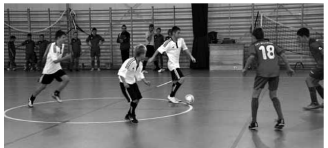
Rozgrywki odbywały się na sali sportowej w Kaniowie