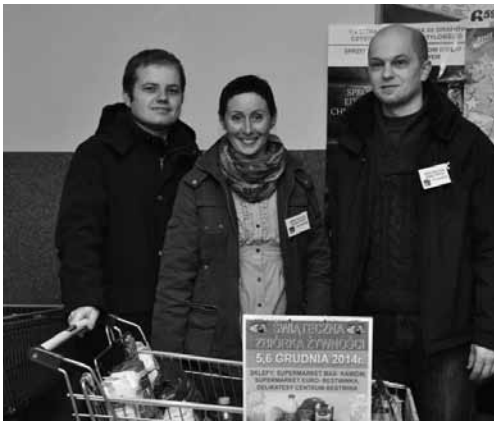
Wolontariusze pomagający w przeprowadzeniu zbiórki

W dniach 5 - 6 grudnia 2014 r. w supermarketach „Delikatesy Centrum” w Bestwinie, Supermarket „MAX” w Kaniowie i Supermarket „EURO” w Bestwinie odbywała się coroczna Gminna Świąteczna Zbiórka Żywności. W tę szlachetną inicjatywę licznie włączyli się mieszkańcy naszych sołectw, ofiarowując łącznie 835 kg artykułów żywnościowych: cukru, produktów mącznych, oleju, konserw, słodczy, itp. Zebrane produkty trafią do świątecznych paczek, które zostaną przekazane osobom potrzebującym z terenu naszej gminy, zwłaszcza osobom starszym i samotnym.