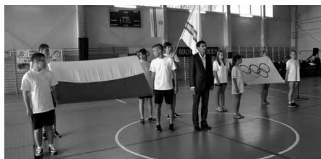
Wprowadzenie flagi olimpijskiej

Tak dobrego roku dla polskiego sportu nie było od dekad. Zaczęło się sześciami medalami na igrzyskach w Soczi, nasi zawodnicy zdobywali tytuły w lekkiej atletyce, kolarstwie, zostali mistrzami świata w siatkówce, a nawet po raz pierwszy w dziejach zwyciężyli z Niemcami na boisku piłkarskim. Nagły przełom? Być może, ale nie wziął się on z niczego, sukcesy nie są zawieszane w próżni. Droga sportowca zaczyna się w dzieciństwie, na poziomie startów w zawodach gminnych i powiatowych. Władze powiatu bielskiego zauważają tę znaną prawdę, mocno akcentując szkolenie dzieci i młodzieży. Wiele na ten temat powiedziano podczas dorocznej inauguracji sportowego roku szkolnego, która odbyła się w dniu 27 października – tym