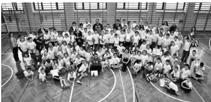
Uczestnicy i organizatorzy Memoriału