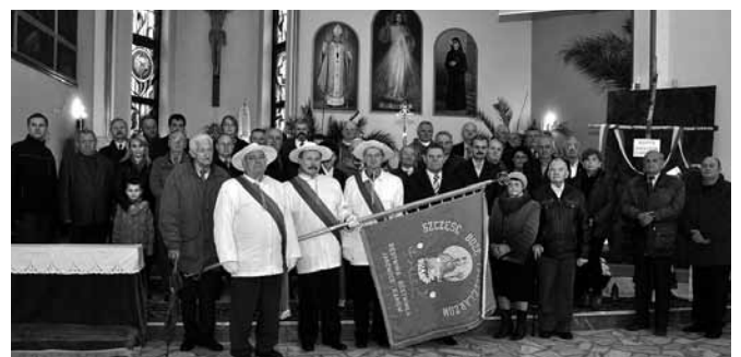
Pszczelarze z gminy Bestwina i ich goście