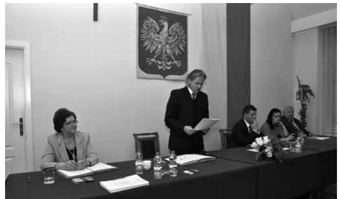
Sprawozdanie przewodniczącego Rady Gminy