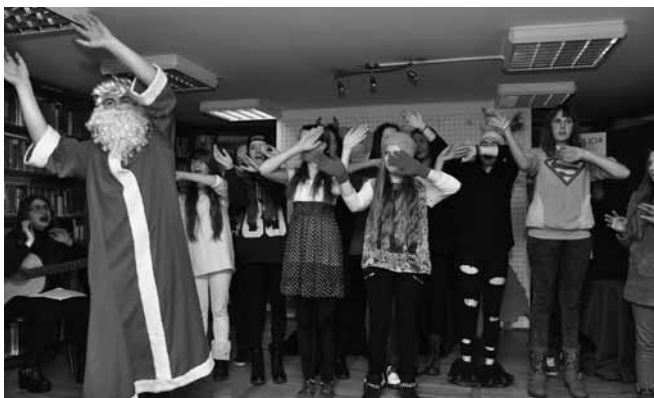
Młodzież z gimnazjum im. Jana Pawła II

Mamy wspaniałą, wrażliwą młodzież o wielkich sercach – zgodnie stwierdziły dyrektor Środowiskowego Domu Samopo-