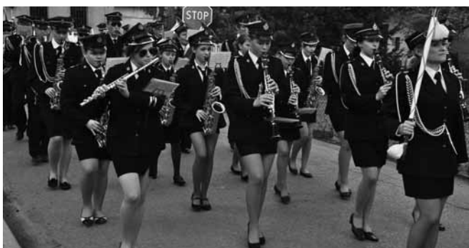
Orkiestra Dęta Gminy Bestwina z Siedzibą w Kaniowie

Nagroda Starosty Bielskiego im. ks. Józefa Londzina jest prestiżowym wyróżnieniem przyznawanym osobom i instytucjom szczególnie zasłużonym na polu kultury, sztuki czy też działalności samorządowej. 7 listopada została wręczona po raz szesnasty – uroczystość odbyła się w Teatrze Polskim w Bielsku-Białej.