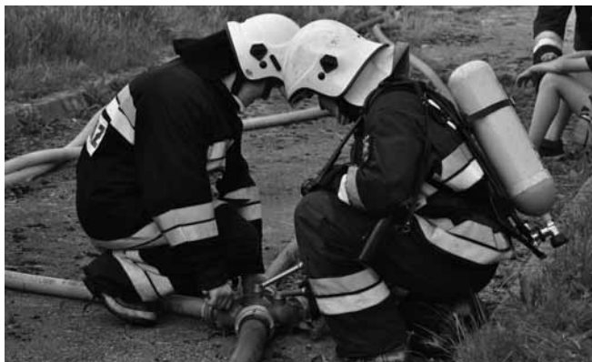
Gminne ćwiczenia OSP w Kaniowie

Sukcesem równie ważnym, choć nieco innego rodzaju, okazały się wysokie miejsca gminnych jednostek w plebiscycie na najlepszą jednostkę OSP w powiecie bielskim. W głosowaniu internautów zwyciężyła OSP Bestwina, zaś Kaniów uplasował się na miejscu trzecim, Bestwinka i Janowice także znalazły się wysoko. Nagrodą