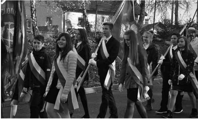
Szkolne poczty sztandarowe

tylko historyczny. Najnowsze wydarzenia na Ukrainie pokazują, iż granice państw są nie są niezmiennie – naród powinien poczuwać się do ich utrzymania i obrony.