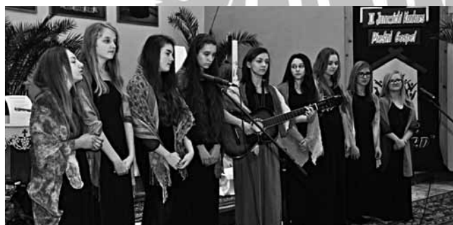
Śpiewają dziewczyny z gimnazjum w Bestwinie