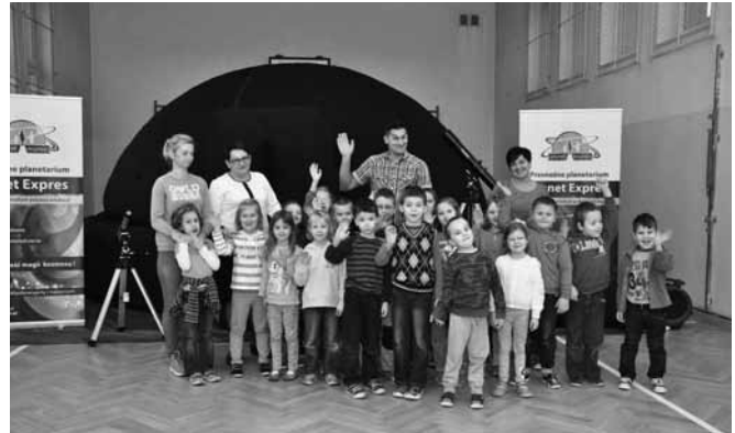
Młodzi odkrywcy kosmosu