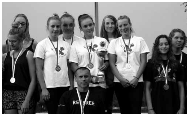
Szczęśliwe zawodniczki UKS „Set” Kaniów

W r. 2014 padło kilka rekordów. W mistrzostwach wzięła udział rekordowa ilość zawodników, klubów i drużyn, a najbardziej cieszy fakt, że w kategorii juniorek młodszych rywalizowało ze sobą aż 14 drużyn. Jest to przecież przyszłość naszego kajak polo, a ich sukcesy mogą być przyczynkiem do dalszego rozwoju tej dyscypliny oraz poparciem dla starań, aby kajak polo stało się dyscypliną olimpijską.