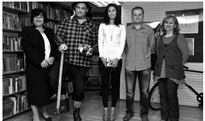
Zwycięzcy Gry Wiejskiej