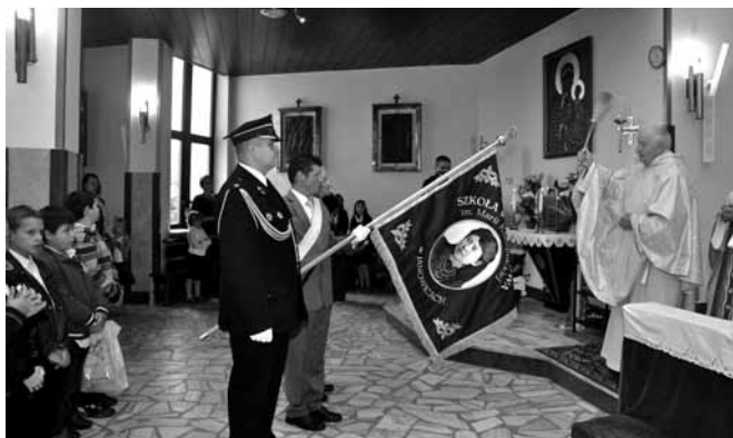
Poświęcenie szkolnego sztandaru