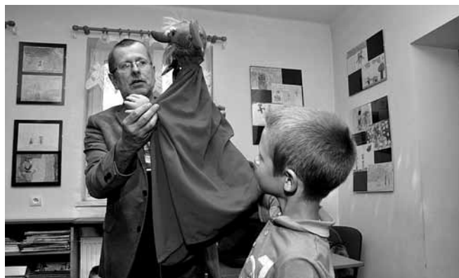
Spotkanie z Kulfonem