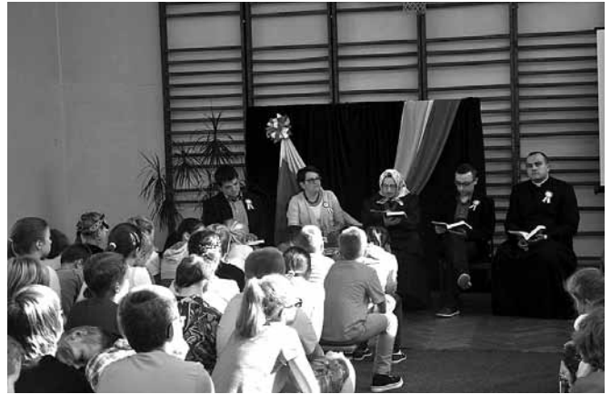
Uczniowie słuchają fragmentów Trylogii