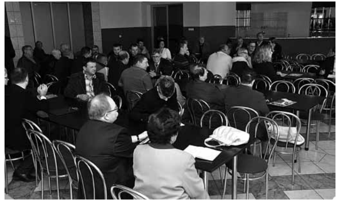
Janowice - mieszkańcy obecni na zebraniu

Do dofinansowania z tzw. programu subregionalnego z sołectwa Janowice zgłoszono budynek przedszkola. Planuje się remont elewacji, dachu i termomodernizację. Natomiast przy nowym placu zabaw przy ZSP ma powstać siłownia zewnętrzna przeznaczona dla nieco starszych mieszkańców. Strażacy będą mogli liczyć na pomoc przy kupnie średniego samochodu bojowego.