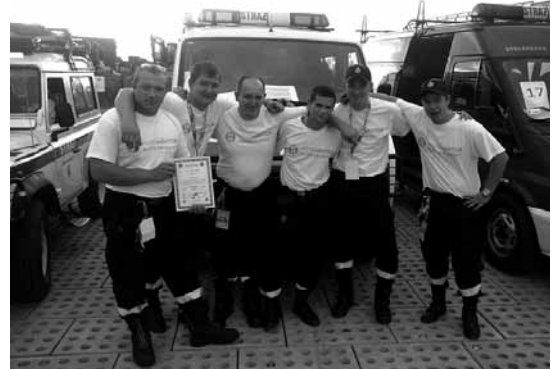
Nasza „srebrna” drużyna w komplecie