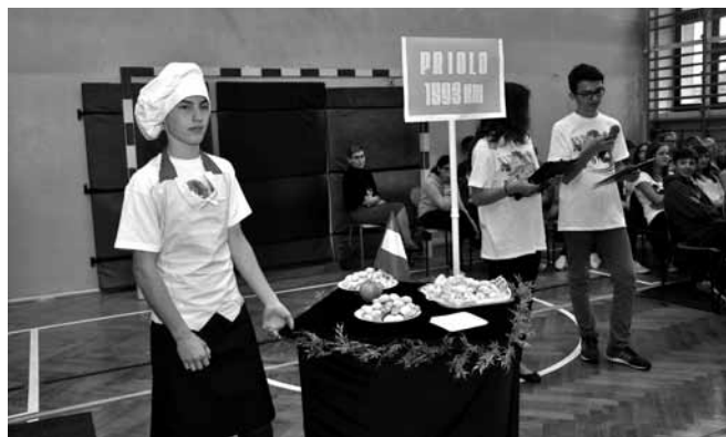
Prezentacja potraw z całej Europy

można było poszerzyć swoje horyzonty i zarazem promować własną „małą Ojczyznę”.