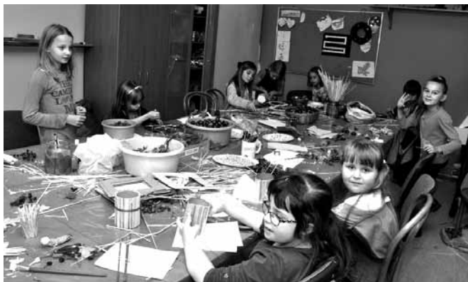
Zajęcia plastyczne w Centrum Kultury

Nie tylko utalentowani muzycy mogą rozwijać zdolności w naszym Centrum Kultury. Sekcja plastyczna to grupa dzieciaków – niekoniecznie tych wybitnie uzdolnionych, ale wykazujących