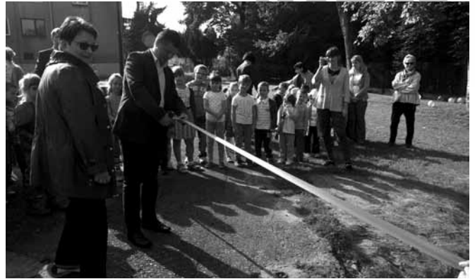
Bestwina - przecięcie wstęgi