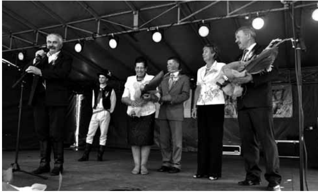
Wręczenie odznaki „Zasłużony dla Rolnictwa”