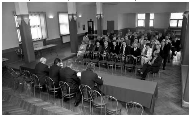
Bestwinka - mieszkańcy i goście