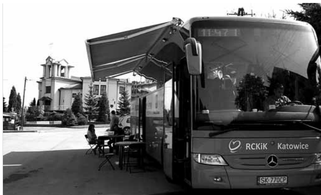
Ambulans do pobierania krwi