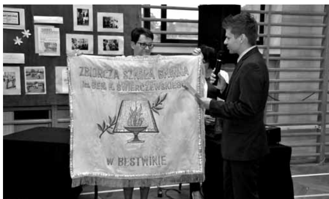
Przekazanie starego sztandaru

Chociaż Karol Świerczewski był postacią, która nie zapisała się najlepiej w historii Polski, należy mieć na względzie uwarunkowania polityczne okresu PRL. Na pewno trzeba docenić fakt, że sztandar przekazany szkole w 1977 r. ufundowano ze składek społeczeństwa Bestwiny i aż do r. 1990 służył on kolejnym rocznikom. Przysięgę na niego składało wielu dzisiaj