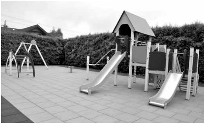
Plac zabaw w Janowicach