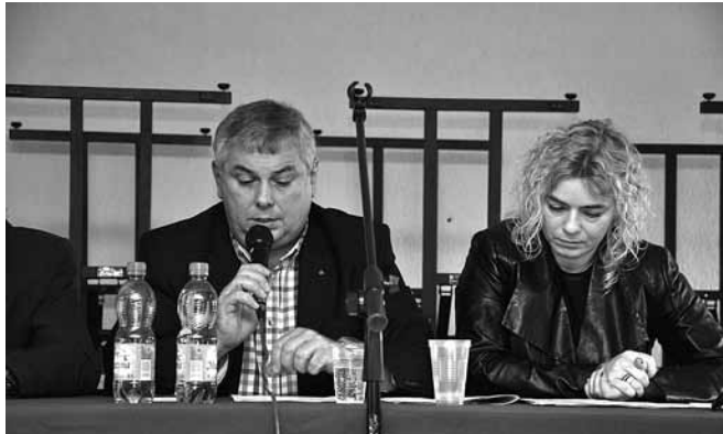
Kaniów - przedstawiciele PG SILESIA

cyjnych. Zabezpieczono przed szkodami plebanię, szkołę, halę sportową, dom gromadki – będzie zabezpieczany także dom katechetyczny. W sprawie drogi ekspresowej S1 PG SILESIA popiera wariant „E”, najmniej „inwazyjny” dla gminy Bestwina.