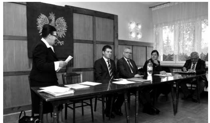
Bestwina - stół prezydialny