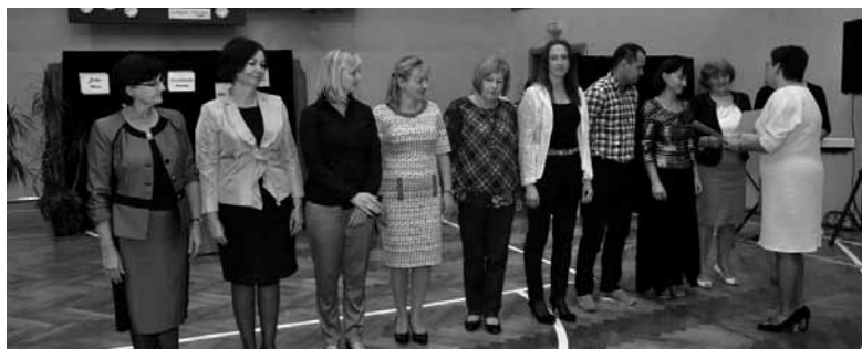
Nagrody dla nauczycieli

już dorosłych uczniów i tego okresu nie da się wymazać z kart szkolnej kroniki.