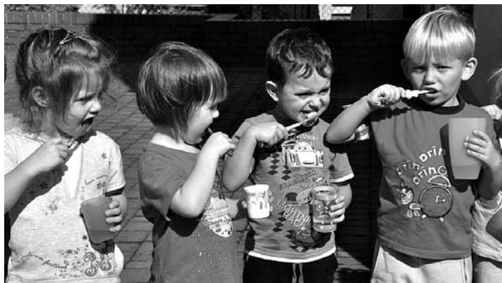
Przedшкоlaki dobrze wiedzą, że o zęby trzeba dbać!

Akcję organizowała w Polsce Akademia Aquafresh. Nauczyciele w przedszkolach realizowali zajęcia edukacyjne na podstawie scenariuszy zajęć i materiałów multimedialnych, w których bohaterowie programu „Pastusie” i „Barney” uczą