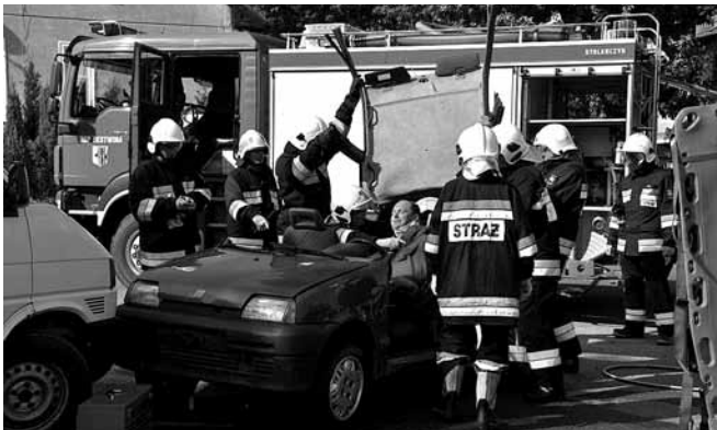
Pokaz ratownictwa technicznego

Tegoroczna aura nie była łaskawa dla rolników. O ile z dawien dawna ambicją bestwińskich gospodarzy było zebranie plonów