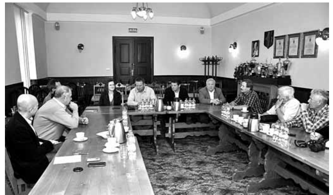
Spotkanie z prezesem PGS w sali sesyjnej Urzędu Gminy

PG SILESIA, jakkolwiek nie prowadzi wydobycia pod Parkiem Lotniczym w Kaniowie, to jednak aktywnie współpracuje z tym przedsiębiorstwem, choćby przy I etapie budowy obwodnicy Czechowic – Dziedzic. W najbliższej przyszłości obwodnica skomunikuje lotnisko z miastem, z drogą DK1 i w dalszej perspektywie z planowaną trasą S1. W sprawie tej ostatniej drogi PG SILESIA popiera wariant E korzystny również dla mieszkańców gminy Bestwina.