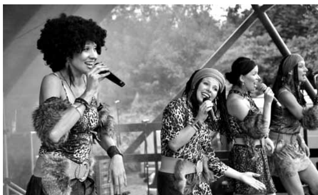
Zespół „Coco Afro”

Zwolennicy emocji sportowych mieli możliwość obejrzenia meczu piłki nożnej LKS „Przełom” Kaniów – KS Iskra Rybarzowice zakończony ostatecznie wynikiem 3:0 dla Kaniowa. Goście korzystali z rozmaitych stoisk, dmuchanych atrakcji, bogatej oferty gastronomicznej. Stowarzyszenie Pomocy Dzieciom, Młodzieży i Rodzinom „Z Sercem na Dłoni” także włączyło się w przeprowadzenie imprezy oferując zapłatanie warkoczyków, robienie nietrwałych tatuaży, malowanie buzi i gipsowych serduszek.