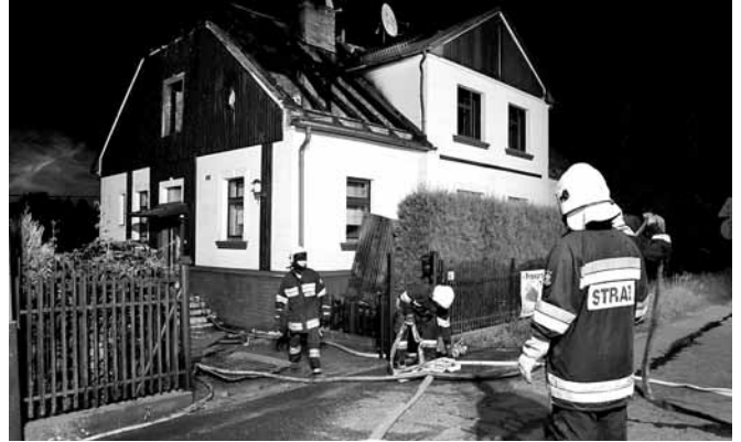
Akcja gminnych jednostek OSP - gaszenie budynku w Bestwinie

Trzeba dodać, że nasi strażacy, zwłaszcza druhowie z Bestwiny podeszli do konkursu bardzo poważnie – zachęcali do głosowania poprzez internet, wydrukowali ulotki, zaprezentowali się także podczas Bestwińskich Spotkań Folklorystycznych. Konkurs jest oczywiście tylko zabawą, nie dzieli straży na lepsze i gorsze, lecz rezultat mówi wiele o społecznym zaufaniu