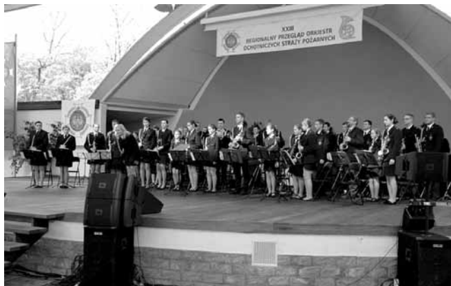
Orkiestra na przeglądzie w Wiśle