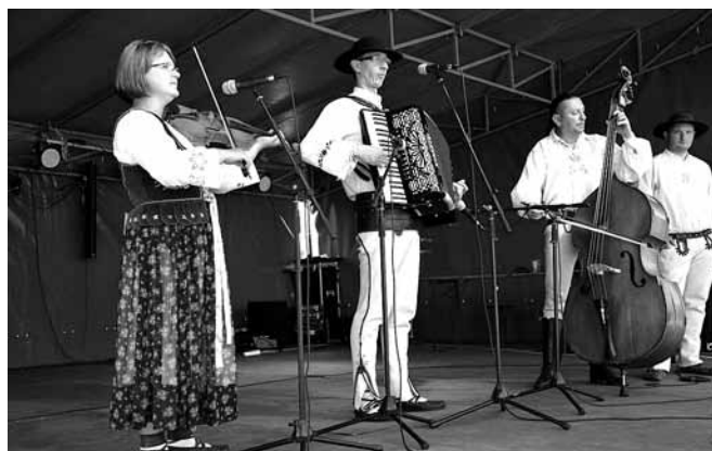
Kapela „Zbójnicy” ze Szczyrku