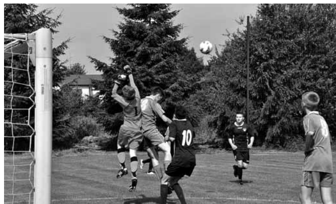
O piłkę walczą młodzi zawodnicy z MDP