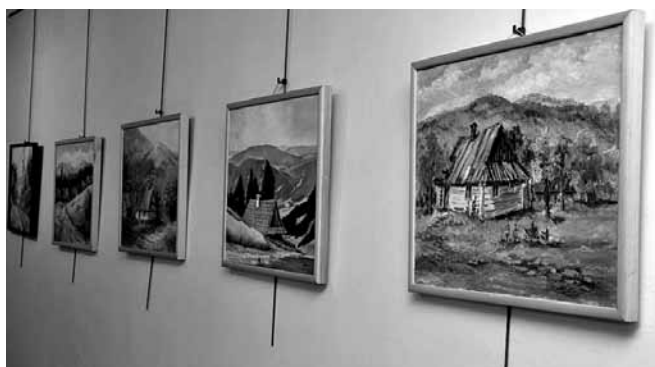
Obrazy zaprezentowane na wystawie