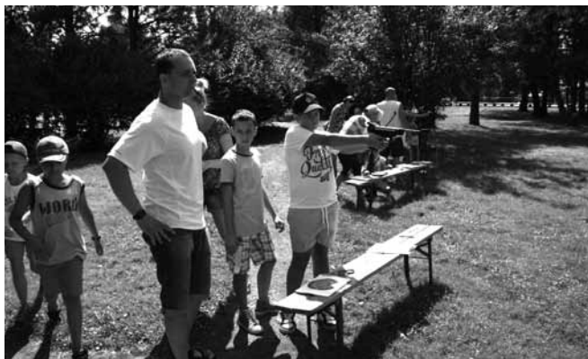
Wspólna zabawa na terenach rekreacyjnych

Drugie zawody miały miejsce 16 sierpnia i w tym dniu w tym