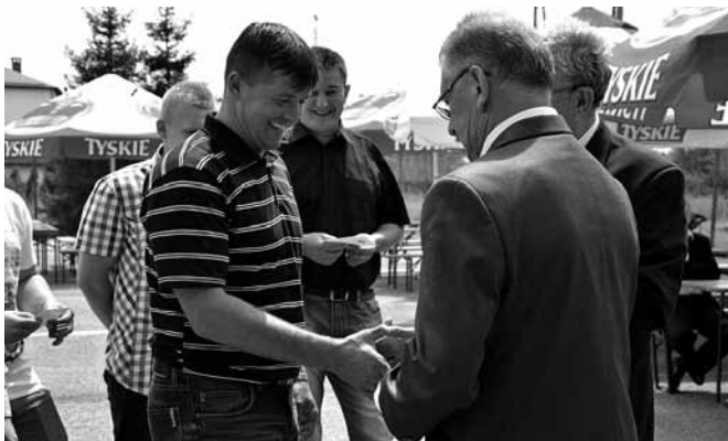
Bestwinka - wręczenie odznaczeń

do rozgrywania meczy i trenowania, choć nie tylko – zaplecze stwarza dobrą bazę do imprez plenerowych. Przetestowali je chociażby goście pikniku zorganizowanego przy okazji turnieju służb mundurowych, który miał miejsce 31 maja.