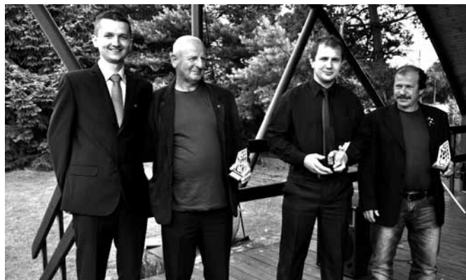
Prezes LKS „Przełom” wraz z zasłużonymi działaczami

Jak już wspominaliśmy w „Magazynie Gminnym”, dzięki dofinansowaniu z Urzędu Gminy i Starostwa Powiatowego, firmom „Dewro”, „Bud-Tor” i wielu innym osobom i instytucjom rozbudowano budynek biurowy i szatnie. W późniejszym czasie na boisku bocznym zabłysły reflektory. Między boiskami wykarczowano drzewa iglaste, zamontowano piłkochwyty oraz boksy dla zawodników, wykonano ogrodzenie głównej płyty od strony północnej. Wszystko oczywiście z myślą o zapewnieniu drużynom dobrych warunków