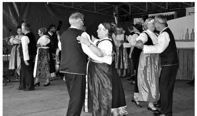
Zespół Regionalny „Pszczyna”

się w dniu 26 lipca i jak zawsze mieszkańcy zostali oczarowani bogactwem strojów, muzyką czy też tańcami.