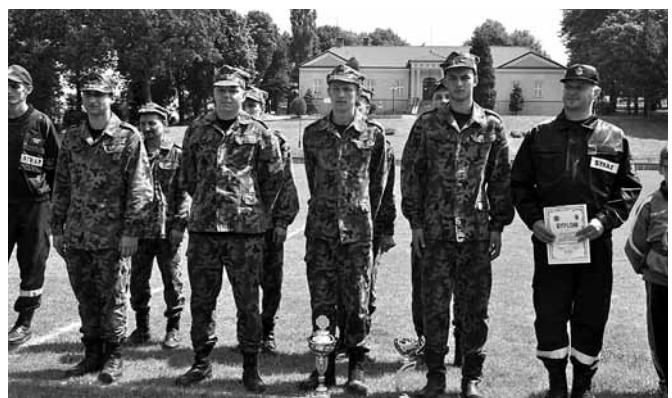
Zwycięska drużyna OSP Bestwinka