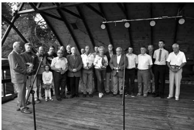
Wręczenie pamiątkowych statuetek

Organizatorzy, czyli wspomniana Sekcja Wędkarska, Centrum Kultury, Sportu i Rekreacji, LKS „Przełom”, współfinansujący imprezę Lokalna Grupa Rybacka „Bielska Kraina”, Starostwo Powiatowe w Bielsku – Białej dołożyli wszelkich starań, by na Święcie Karpia dobrze bawili się starsi i młodszy. Największy