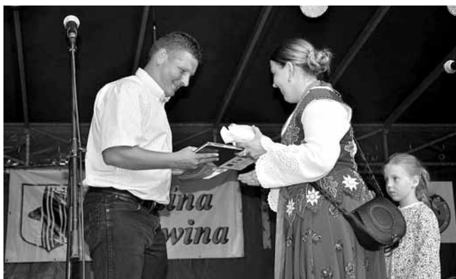
Wymiana symbolicznych podarunków

Z gminy Jasienica przyjechał do Bestwiny zespół „Jasieniczanka”, natomiast z Podhala dziecięca grupa „Mali Maniowianie”.