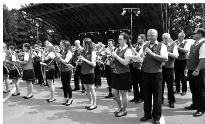
Koncert połączonych orkiestr na terenach rekreacyjnych