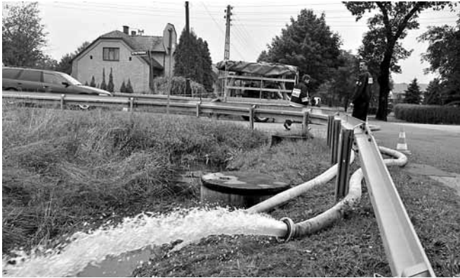
Usuwanie skutków nawałnicy

Dudów, w Janowicach na ul. Pszczelarskiej, zaś w Kaniowie na ul. Młyńskiej, Ludowej, Kóski, Dworskiej, Dankowickiej i Batalionów Chłopskich. Sporo szkód wyrządził niestety czynnik ludzki – z kanału ulgi doprowadzającego wodę do rzeki Białej woda na skutek manipulacji sprawcy została skierowana na Kaniów i Bestwinę.