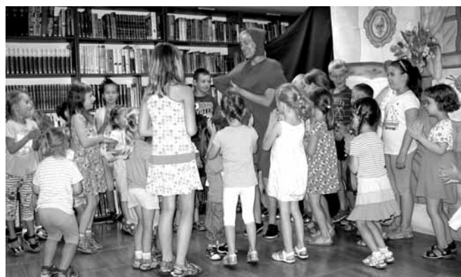
Przedstawienie o Czerwonym Kapturku