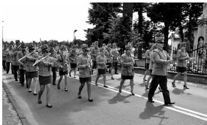
Przemarsz Orkiestry Dętej Gminy Bestwina z Siedzibą w Kaniowie