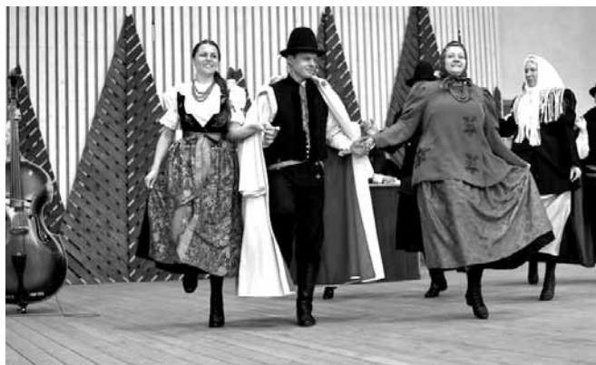
Występ zespołu „Bestwina” w Żywcu