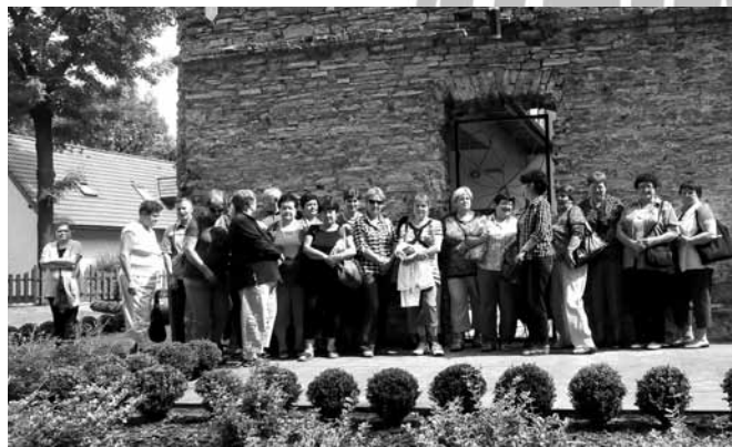
Gospodynie z Janowic w Górkach Wielkich