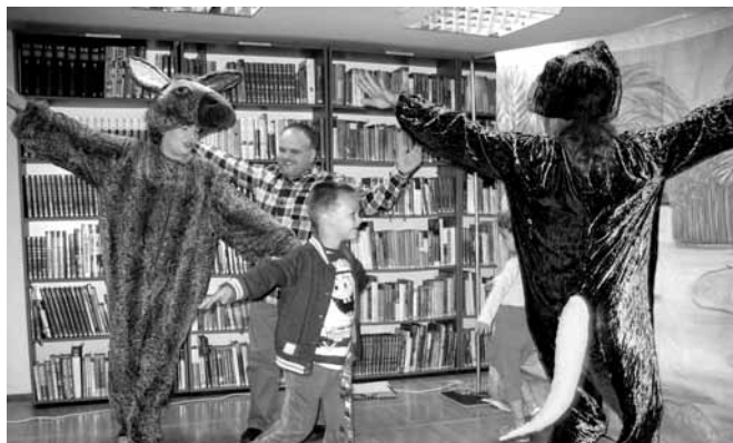
Bajka „Dino nowy przyjaciel”

Wydawać by się mogło, że są to bajki w większości ogólnie znane - nic bardziej mylnego. Nowa aranżacja, nowe teksty i świeże spojrzenie. Niespodzianki czekały na widzów podczas każdego spotkania. A publiczność nas nie zawiodła- przybyły dzieci w towarzystwie rodziców i babć. Zainteresowanie było bardzo duże, chwilami nasza czytelnia nie mogła pomieścić chętnych! W sumie spektakle obejrzało prawie 400 widzów! Widząc liczne roześmiane buzie, myślę, że wszyscy świetnie się bawili - tym bardziej, że nieraz widzowie byli proszeni o aktywny udział, także widzowie dorośli!