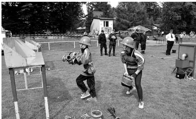
Zawody Młodzieżowych Drużyn Pożarniczych

W zawodach udział wzięły cztery drużyny męskie (grupa A) i jedna młodzieżowa w grupie wiekowej 16 – 18 lat. Poza oficjalną klasyfikacją wystartowali najmłodsi członkowie MDP z Bestwinki i z Kaniowa. Program obejmował tor przeszkód (dla MDP), bieg