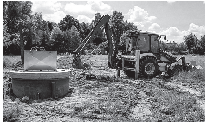
Realizacja kanalizacji w sołectwie Bestwina