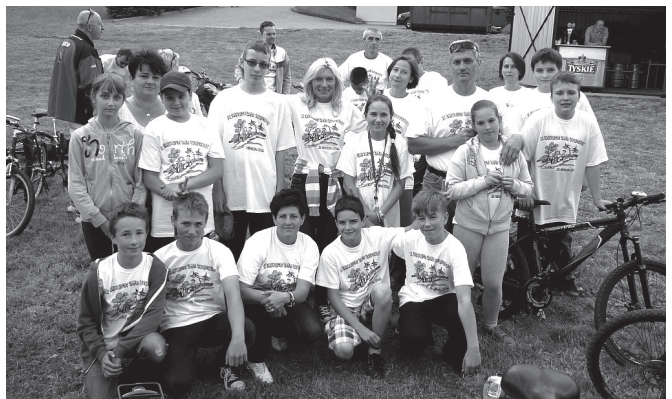
Najliczniejsza ekipa - reprezentacja szkoły w Kaniowie