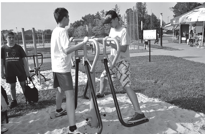
Pierwsze ćwiczenia na nowej siłowni

Wraz z młodzieżą na teren siłowni przybyli samorządowcy i przedstawiciele LGR. Dokonali oni oficjalnego otwarcia, a tak-