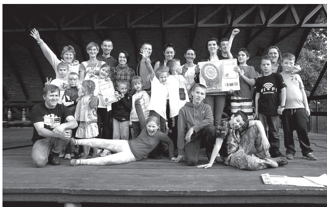
To był wspaniały dzień!