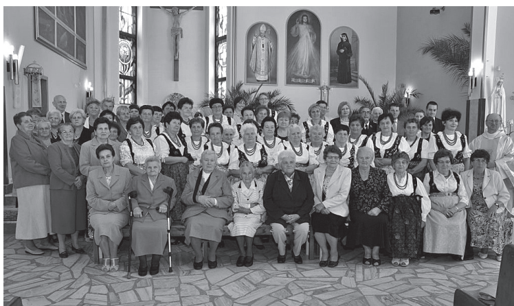
Gospodynie i ich goście