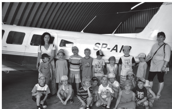
Pamiątkowa fotografia przy samolocie

Młodzi odkrywcy podpatrzyli proces montażu samolotów, zobaczyli stojące w hangarach awionetki, a do jednej, stojącej na pasie startowym mogli nawet zajrzeć. Na wieży kontroli lotów podziwiali