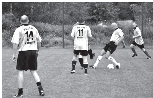
Policjanci przy piłce