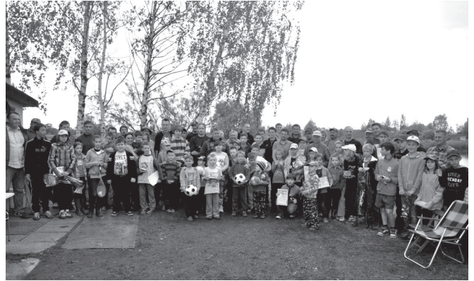
Uczestnicy i organizatorzy