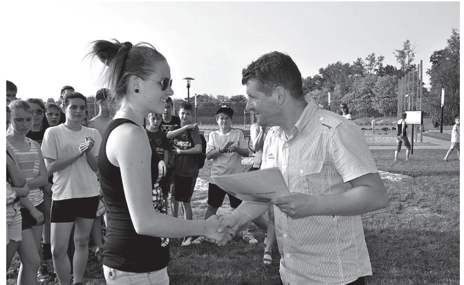
Wręczenie nagród za konkurencje sportowe