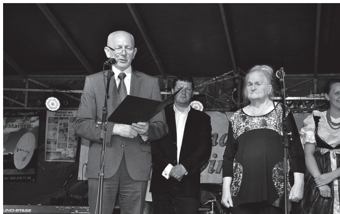
Uroczyste wręczenie odznaczenia