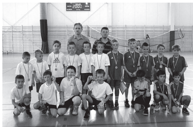
Medaliści halowych rozgrywek