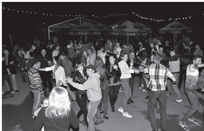
Roztańczeni goście Święta Gminy

Nie zawiody zespoły muzyczne. „Na ludową nutę” zaśpiewał Zespół Regionalny „Echo” z Hecznarowic, a w bardziej liryczne klimaty wprowadziły publiczność artystki z Czechowickiego Teatru Muzycznego „Movimento”. Harmonię dźwięków połączoną z ekspresją myśli, słów i marzeń zaserwowała z kolei „Retrospekcja” – sześciuosobowa grupa z Bielska – Białej. Muzycy, inspirujący się takimi gatunkami jak pop, rock, reggae, swing skutecznie przygo-