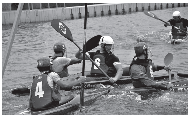
Jeden z wielu rozegranych meczów

Ulewnie deszcze nie zniechęciły dzielnych zawodników, którzy w dniach 14 - 15 VI 2014 r. uczestniczyli w Kaniowie w IX Międzynarodowym Turnieju kajak polo będącym jednocześnie II edycją Pucharu Polski. Organizatorem zawodów był Uczniowski Klub Sportowy „SET” Kaniów, zaś współfinansowali je Starostwo Powiatowe w Bielsku Białej, Urząd Marszałkowski Województwa Śląskiego, Urząd Gminy Bestwina oraz Stowarzyszenie Instruktorów i Trenerów Kajakarstwa.