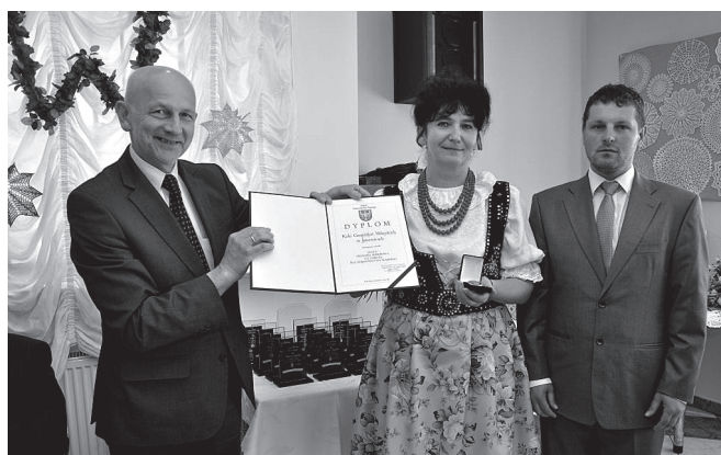
Przyznanie złotej odznaki „Za Zasługi dla Województwa Śląskiego”