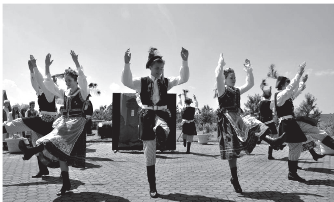
Występ zespołu z Dankowic