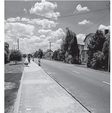
Budowa chodnika w Bestwinie