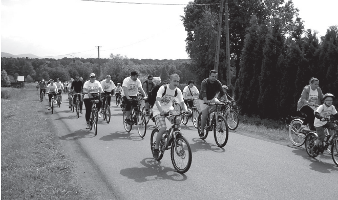
Na trasie rajdu

czyńska wyraziły nadzieję, że wiatr rozgoni deszczowe chmury - i rzeczywiście tak było. Z nieba nie spadła na jadących ani kropla.