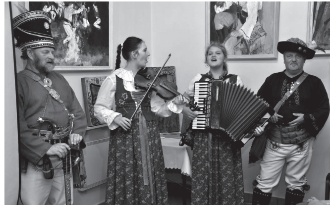
Członkowie stowarzyszenia „Beskidnicy”