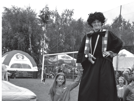
Jak się bawić to tylko w Bestwinie