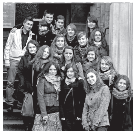
„Allegro” ma już dwanaście lat

powiatowym, wojewódzkim i ogólnopolskim. Zespół uczestniczył w wielu konkursach. Dziesięciokrotnie, od roku 2002 był laureatem I miejsca w ramach Diecezjalnego Przeglądu Pieśni Patriotycznej im. Małgorzaty Papiurek. Dwukrotnie zdobył I miejsce w Międzynarodowym Konkursie „Psallite Deo” - w roku 2009 oraz 2011. Był laureatem Ogólnopolskiego Przeglądu Pieśni Patriotycznej w Krakowie. Zdobył wyróżnienie w Rejonowym Przeglądzie Chórów i zespołów wokalnych w Pawłowicach. Trzykrotnie otrzymał nagrodę Rady Gminy Bestwina za promocję gminy - w latach 2009, 2010, 2011.