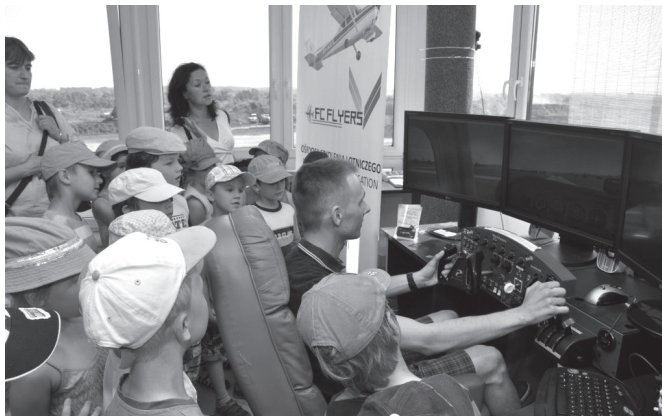
Ćwiczenia na symulatorze lotów

Na razie jeszcze nie oderwali się od ziemi, ale już poczynili pierwsze przymiarki do lotu w przestworza... To oczywiście dzieci z grupy „Bratki” w przedszkolu w Kaniowie, które od dłuższego czasu poznają „na żywo” różne ciekawe zawody i spotykają się z ich przedstawicielami. 10 czerwca przedszkolaki zawitały do Bielskiego Parku Technologicznego Lotnictwa, Przedsiębiorczości i Innowacji w Kaniowie, by „od środka” zgłębić tajniki profesji pilota samolotu.