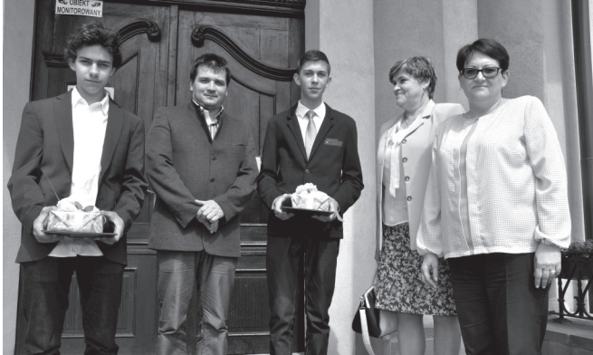
Najlepsi uczniowie naszej gminy