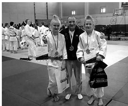
Kolejny zasłużony medal!