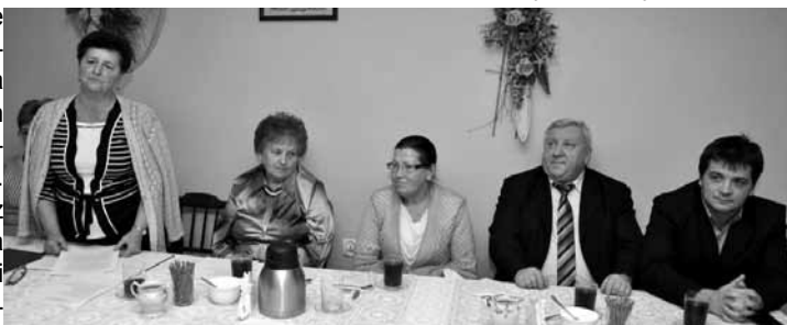
Zebranie KGW Bestwina - stół prezydialny

Te wszystkie elementy nowoczesna gospodyni potrafi przenieść w realia XXI wieku za pomocą nowych technologii i uczynić je atrakcyjnymi dla kolejnych pokoleń. Niezwykle ważna jest również praca społeczna wyrażona poprzez pomoc w organizacji imprez plenerowych i wolontariatu. O różnych aspektach swojej działalności rozmawiały