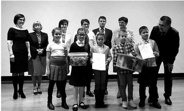
Reprezentacja gminy Bestwina

zwracając szczególną uwagę na: różnorodność oddziaływań dotyczących przygotowania oraz funkcjonowania dziecka 6 - letniego w klasie pierwszej szkoły podstawowej, zapewnienie rozwoju wszystkich sfer rozwoju dziecka, współpracę ze środowiskiem, współpracę rodziców ze szkołą/przedszkolem, aktywizację nauczycieli.