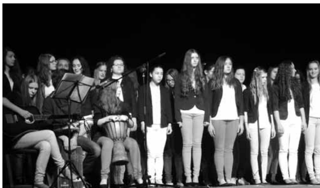
Chór „Andante” na scenie