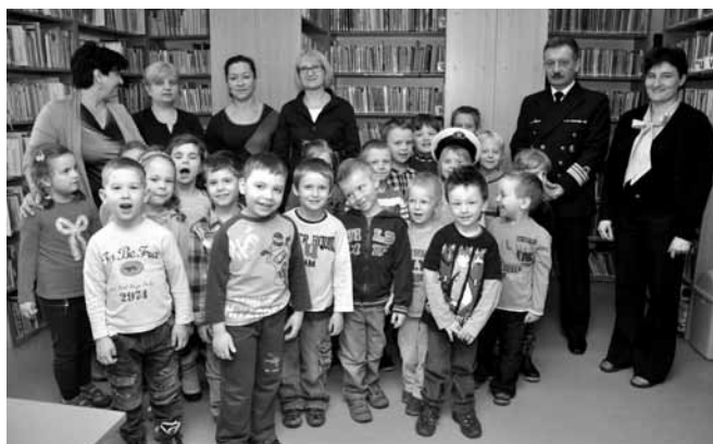
Przedszkolaki i ich niezwykle gość

Być może właśnie z naszych przedszkolaków wyrosną nowi marynarze? Dzieciaki z uwagą słuchały wykładu o okrętach wojennych ich typach,