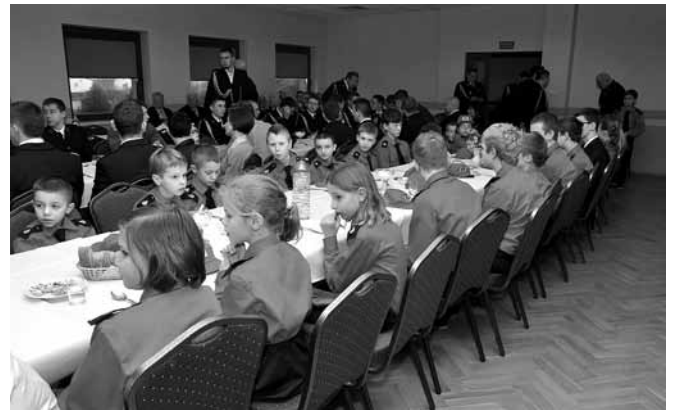
Kaniów - Młodzieżowa Drużyna Pożarnicza

Jednostka OSP w Kaniowie od kilku lat przeżywa dynamiczny rozwój. Nie brakuje druhow, którzy dniem i nocą gotowi są stawić się na wezwanie do akcji – uprawnienia do wyjazdu ma 54 strażaków i ta grupa operacyjna przepracowała ok. 760 godzin, wyjeżdżając do 11 pożarów i 41 zagrożeń miejscowych, w Kaniowie częstych z racji powodzi. Straż to jednak nie tylko akcje – kaniowscy druhowie zorganizowali Dzień Strażaka z pasowaniem członków MDP, zawody sportowo – pożarnicze, turniej tenisa stołowego, Dzień Otwartej Strażnicy, dyskotekę, opłatek, brali udział w uroczystościach państwowych i kościelnych. Szkolili się m.in. podczas ćwiczeń z zakresu ratownictwa lodowego oraz przy okazji Mistrzostw Polski Ratowników (jeden z etapów przebiegał na terenie ładowiska w Kaniowie). Ogólnie na rzecz jednostki i mieszkańców strażacy przepracowali łącznie 3631 godzin.