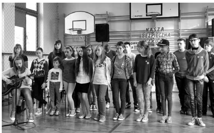
Występy uczniów ZSP Kaniów

Nie zabrakło oczywiście, elementów muzycznych – usłyszano piękne wykonanie (wg własnej aranżacji) piosenki „Do naszej szkoły nie chodzą anioły, ale...” z akompaniamentem gitarowym