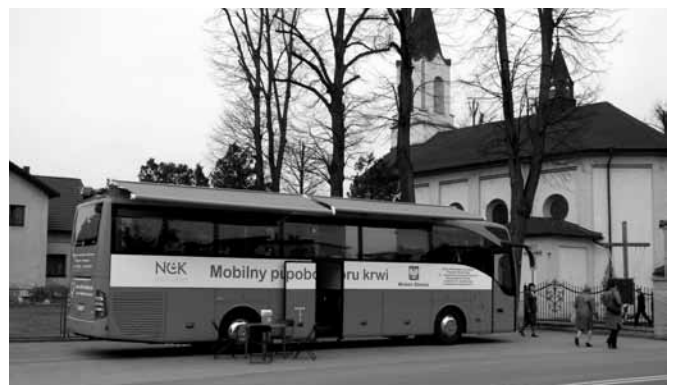
Autokar - ambulans do pobierania krwi