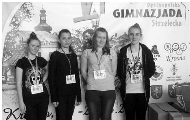
Reprezentantki naszej gminy