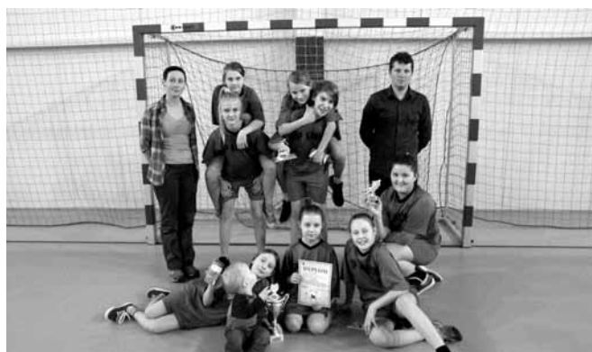
SP Kaniów - I miejsce