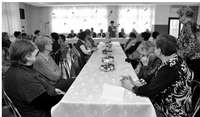
Panie z KGW Janowice przy wspólnym stole