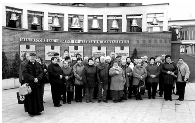
Grupa przed sanktuarium w Łagiewnikach