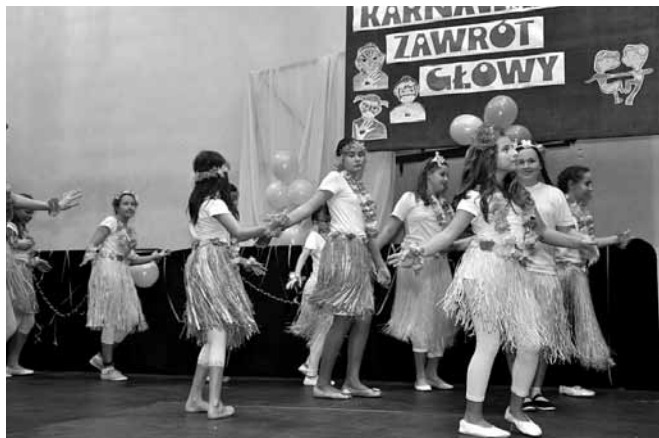
Pokaz talentów - taniec hawajski