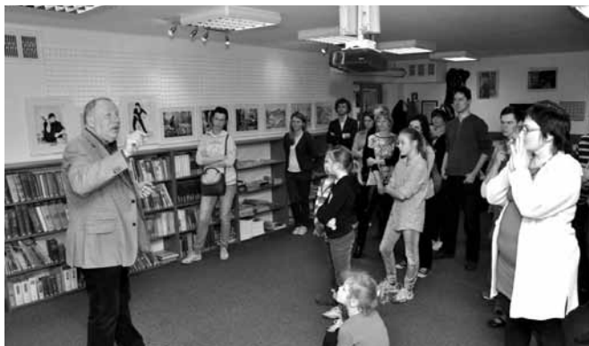
Otwarcie wystawy w dniu 4 kwietnia

Warsztaty zaowocowały wystawą pod tytułem „Tryptyk-i”, której otwarcie nastąpiło w dniu 4 kwietnia w czytelnicy Gminnej Biblioteki Publicznej w Bestwinie. Czoro młodych artystów (i sam Mistrz) zaprezentowało po trzy prace o różnorodnej tematyce – góry, postać ludzka, architektura, maszyny, kultura - i każdy z cykli wniósł do wystawy pewien niepowtarzalny klimat, świadczący także o osobowości autora. Tomasz Łagowski prze-