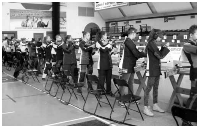
Pewna ręka, bystre oko