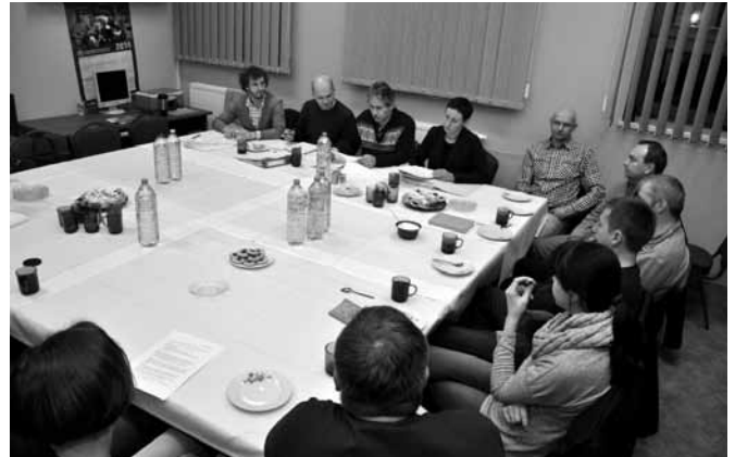
Członkowie stowarzyszenia „Z sercem na dłoni”

Rok 2014 zapowiada się interesująco, ze względu na nowości. Jedną z nich jest nawiązanie współpracy z Lokalną Grupą Rybacką „Bielska Kraina” i zaproszenie do udziału w imprezach organizowanych przez to stowarzyszenie. Niektóre zaplanowane działania już się odbyły – sukcesem zakończył się noworoczny koncert „Gramy, śpiewamy i pomagamy”, a także „Kaniowskie kolędowanie” w auli parafialnej.