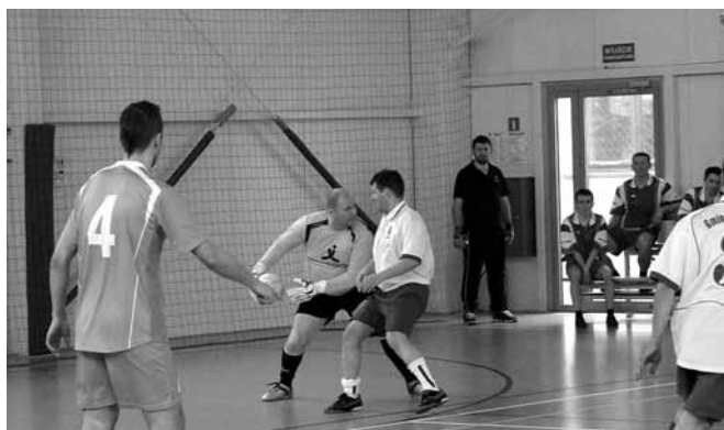
Samorządowcy zamienili garnitury na stroje sportowe

W sobotę, 29 marca, hala sportowa przy Zespole Szkolno – Przedszkolnym w Kaniowie gościła samorządowców powiatu bielskiego, którzy po raz piętnasty rozgrywali Turniej Halowej Piłki Nożnej o Puchar Starosty Bielskiego. Był to pierwszy turniej o takim zasięgu organizowany w kaniowskiej hali.