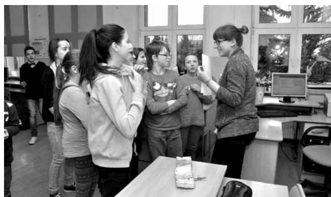
Uczniowie przy pracy