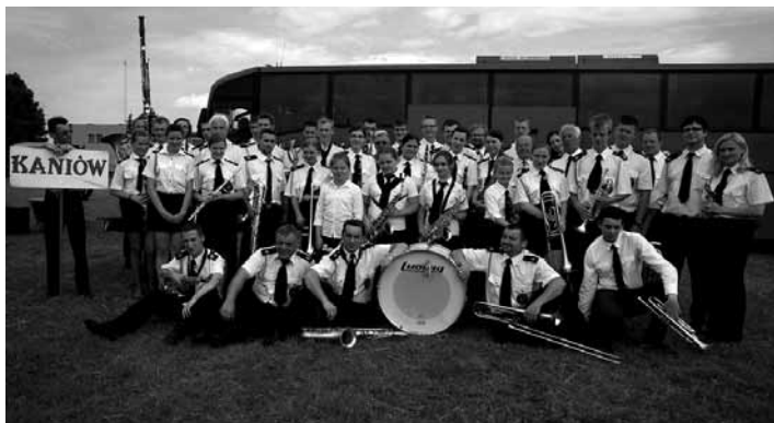
Wspólne zdjęcie członków Orkiestry