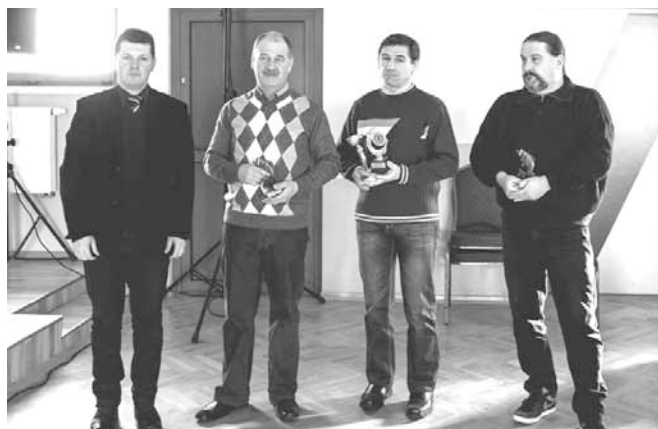
Pamiętkowa fotografia z najlepszymi wędkarzami w 2013 r.

Tekst: S. Lewczak