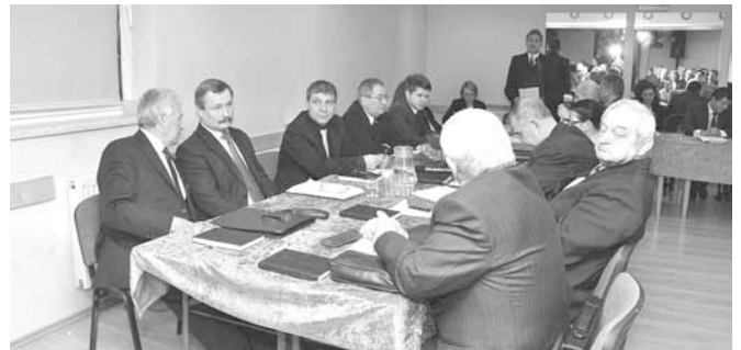
Radni zebrani na sesji w budynku CKSiR

na z dnia 5 grudnia 2013 roku w sprawie Wieloletniej Prognozy Finansowej Gminy Bestwina.