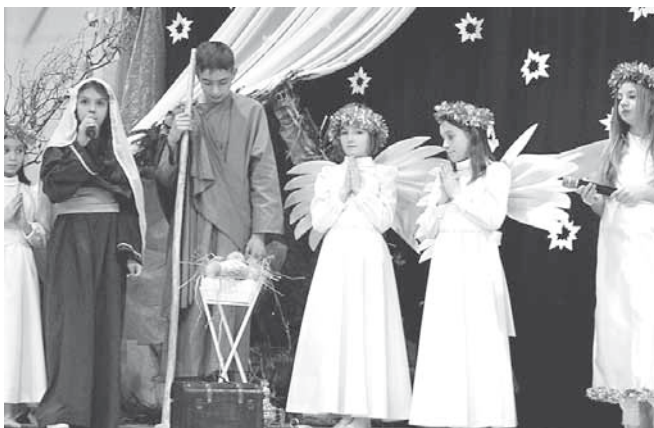
Scena przy żłóbku

Tekst: Iwona Sieracka, fot. Katarzyna Siewniak