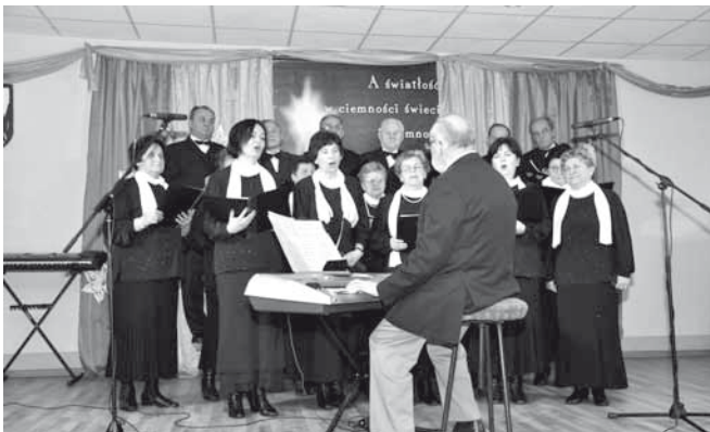
Chór „Ave Maria” z Bestwiny