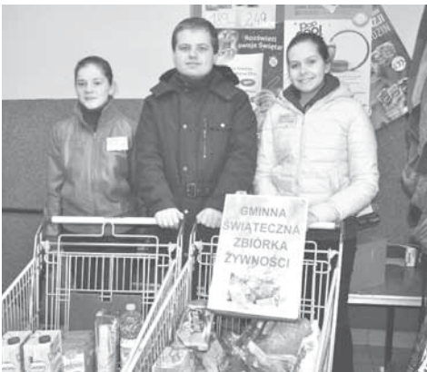
Wolontariusze biorący udział w zbiórce

W dniach 13, 14 i 15 grudnia 2013 r. w supermarketach „Roll” w Bestwinie oraz „Max” w Kaniowie odbywała się Gminna Świąteczna Zbiórka Żywności, koordynowana przez Gminny Ośrodek Pomocy Społecznej. W tę szlachetną inicjatywę licznie włączyli się mieszkańcy naszych sołectw, ofiarowując łącznie 805,88 kg artykułów żywnościowych: cukru, mąki, makaronu, oleju, konserw, słodyczy, itp. Z tego złożono ok. 120 paczek przeznaczonych dla osób potrzebujących.