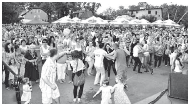
Baw się razem z nami!

23 VIII – Święto Karpia Polskiego - koncert zespołu „Baciary”