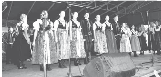
Zespół „Bestwina” zaprasza w swoje szeregi!

Zespół odwiedził ponad 120 miejscowości i wielokrotnie był nagradzany na przeglądach folklorystycznych o zasięgu powiatowym, wojewódzkim i ogólnopolskim. Kilkakrotnie uczest-