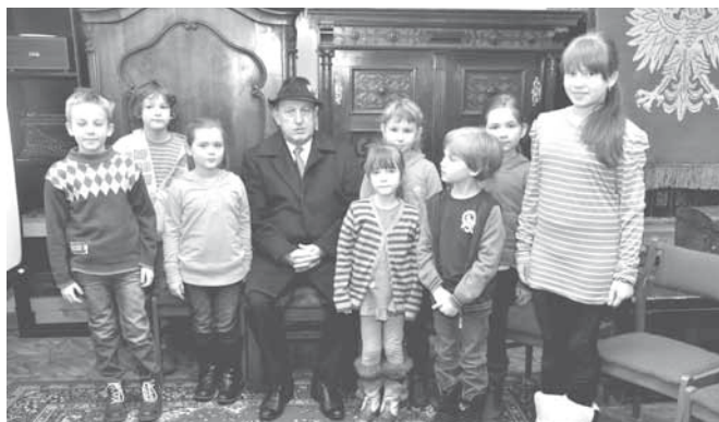
Uczestnicy ferii i arcyksiężę Leon Habsburg

W pierwszym tygodniu ferii zimowych Muzeum Regionalne im. ks. Zygmunta Bubaka zaprosiło najmłodszych na serię interesujących spotkań z historią i tradycją. Oprócz zajęć już sprawdzonych pojawiło się w tym roku wiele nowości. Dzieciaki szczegól-