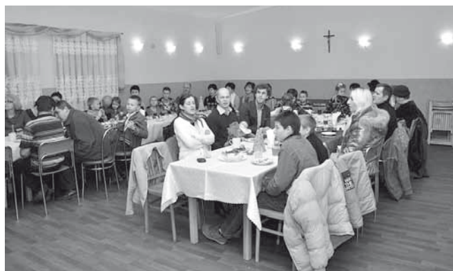
Goście zebrani w auli parafialnej

Druga część „kaniowskiego kolędowania” odbyła się w auli Domu Katechetycznego i zorganizowało ją Stowarzyszenie Pomocy Dzieciom, Młodzieży i Rodzinom „Z Sercem na Dłoni”.