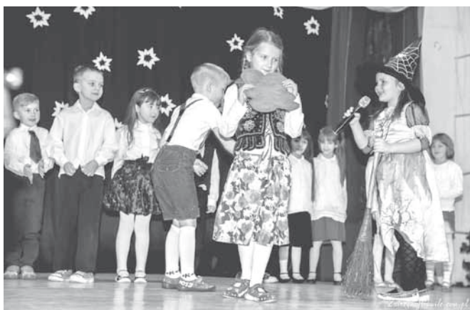
Przedstawienie dla babć i dziadków