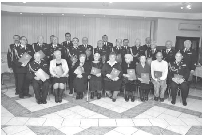
Nagrodzeni druhowie i członkowie ich rodzin