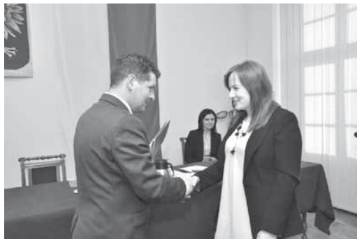
Wręczenie aktu nadania tytułu nauczyciela mianowanego