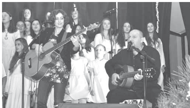
Wśród artystów byli również muzycy z zespołu „Dzień Dobry”