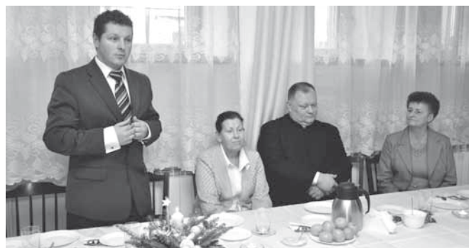
Bestwina - Życzenia od wójta i władz samorządowych