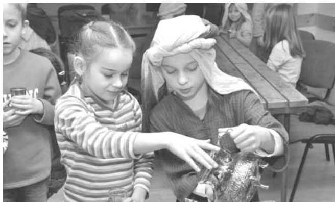
Przyrządzanie marokańskiej herbaty