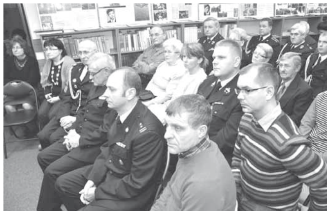
Na widowni nie zabrakło strażaków