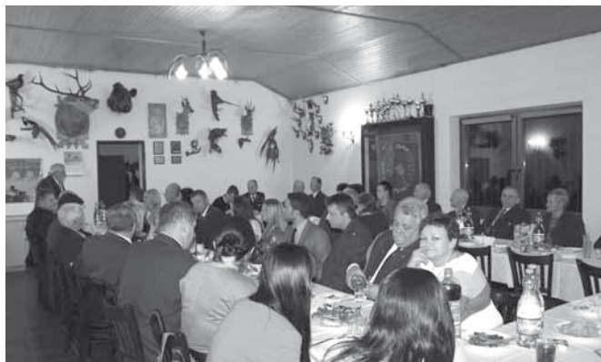
Spotkanie w domku myśliwskim

Tradycyjne obchody św. Huberta, patrona myśliwych były w tym roku dla gminnego Koła Łowieckiego „Bażant” wyjątkowe. Od 65 lat jego członkowie gospodarują zasobami naszych pól i lasów, regulują ilość zwierzyny, dokarmiają ją i przy okazji prowadzą edukację przyrodniczą w szkołach, przedszkolach i bibliotekach. Jest to wspaniały jubileusz i niewątpliwie okazja do podziękowań, wspomnień. Należy pamiętać zwłaszcza o tych, którzy odeszli już do „Krainy Wiecznych Łowów”.