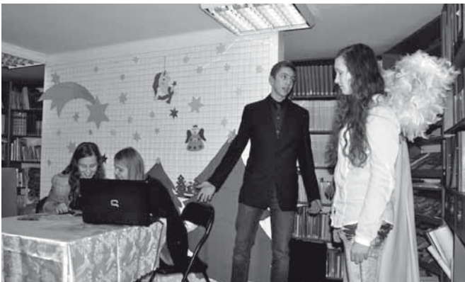
Scena z przedstawienia

Aż dwie klasy gimnazjum im. Jana Pawła II w Bestwinie włączyły się w przygotowanie mikołajkowego przedstawienia dla osób niepełnosprawnych zrzeszonych w Środowiskowym Domu Samopomocy „Centrum”. Spektakl odbył się 4 grudnia w czytelni Gminnej Biblioteki Publicznej w Bestwinie, a opowiadał o tym, co jest najważniejsze w świętach Bożego Narodzenia. Młodzi ludzie zajęci zabawą, modą, grami komputerowymi z początku nie chcieli słuchać Anioła przynoszącego Dobrą Nowinę, jednak w scenach końcowych otworzyli się na przyjęcie nowonarodzonego Dzieciątka.