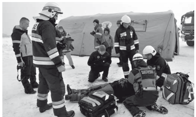
Udział w mistrzostwach ratowników

W czerwcu na boisku sportowym LKS „Bestwina” strażacy rywalizowali w zawodach sportowo – pożarniczych, w których zwyciężyła jednostka z Janowic. Reprezentacje OSP starto-