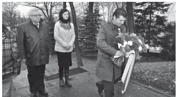
Złożenie kwiatów pod pomnikiem