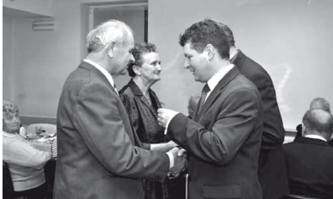
Wręczenie medali „Za Długoletnie Pożycie Małżeńskie”