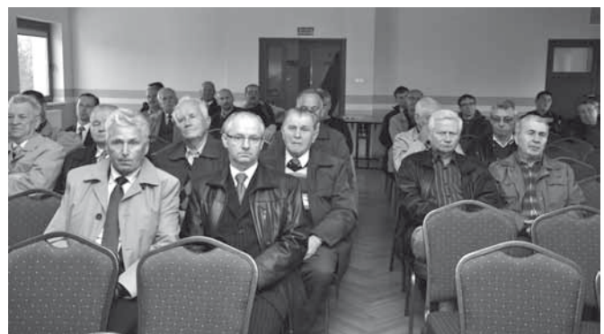
Mieszkańcy sołectwa Kaniów

Z dalszej części wypowiedzi wójta obecni mieszkańcy dowiedzieli się, że remonty dróg powiatowych przebiegają zgodnie z planem. Na bieżąco przeprowadzane są remonty cząstkowe innych dróg. Na budynku gromadzkim wymieniono rynny, zaś na schodach tego obiektu położono płytki ceramiczne, dzięki czemu wejście nie stwarza już zagrożenia. Artur Beniowski po-