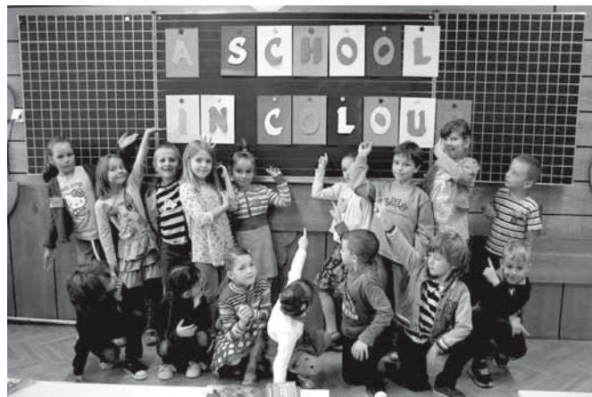
Uczniowie biorący udział w projekcie