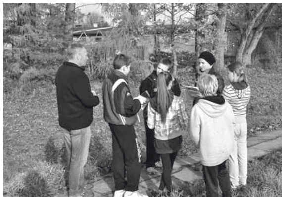
Zadanie przy stanowisku archeologicznym