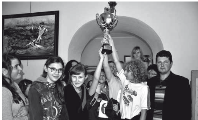
Zwycięzcy z Pucharem Wójta Gminy Bestwina