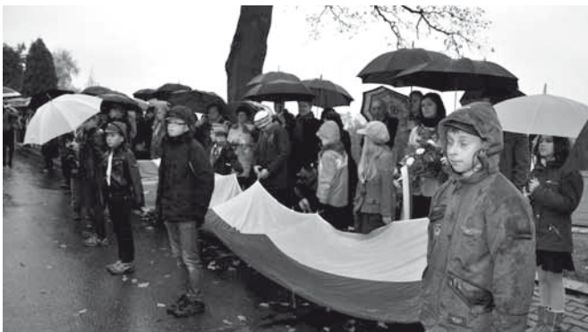
Flaga przygotowana przez harcerzy

Pojęcie patriotyzmu wywołuje na tyle dużo emocji, że właściwie każda próba jego zdefiniowania może narazić nas na ataki – że nadużywamy słów „Ojczyzna”, „Polska” albo wręcz przeciwnie – używamy ich za mało. Spór odżywa zawsze w okolicach 11 listopada i istnieje tyle stanowisk, co partii politycznych, a wręcz pojedynczych osób. Mają do tego oczywiście święte i konstytucyjne prawo, lecz czy kiedy trzeba potrafią współpracować? Przykład mogą nam dać wielkie postacie z historii Polski, współtwórcy niepodległości Roman Dmowski i Józef Piłsudski, różniący się ideowo, ale stojący po jednej stronie w momencie tego wymagającym. Czy będzie stać nas na to w mniej spokojnych czasach?