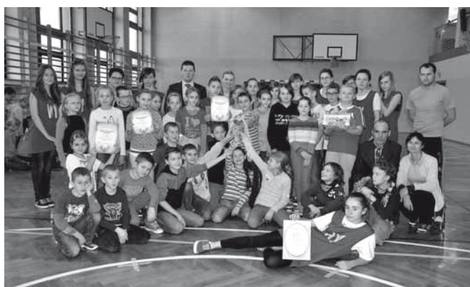
Z Wójtem Gminy Bestwina - pamiątkowa fotografia po zawodach