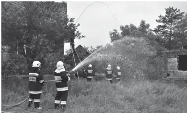
Ćwiczenia w Bestwinie