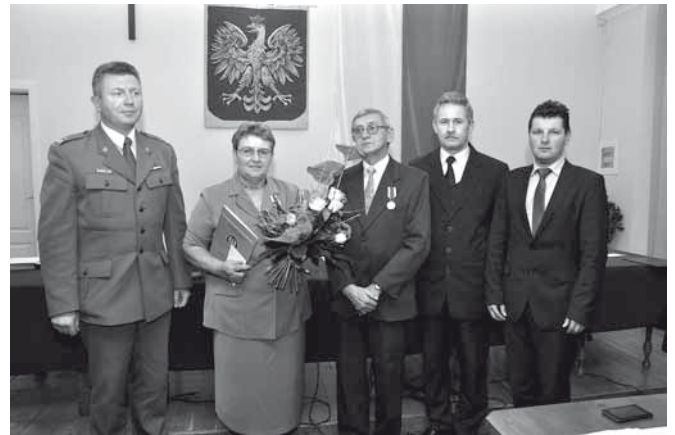
Wręczenie medali „Za Zasługi dla Obronności Kraju”

5) Obniżenia średniej ceny skupu żyta dla obliczenia wysokości podatku rolnego na 2014 rok,