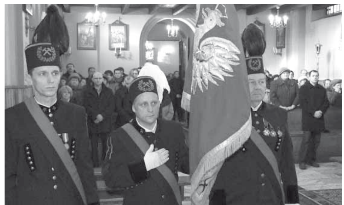
Poczet sztandarowy górników

W tym roku również dzieci zaprosiły swoje babcie, dziadków, mamusię, tatusiów, ciocie i wujków związanych z górnictwem w przeszłości i teraz i zaprezentowały im przygotowany na tą okoliczność program artystyczny, wręczyły specjalne laurki i złożyły mnóstwo pięknych życzeń. Patrząc na to młode pokolenie można być pewnym, że o świętej Barbary nikt w Kaniowie nie