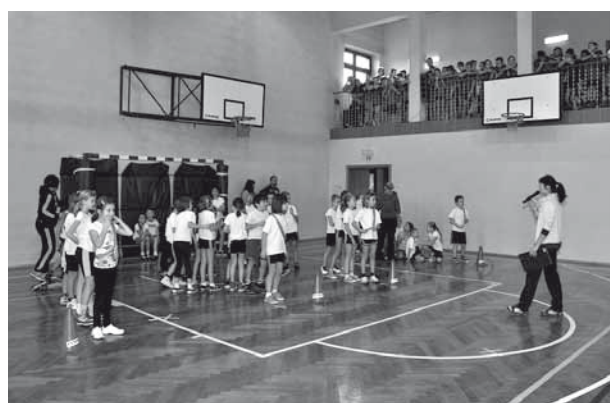
Wszystkie konkurencje prowadziła pani Agnieszka Dutka