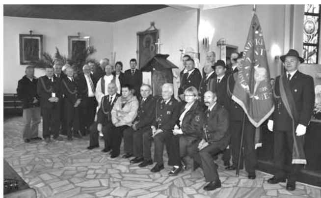
Myśliwi z Koła Łowieckiego „Bażant” oraz ich goście