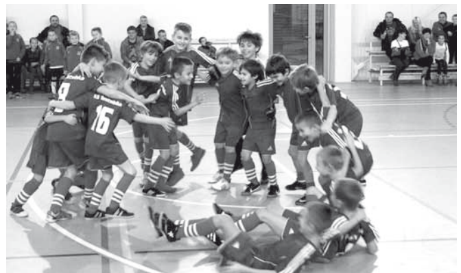
Radość żaków z Bestwinki - bramka w ostatniej sekundzie