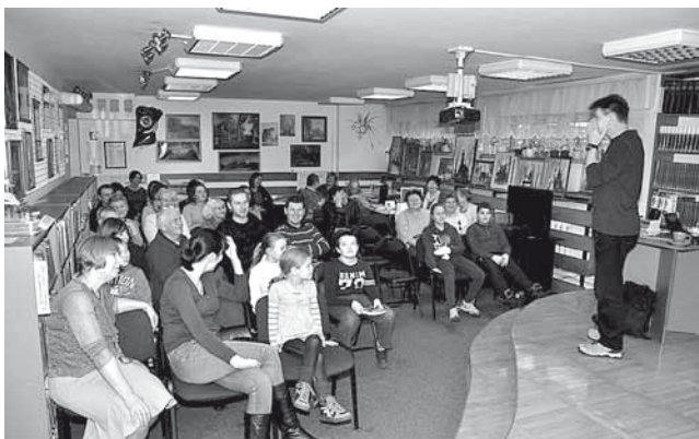
Jedno z ciekawych spotkań w naszej bibliotece

Gminna Biblioteka Publiczna ul. Szkolna 8 43-512 Bestwina tel. 32 214 14 09