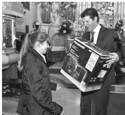
Wręczenie nagrody Grand Prix