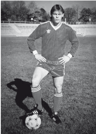
Śp. Ryszard Kraus - wybitny piłkarz rodem z Bestwiny