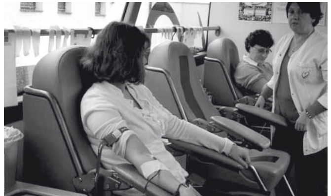
W autobusie do pobierania krwi