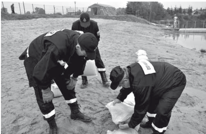
Trening z zakresu ochrony przeciwpowodziowej

W roku 2013, do 30 listopada strażacy wyjeżdżali do 125 zdarzeń, w tym 19 pożarów, 104 miejscowych zagrożeń takich jak podtopienia, odnotowano również dwa alarmy fałszywe. W porównaniu z rokiem ubiegłym znacząco wzrosła liczba wspomnianych zagrożeń miejscowych (49 w r. 2012), lecz wynika to m.in. z faktu obfitych opadów deszczu, na przykład nawałnicy, jaka przeszła nad gminą końcem czerwca. Druhowie mieli zatem „pełne ręce roboty”, po raz pierwszy interweniowali już kil-