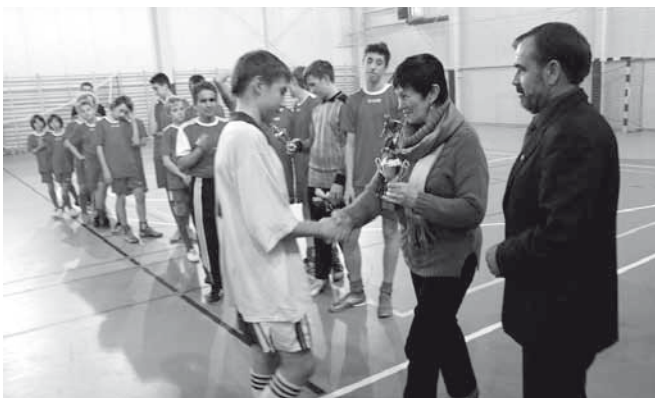
Puchar odbiera kapitan młodzików LKS „Przełom” Kaniów