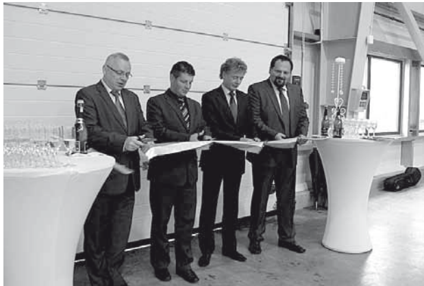
Samorządowcy przecinają wstęgę

żenia powiedział m.in. Powstanie Centrum Transferu Technologii Kompozytowych to świetny przykład współpracy samorządu powiatowego, gminnego i prywatnego biznesu. To inwestycja perspektywiczna, stwarzająca nowe miejsca pracy. Dodam, że od siedmiu lat, gdy powstawał Bielski Park Technologiczny zatrudnienie znalazło tutaj trzysta osób, głównie z powiatu bielskiego. Otwierany dzisiaj obiekt CTTK będzie podmiotem wspierającym przedsiębiorców w szczególności zainteresowanych uruchomieniem bądź poszerzeniem produkcji kompozytowej, odnawialnych źródeł energii lub innych innowacyjnych przedsięwzięć. Dzięki tej inwestycji powiat bielski mocno wpisuje się na mapę gospodarczą Polski jako obszar innowacyjnych produkcji w dziedzinie motoryzacji, lotnictwa i pro-