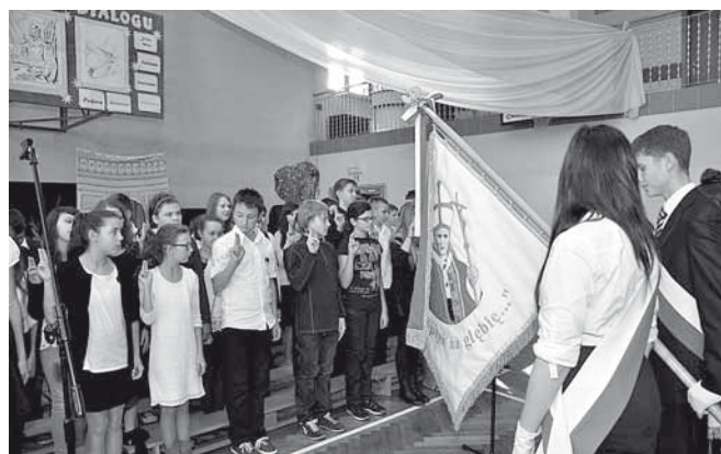
Ślubowanie klas pierwszych gimnazjum