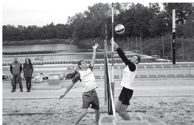
Siatkarze zmierzili się na obiekcie OSWiR