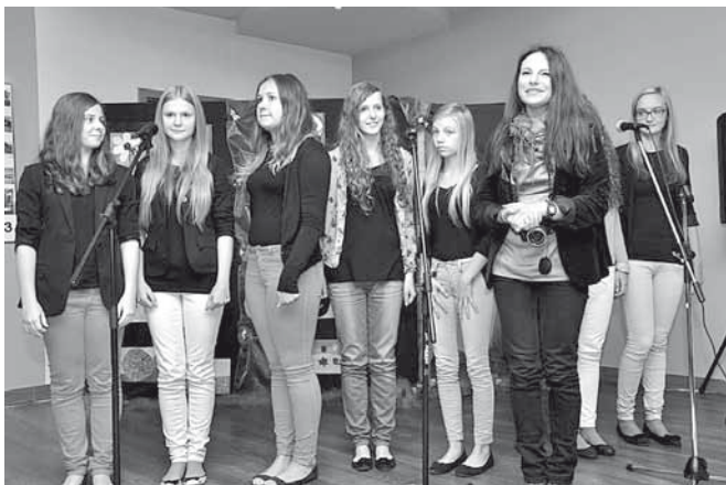
Występ zespołu „Bel Canto”

bracji podniosło sprowadzenie do Bestwiny relikwii św. abpa Józefa Bilczewskiego – jego osobę stowarzyszenie „Razem” wybrało na patrona domu.