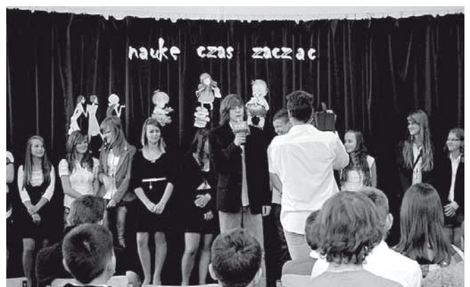
Występy uczniów z Bestwinki