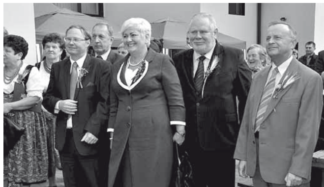
Przedstawiciele Sejmu RP oraz Rady Powiatu Bielskiego