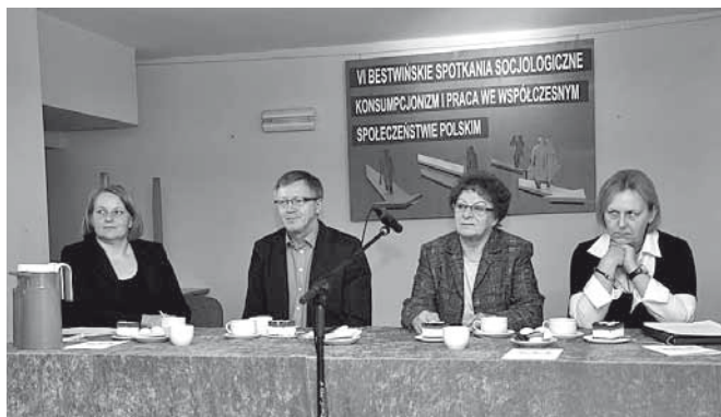
Wykładowcy zaproszeni na konferencję

pragną z kolei zajmować się „wszystkim”, wyciskając ze swoich pracowników wszystkie siły, ale nie robiąc tego efektywnie, zgodnie z rzeczywistymi kompetencjami danej osoby.