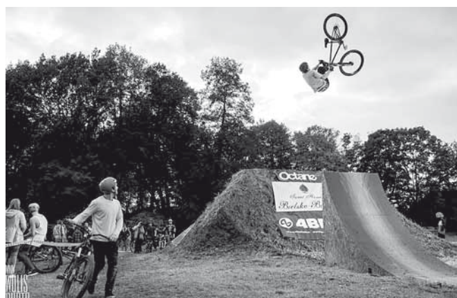
Przy ulicy Szkolnej rowery latały w powietrzu!

Coroczna impreza to swojego rodzaju zakończenie sezonu polskich zawodów rowerowych w tej dyscyplinie. Zawody zostały przeprowadzone w formie luźnej 3 godzinnej sesji, podczas której wyłoniono dwa pięciomiejscowe podium, w dwóch kategoriach: 1. DIRT - zawodnicy rywalizowali skoczniach ziemnych, na których