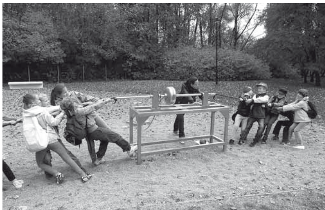
Na uczniów czekało mnóstwo ciekawych eksperymentów