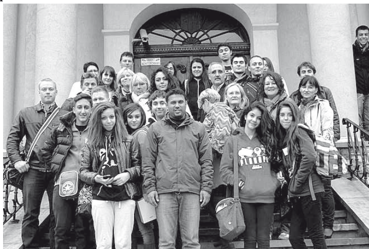
Nasi goście przed Urzędem Gminy