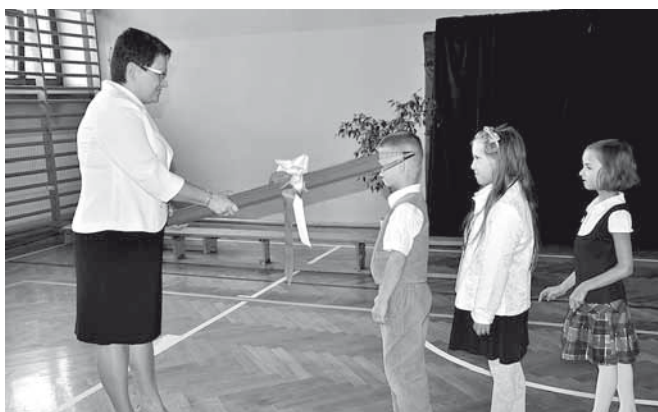
Pasowanie pierwszoklasistów w Bestwinie

Ogółem w gminnych szkołach i przedszkolach uczyć się będzie w roku szkolnym 2013/2014 1390 uczniów i przedszkolaków. Według danych GZOSiP na dzień 10 września w rozbiu na poszczególne placówki wygląda to następująco: