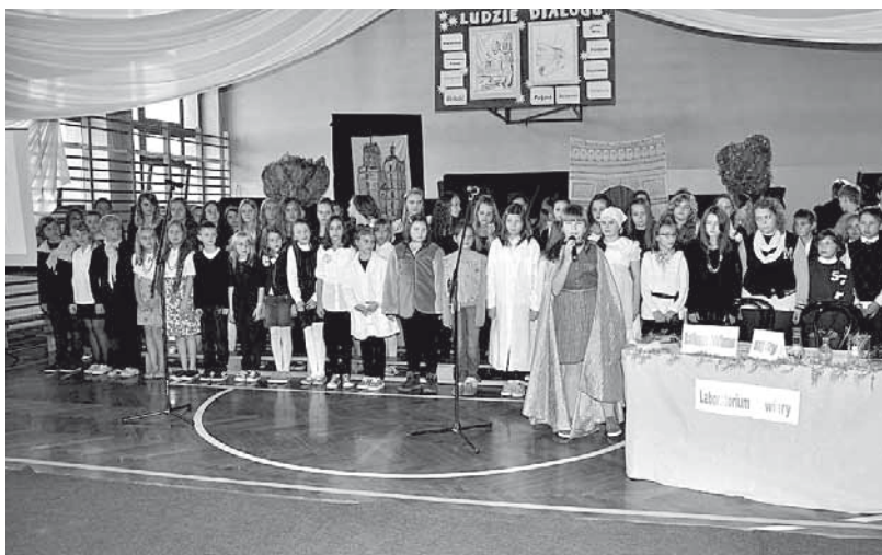
„Ludzie dialogu” - program teatralno - muzyczny