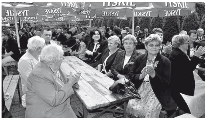
Bardzo licznie dopisali goście - mieszkańcy gminy

nik Walusiak nawiązał do polskiej tradycji i obrzędowości związanej z pracą rolnika, wskazując zarazem na chleb jako dar od Boga. Przypomniął o szacunku, który temu pokarmowi jest należny i życzył, by nigdy nam go nie zabrakło.