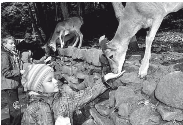
Wizyta w Leśnym Parku Niespodzianek

Prawdziwy harcerz zawsze ma oczy i uszy otwarte na piękno ota-