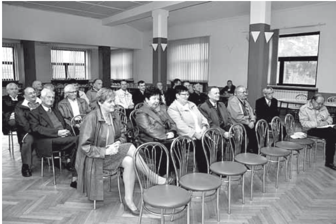
Mieszkańcy sołectwa Bestwinka

padami. Poprosił mieszkańców o współpracę z Urzędem Gminy w przypadku nieprawidłowości związanych z nieodbieraniem śmieci na czas, bądź niedostarczeniem worków. Wyraził radość, że w skali całej gminy wpłynęło ponad 99% deklaracji. Gorzej jest natomiast z płatnościami - wpływa ok. 85-87% z nich. Przypomniał, że zgodnie z inicjatywą grupy radnych, za odbiór śmieci można płacić co miesiąc, a nie jak dotychczas – co kwartał.