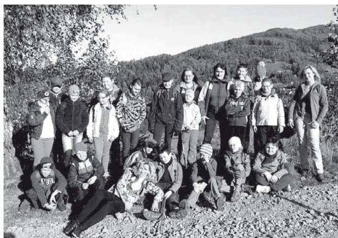
Uczniowie i nauczyciele na górskim szlaku

Po zdobyciu szczytu i krótkim odpoczynku każdy z uczestni-