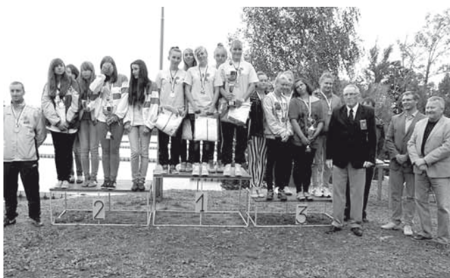
Podium szczęśliwe dla naszych zawodniczek