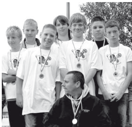
Młodzicy UKS „Set” Kaniów