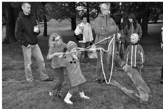
Puszczanie baniek mydlanych

Organizatorzy wyrażają swoje gorące podziękowania wszystkim ludziom dobrego serca, bez których impreza nie mogłaby się udać. Sponsorzy tegorocznego „Dnia Radości” to Urząd Gminy Bestwina, Pizzeria „Prowansja”, Cukiernia „Asteria”, Centrum Kultury, Sportu i Rekreacji, oraz anonimowi ofiarodawcy. Słowa