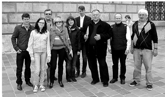
Wspólna wycieczka do Krakowa

Następnego dnia goście wzywali w Krakowie, zwiedzając katedrę na Wawelu, kościół Mariacki, kościół Świętych Apostołów Piotra i Pawła oraz krakowskie sukienice. Niezwykłym przeżyciem było odwiedzenie grobowców na Wawelu czy wieży katedry z dzwonem Zygmunta.