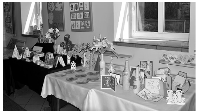
Fragment wystawy prac uczniów

Udział w warsztatach jest współfinansowany ze środków Unii Europejskiej w ramach Europejskiego Funduszu Społecznego, Program Operacyjny Kapitał Ludzki, Priorytet IX Rozwój wykształcenia i kompetencji w regionach Działanie 9.5 Oddolne inicjatywy edukacyjne na obszarach wiejskich.