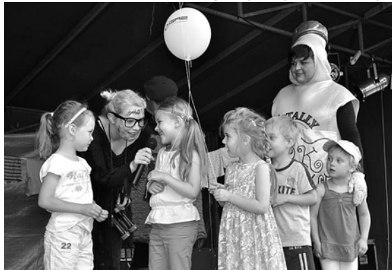
Teatryk dla dzieci

Ponieważ festyn odbywał się w przededniu wejścia w życie nowej ustawy o gospodarce odpadami, nie mogło obyć się bez akcentów związanych z tematem segregacji śmieci. Ideę tę przybliżył najmłodszym widzom teatr „Pozytywka” w przedstawieniu pt. „O Piecyku i Kurzyku”. Dzieciaki brały czynny udział w tej interaktywnej formie teatralnej, dowiadując się przy okazji, że nie należy „karmić” pieca plastikiem czy też odpadami z kuchni. Być może po takiej nietypowej lekcji będą w stanie zachęcić do segregowania śmieci swoich rodziców?