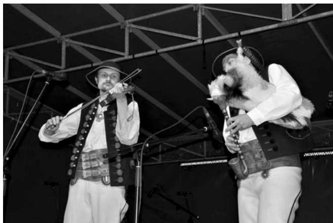
Górale z kapeli „Warzonka”

Z Gilowic koło Żywca przyjechał do Bestwiny zespół regionalny „Dolanie”, reprezentujący tradycje swoich okolic. Uwagę zwracały zwłaszcza pewne podobieństwa w stroju bestwińskim i gilowickim. Także wyjątkowo barwnie wyglądało „Podegrodzie” – zespół regionalny z miejscowości o tej samej nazwie. Podegrodzie to niejako „stolica” ziem zamieszkiwanych przez Lachów, stąd też stroje tancerzy aż kapały od rozmaitych ozdób