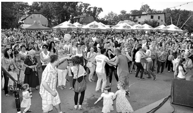
Frekwencja była wyjątkowo wysoka a humory dopisywały