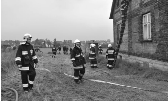
Ćwiczenia w gaszeniu budynku mieszkalnego