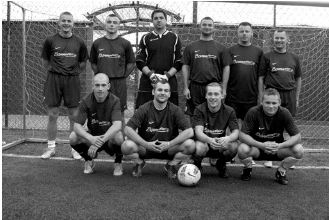
„Dobre Chłopaki - Bomatur” - zwycięzcy ligi