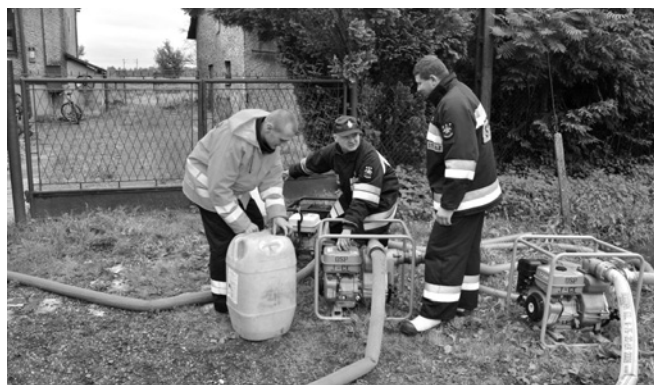
Usuwanie skutków powodzi

Ponadto stwierdzono, że uprawy rolników zostały podtopione. Szacuje się szkody w uprawach na powierzchni ok. 150 ha. Weryfikacja zgłoszonych strat w gospodarstwach domowych spowodowanych podtopieniami, pod kątem przyznania zasiłku celowego z budżetu państwa zgodnie z wytycznymi Ministerstwa została przekazana i jest prowadzona przez Gminny Ośrodek Pomocy Społecznej w Bestwinie.