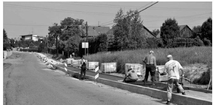
Budowa chodnika na ul. Janowickiej

Dobiega końca budowa chodnika dla pieszych w ciągu drogi powiatowej – ul. Janowickiej w Janowicach. Obecnie trwają prace związane z układaniem kostki brukowej. Projekt ten jest dofinansowany ze środków EFRROW w ramach PROW 2007-2013 poprzez LGD Ziemia Bielska. Dodatkową pozytywną informacją jest fakt przekazania przez Zarząd Dróg Powiatowych w Bielsku-Białej placu budowy pod wykonanie przebudowy ul. Janowickiej.