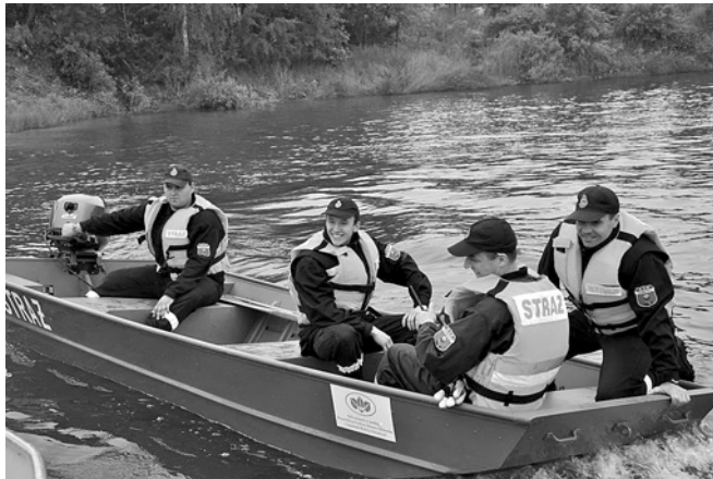
Manewry na akwencie GOSWiR