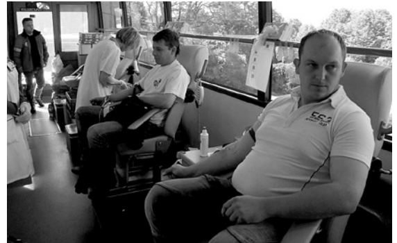
Wnętrze autobusu do pobierania krwi