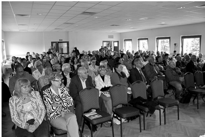
W wykładach uczestniczyło wiele osób z gminy Bestwina i spoza niej