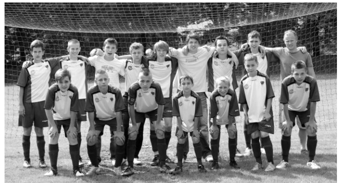
Zwycięska drużyna LKS Bestwina

Najlepszym strzelcem zespołu z Bestwiny został jego kapitan,