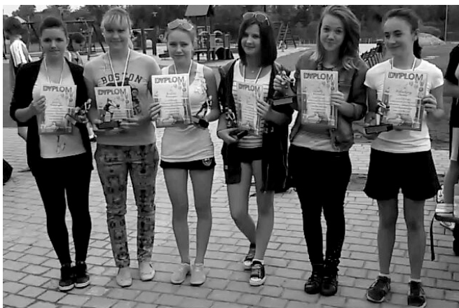
Siatkarki z dyplomami za zwycięstwo