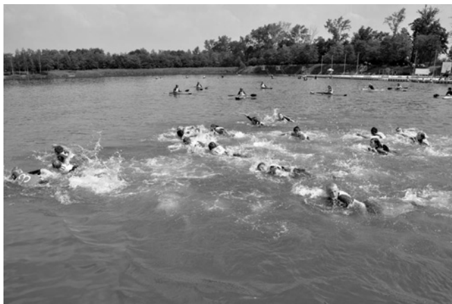
Mini Triathlon o Puchar Starosty Bielskiego

W Mini Triathlonie swoich sił spróbowało w sumie 47 zawodniczek i zawodników w różnych grupach wiekowych. Nie wszystkim udało się dopłynąć do mety, chyba niektórzy mieli źle przygotowany sprzęt, ponieważ jakoś już na starcie kajaki nabierały wody i znikwały pod jej powierzchnią.