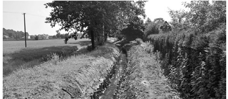
Umocnione brzozi Młynówki

Umocnione zostały skarpy rowu Młynówka na odcinku od ul. Sportowej do ul. Zagrodniej. Zadanie to ma bardzo duże znaczenie dla posesji znajdujących się w sąsiedztwie rowu, ponieważ podczas nawet niewielkich opadów deszczu były one regularnie podtapiane. Pierwszy egzamin nowe umocnienie zdało już w okresie od 24 – 25 VI b.r. podczas nawałnic, jakie nawiedziły naszą gminę.