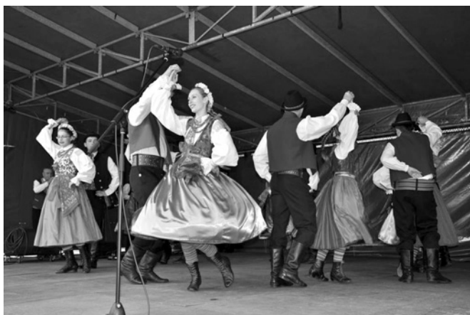
Występ zespołu „Cepelia-Fil”

Cóż to jest ten „Laski uOzgraj?” – zadawały sobie pytanie panie, których rozmowę podsłuchałem podczas XI Bestwińskich Spotkań Folklorystycznych w dniu 25 maja. Na szczęście nie musiałem spieszyć z odpowiedzią, gdyż jedna z rozmówczyń ubiegła mnie, wyjaśniając, że ów „uOzgraj” (czyt. Łozgraj) to po naszymu „zabawa”, mówiąc bardziej nowoczesnym językiem „ impreza”. A że „laski” – bo pochodzący od etnicznej grupy Lachów, do której również należymy my, mieszkańcy gminy Bestwina.