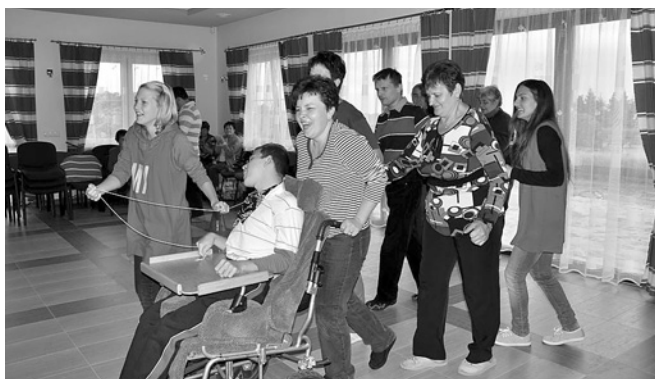
Wspólne gry i zabawy