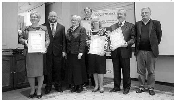
Dyrektor GBP Bestwina (trzecia od prawej) z nagrodą