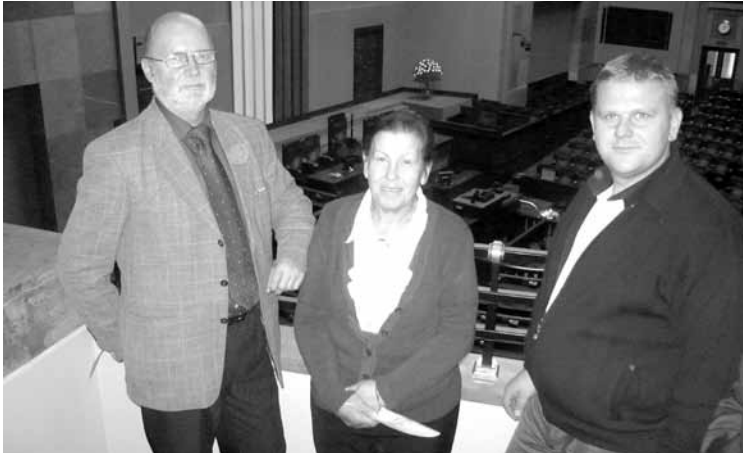
Sołtysi z gminy Bestwina w Sejmie RP

W dniu 28 XI br. wraz z sołtysami powiatu bielskiego i ziemi żywieckiej (w ramach integracji) został zorganizowany wyjazd do Warszawy. Zwiedziliśmy budynek Sejmu, salę posiedzeń i na miejscu połączyliśmy się z posłami zainteresowanymi rozwojem wsi województwa śląskiego. Następnym punktem programu było Ministerstwo Rolnictwa, gdzie wysłuchaliśmy wykładu wiceministra Zofii Szalczuk na temat możliwości pozyskania funduszy na lata 2014 - 2020. Po zwiedzeniu Muzeum Powstania Warszawskiego udaliśmy się w drogę powrotną. Z naszej gminy w wyjeździe uczestniczyli sołtysi: