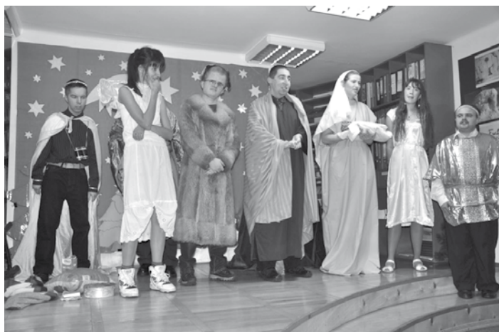
Przedstawienie w wykonaniu osób niepełnosprawnych