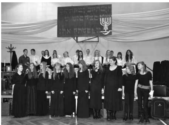
Uczniowie biorący udział w projekcie