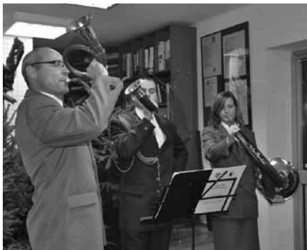
Koncert zespołu sygnalistów „Hreczecha”

W dalszej kolejności gość biblioteki, Łowczy Okręgowy PZŁ