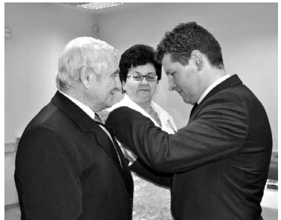
Wręczenie medali „Za długoletnie pożycie małżeńskie”