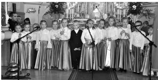
Grupa „Smerfy” z Kaniowa