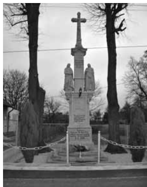
Krzyż przy ul. św. Floriana