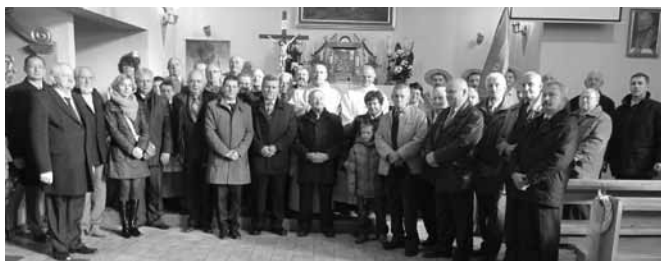
Pszczelarze i ich goście w kościele w Bestwinie

10 listopada w kościele parafialnym pw. św. Sebastiana w Bestwinie na Mszy świętej z okazji święta swojego patrona, św. Ambrożego, spotkali się członkowie Gminnego Koła Pszczelarzy i zaproszeni goście. Było to podziękowanie za cały rok wyężonej pracy w pasiekach, jak i modlitwa o dobre miodobranie w kolej-