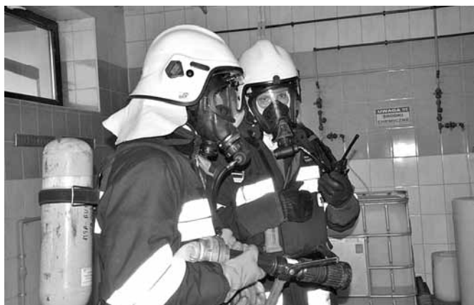
Strażacy podczas ćwiczeń

Groźny pożar wybuchł już w styczniu 2012 r. Na terenie zakładu „Nicromet” palili się pył aluminiowy, który trzeba było gasić proszkami gaśniczymi. Pożar ten wygenerował poważne straty,