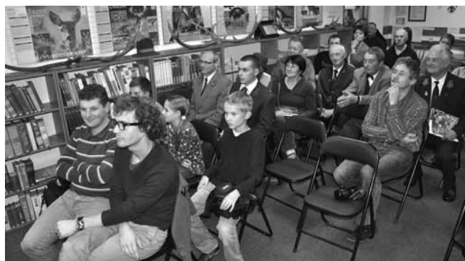
Goście spotkania z myśliwymi