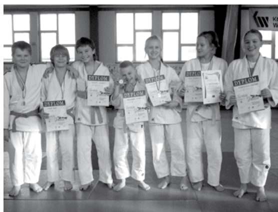
Młodzi dżudocy i ich medale

8 grudnia w Bytomiu rozegrano kolejny rzut Otwartych Mistrzostw Miasta Bytomia dzieci w judo. W ostatnich tego-rocznych zawodach świetnie zaprezentowali się najmłodszy reprezentanci Klubu Sportowego Judo Czechowice-Dziedzice.