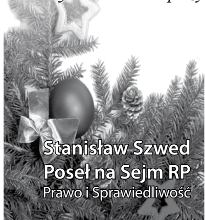
Stanisław Szwed Poseł na Sejm RP Prawo i Sprawiedliwość

Mieszkańcom Gminy Bestwina życzę, aby Nowy 2013 Rok obdarzył nas zdrowiem, pokojem i radością.