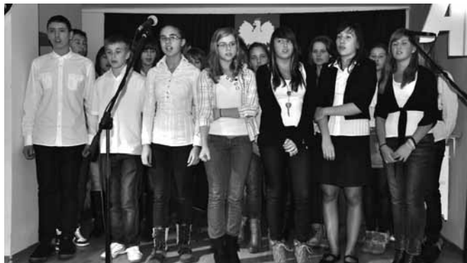
„Bel Canto” - Zdobywcy Grand Prix

Liczba około 240 uczestników ze wszystkich gminnych placówek oświatowych świadczy o poważnym podejściu do sprawy patriotyzmu. W sytuacji, gdy dorośli często wstydzą się gestu wywieszenia flagi, dzieci i młodzież przyczepiają sobie narodowe kokardy i wychodzą na scenę. O należyte przygotowanie muzyczne troszczą się nauczyciele i instruktorzy, wysoki poziom wykonania widać zresztą co roku.