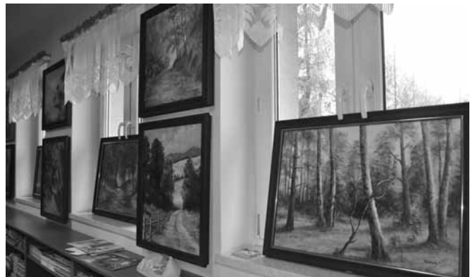
Obrazy T. Noworyty na wystawie w bibliotece