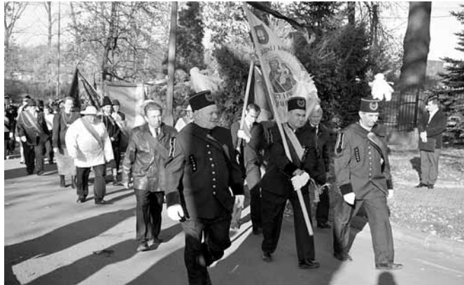
Uroczysty pochód - poczty sztandarowe

Po zakończonej celebracji zebrani wysłuchali koncertu laureatów XIII Przeglądu Pieśni Patriotycznej. Następnie w uroczystym pochodzie przy dźwiękach orkiestry przeszli pod pomnik przy Urzędzie Gminy. Tam wysłuchali krótkiej refleksji na temat uniwersalnych wartości i wreszcie przystąpili do składania