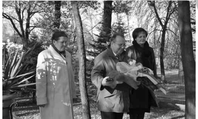
Składanie kwiatów pod pomnikiem