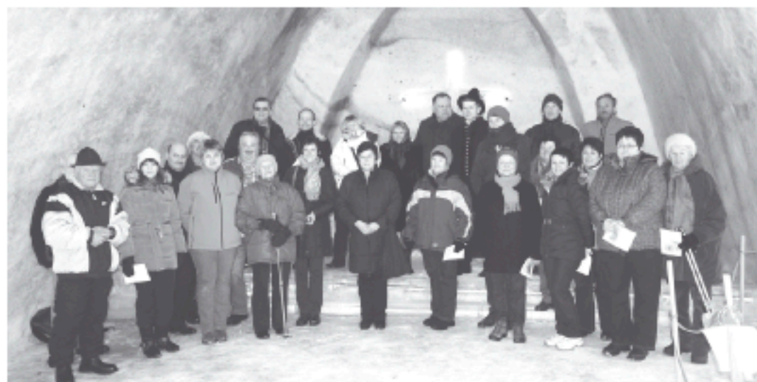
Nasza delegacja w „Śnieżnym Kościele”