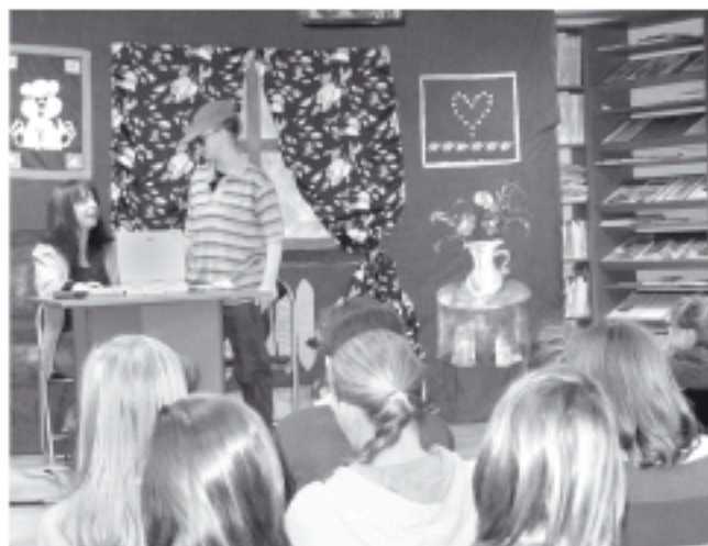
Zajęcia na temat bezpieczeństwa w sieci

Przedstawienie to miało na celu uświadomienie uczniom, że wolność słowa, nie oznacza braku odpowiedzialności za ich wypowiedziane; pokazanie, że anonimowość w sieci nie daje prawa do obrażania i poniżania innych; groźba, nawet zamieszczona w Internecie również jest formą przemocy, która podlega karze prawnej. Młodzi ludzie poznali, że mimo pozornej anonimowości, policja może ustalić na podstawie adresu IP,