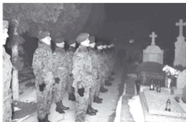
Uroczystości z udziałem strzelców

Teraz i Ty możesz zostać jednym z nas! Jeżeli masz ukończone 13 lat i chcesz zasmakować wojskowej przygody – zgłoś się do naszej jednostki strzeleckiej. Szczegóły na naszej stronie internetowej : www.czechowice.sopg.pl . Szukaj nas także na Facebooku : Jednostka Strzelecka 3028 Czechowice-Dziedzice.