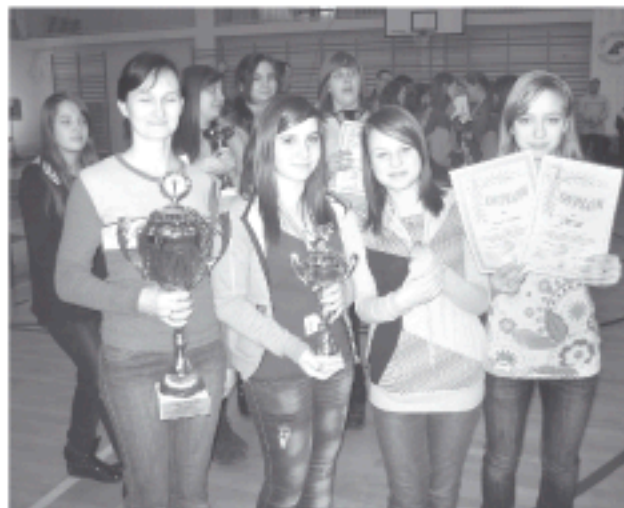
Medalistki z bestwińskiego Gimnazjum