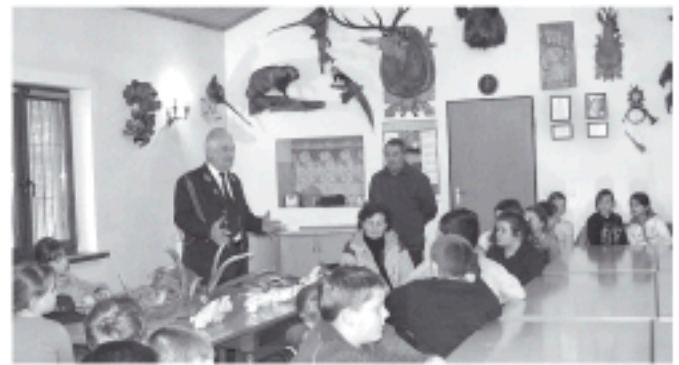
Lekcja z myśliwymi