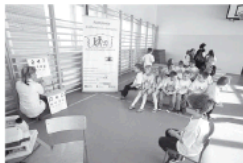
Spotkanie z lekarzem

Ruszyła Kampania Profilaktyczno - Edukacyjna „Szkoła Zdrowego Widzenia”, której uroczysta inauguracja odbyła się w ZSP Janowice! Badanie wzroku przeprowadzane jest wśród pierwszoklasistów całego powiatu bielskiego, a nasze pierwszaki mogły jako pierwsze się przekonać, że takie sprawdzanie wzroku jest całkowicie bezbolesne i bardzo potrzebne. W trosce o zdrowie swoich dzieci wszyscy rodzice wyrazili zgodę