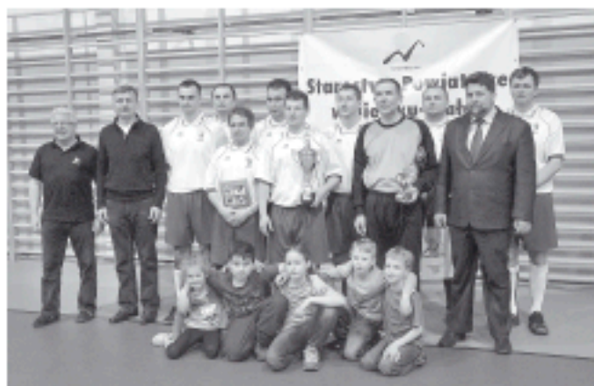
Drużyna gminy Bestwina z wywalczonym trofeum