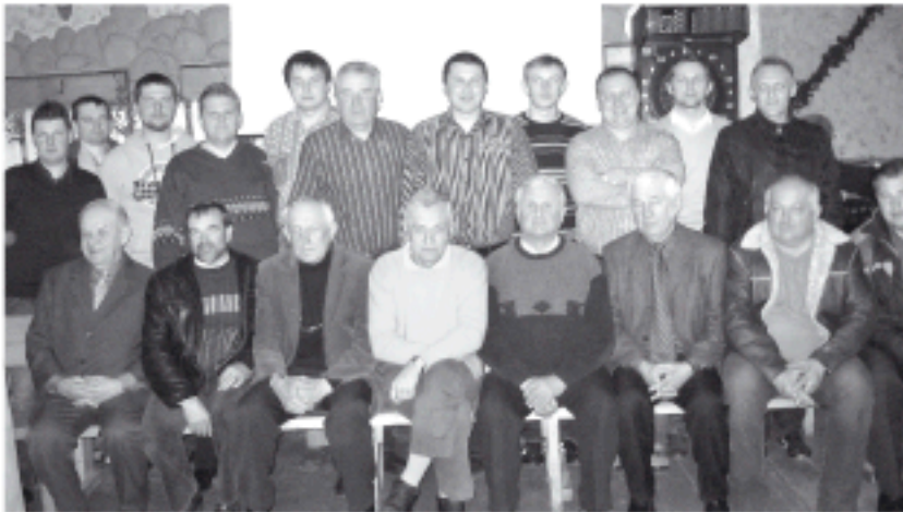
Członkowie i sympatycy KS Bestwinka