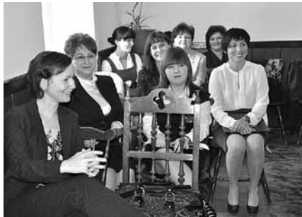
Nagrodzeni i awansowani nauczyciele

Radny Andrzej Wojtyła : 1. Poprosił o zamieszczenie w Magazynie Gminnym informacji o nowych regulacjach w sprawie ustawy o utrzymaniu czystości i porządku w gminach (artykuł znajduje się w numerze 8/2011). 2. Poprosił o usunięcie znaku ograniczenia prędkości na ul. Kościelnej.