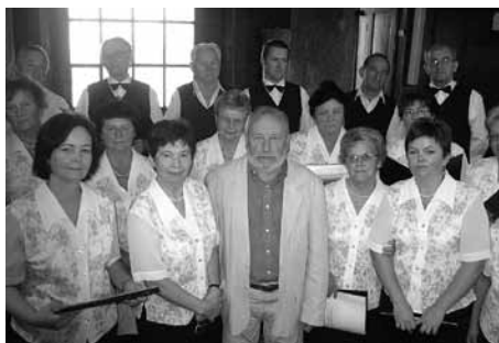
Chór „Ave Maria”