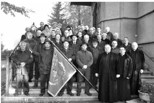
Pamiętkowa fotografia po Mszy Świętej