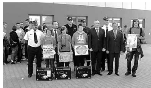
Pamiątkowe zdjęcie z konferencji