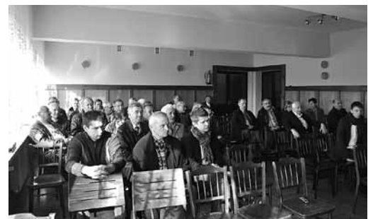
Zebranie wiejskie w Bestwinie

Wykopanie rowu odwadniającego wzdłuż ul. Leśnej, odprowadzającego wody opadowe do potoku Podleśnego. 8. Wyregulo-