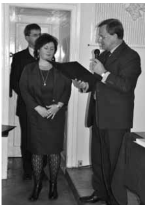
Wręczenie nagród Wójta

7. Zatwierdzenia Programu Współpracy z Organizacjami Pozarządowymi oraz Podmiotami wymienionymi w art. 3. ust. 3 Ustawy o działalności pożytku publicznego i o wolontariacie na 2012 rok.