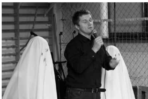
Lekcja muzyki w Kaniowie

paleta przebojów, hitów, piosenek od „Smells like teen spirit” Nirwany po ... „Brunetki, blondynki” Jana Kiepury, wszystkie w oryginalnych aranżacjach wokalnych.