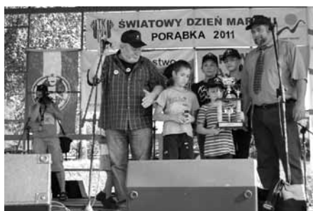
Wręczenie pucharu dla najliczniej reprezentowanej gminy

najliczniej reprezentowanej gminy. Grupa z naszej gminy liczyła 186 osób, a najliczniej zgromadzili się uczniowie z Bestwiny. Uczniowie wraz z nauczycielami przeszli szlak z Bujakowa do Wzgórza Wolek, dalsza trasa wiodła przez Zbocza Bujakowskiego Gronia, Zasolnicę aż do centrum Porąbki. Na mecie dzieci otrzymały okolicznościowe znaczki, dyplomy i zjadły przygotowaną przez organizatorów grochówkę. Brawa dla wszystkich nauczycieli uczestniczących w rajdzie za mobilizację tak dużej grupy dzieci i swój własny przykład.