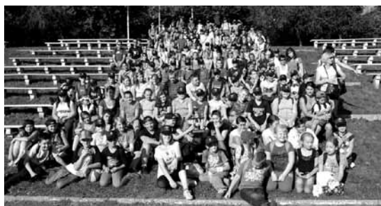
Rajdowcy na wspólnym zdjęciu