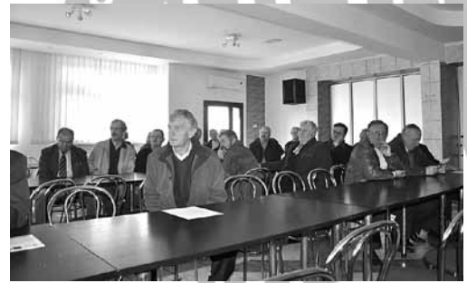
Zebranie wiejskie w Janowicach

oraz oczyszczenie chodników przydrożnych. 5. Naprawa mostku na ul. Pszczelarskiej. 6. Wykonanie udrożnienia części ul. Miodowej. 7. Wykonanie rowu przy ul. Pisarzowickiej oraz wycięcie krzewów. 8. Naprawa dziur na ul. Górskiej. 9. Udrożnienie rowu przy ul. Szkolnej. 10. Wzmocniona kontrola prędkości samochodów ciężarowych na ul. Janowickiej. 11. Kontrola oświetlenia drogowego podczas zapalania i umieszczenie znaku „ustęp pierwszeństwa przejazdu” na ul. Szkolnej i Podleskiej. 12. Naprawa ul. Łanowej. 13. Udrożnienie rowów przy ul. Targanickiej.