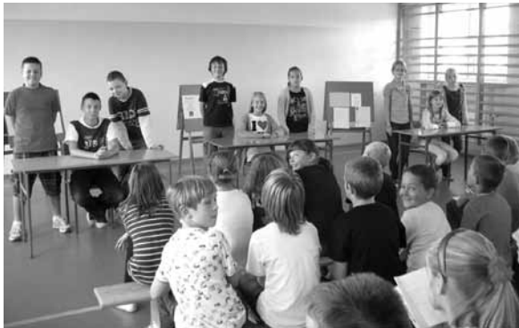
Kandydaci, ich sztaby i wyborcy