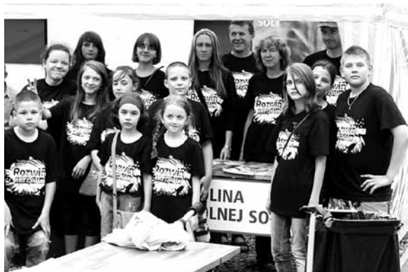
Zdjęcie uczestników projektu

Częścią projektu była wystawa fotograficzna „Ptaki”, którą można było oglądać do końca września w bibliotece w Bestwinie. Autorzy to Darek i Sebastian Czernek – animatorzy przyrodniczy OTOP.