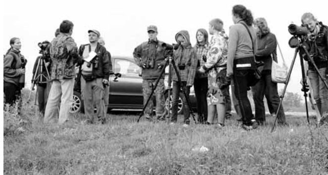
Zajęcia w terenie