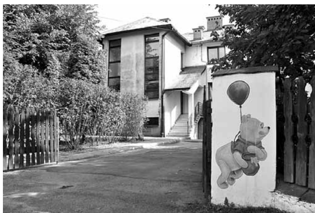
Ogrodzenie przedszkola zdobią postacie z bajek