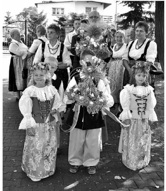
Delegacja mieszkańców Kaniowa

– Tak się szczęśliwie złożyło, że przyszło nam Cię powitać w naszej parafii na mszy dożynkowej. Witamy Cię, jak prawdziwego gospodarza, chlebem i solą oraz owocami naszych plonów. Wszak i Ty będziesz tutaj siewcą ziarna prawdy, ewangelii i miłości.