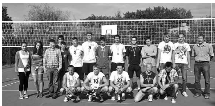
Uczestnicy i organizatorzy zawodów