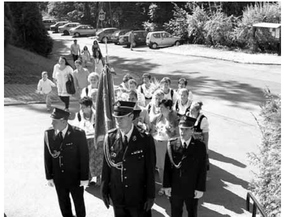
Uroczystości dożynkowe w Bestwinie