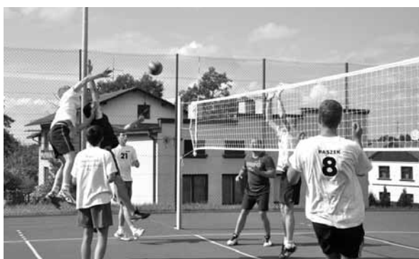
Nie brakowało spektakularnych zagrań