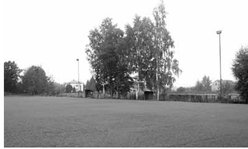
Nawierzchnia - stan obecny