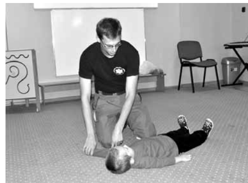
Pokaz pierwszej pomocy

Nasze przedszkole zgodnie z założeniami projektu będzie funkcjonować przez dwa lata. Taki jest zresztą średni czas pobytu dziecka w tego typu placówce. W tym czasie rodzice będą mieli czas na zastanowienie się, co dalej. Do nich należy podjęcie decyzji czy chcą kontynuacji tej formy zajęć