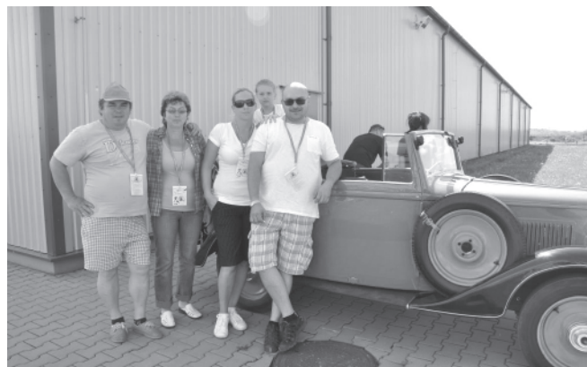
Goście ze Słowacji