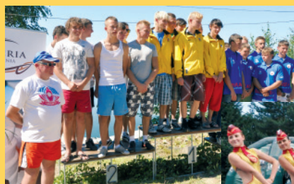
Zawodnicy z Kaniowa na trzecim stopniu podium