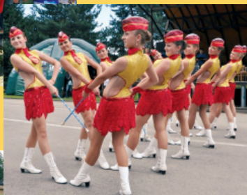
Rewia Orkiestr Dętych - występ mażorettek