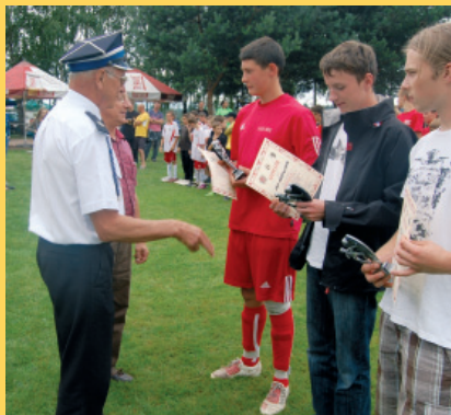
Turniej OSP w piłkę nożną