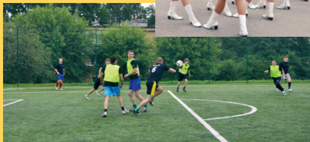
Turniej Firm w Bestwinie