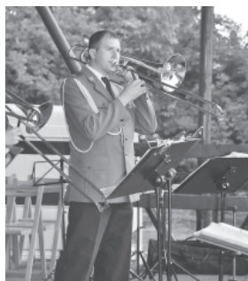
Muzyk z Oddziału Prewencji Policji w Katowicach