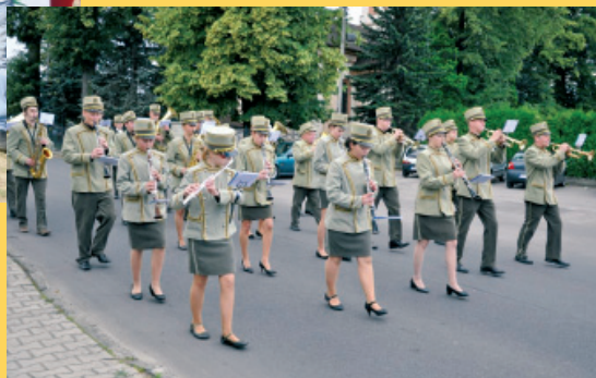
Międzygminna Rewia Orkiestr Dętych