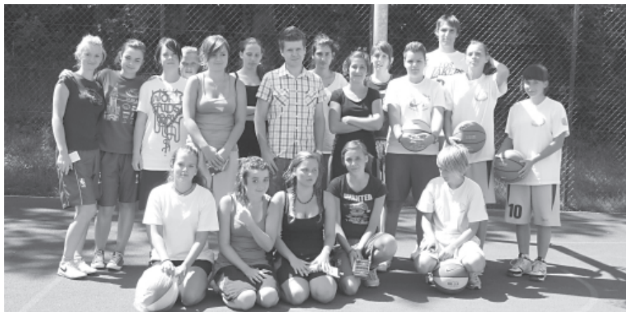
Zawodniczki wraz z organizatorem