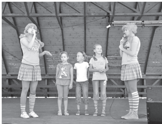
Przedstawienie dla dzieci