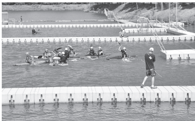
Tym razem pogoda sprzyjała zawodnikom

Przez dwa dni, tj. 20 i 21 sierpnia, na akwenie Żwirownia w Kaniowie odbywały się XI Mistrzostwa Polski Juniorów i VIII Mistrzostwa Polski Juniorów Młodszych w Kajak Polo. Dopisała pogoda, ale nie dopisali widzowie, zwłaszcza miejscowi, a przecież to jedyne zawody tej rangi w naszym regionie.