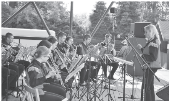
„Con Fuoco Band”