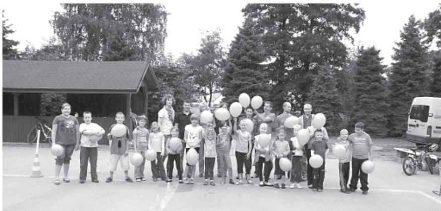
Uczestnicy i organizatorzy pikniku

30 lipca po raz kolejny świetlica środowiskowa „SŁONECZKO” zaprosiła dzieci na piknik, tym razem był to „Piknik pod chmurką”, który odbył się terenach rekreacyjnych w Kaniowie (poprzednio z racji niekorzystnej aury bawiliśmy się w budynku Szkoły Podstawowej).