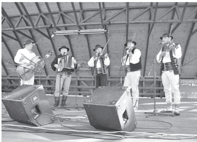
Kapela „Ondraszki” ze Szczyrku