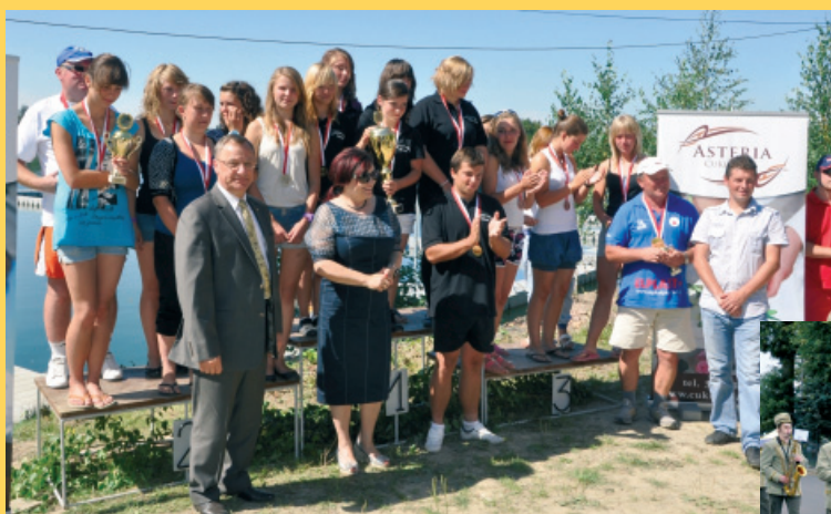
XI Mistrzostwa Polski Juniorów i VIII Mistrzostwa Polski Juniorów Młodszych w Kajak Polo