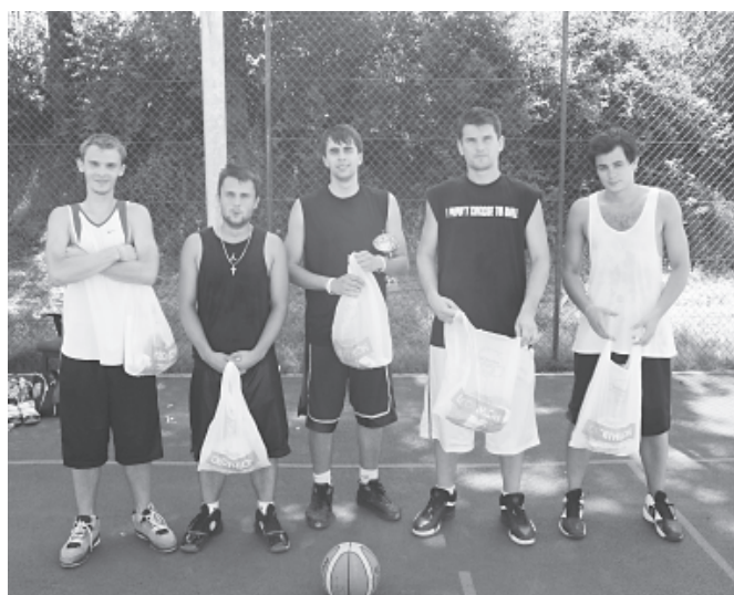
Zmęczeni, ale szczęśliwi

W niedzielę, 17 lipca, na obiekcie sportowym „Orlik 2012” w Bestwinie odbył się I Turniej Koszykówki Ulicznej o „Puchar Orlika”. Wzięło w nim udział 50 zawodników w 10 drużynach. Wysoki poziom turnieju gwarantował status grających zawodników, w większości zrzeszonych w Bielskiej Lidze Koszykówki. Rywalizacja toczyła się w dwóch grupach, każda liczyła 5 zespołów. Od pierwszego gwizdka sędziego wiadomo było, że gra idzie o wysoką stawkę, bo tylko po 2 najlepsze zespoły z obu grup miały awansować do półfinałów.