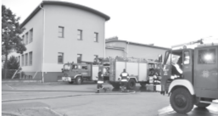
Ćwiczenia przy szkole w Janowicach

Na potrzeby ćwiczeń zasymulowano sytuację, że Miejskie Stanowisko Kierowania PSP w Bielsku-Białej odebrało zgłoszenie pożaru budynku szkoły w Janowicach. Nastąpił tam prawdopodobnie wybuch butli z gazem. Sytuację komplikował fakt, że na szkolnym dachu pracowali robotnicy.