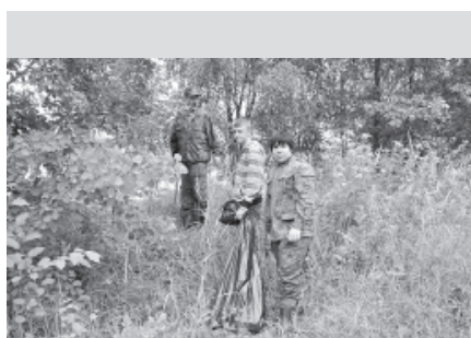
Wędkarze sprzątają wokół akwenów