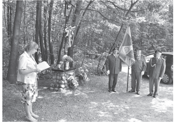
Uroczystości przy partyzanckim krzyżu