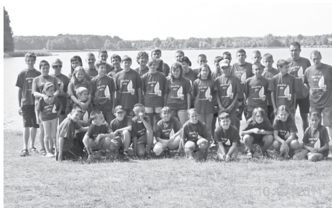
Uczestnicy obozu wraz z opiekunami