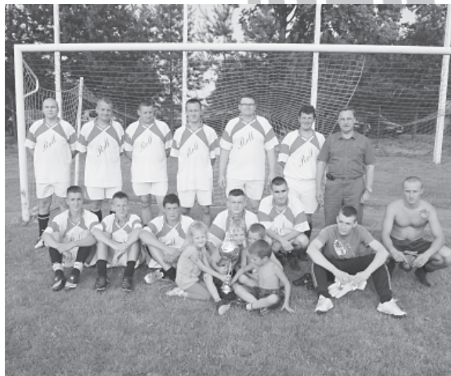
Zwycięska drużyna OSP Kaniów