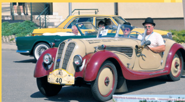
Międzynarodowy Rajd Pojazdów Zabytkowych