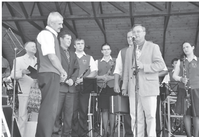
Podziękowanie dla orkiestry z Tarnowskich Gór

Duże wyrazy uznania należą się wszystkim, którzy przyczynili się do tego, by rewia mogła się odbyć. Oprócz KKSIR i