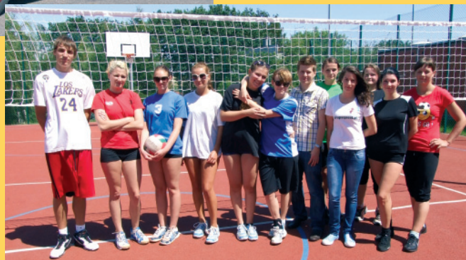
"Babskie Granie" - Turniej na Orliku