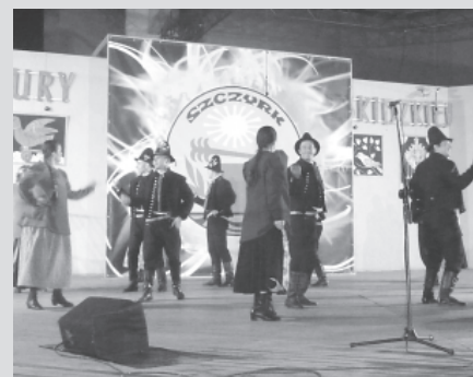
Zespół „Bestwina” na scenie

Przy okazji warto zaznaczyć, że kolekcja trofeów „Bestwiny” stale się powiększa – 3 lipca Zespół zajął I miejsce w 44 Wojewódzkim Przeglądzie Wiejskich Zespo-