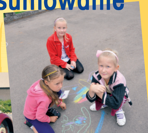
"Piknik pod chmurką" w Kaniowie