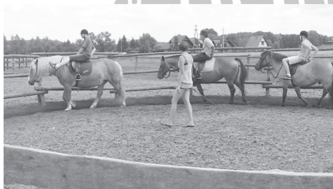
Nauka jazdy konnej