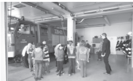
Młodzieżowa Drużyna Pożarnicza zapoznaje się ze sprzętem strażackim.