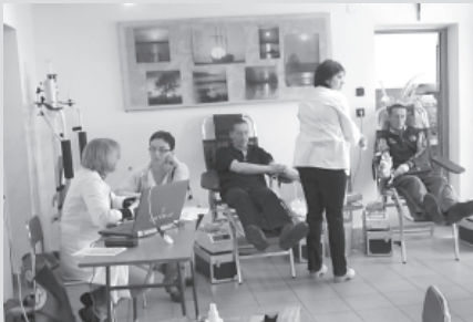
Mieszkańcy jak zawsze licznie oddawali krew.