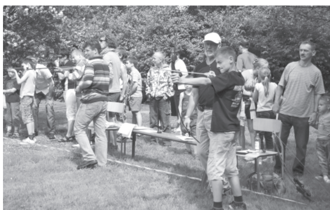
Strzelanie z łuku - jedna z konkurencji

„Wspaniała przygoda”, „świetna zabawa”- to słowa, którymi można opisać tegoroczny Rodzinny Dzień Radości, który odbył się 11 czerwca b.r. na terenach rekreacyjnych w Kaniowie. Aura dopisała na równi z uczestnikami.