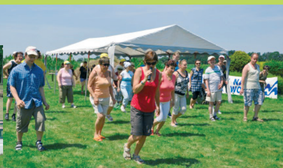
Integracyjny piknik z "Razem"