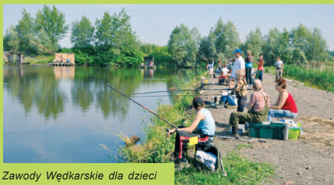
Zawody Wędkarskie dla dzieci