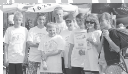
Team 97 - najliczniejsza grupa biorąca udział w rajdzie