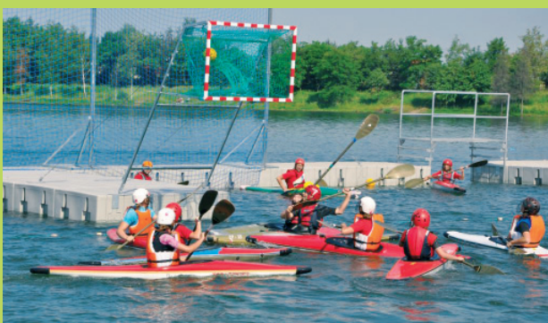
Międzynarodowy Turniej Kajak Polo

P.H.T. Teleradiosat Bogusław Stolarczyk Naziemna Telewizja Cyfrowa w Czechowicach-Dziedzicach