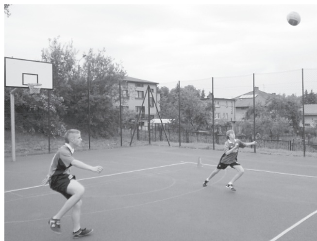
Walka o cenne punkty