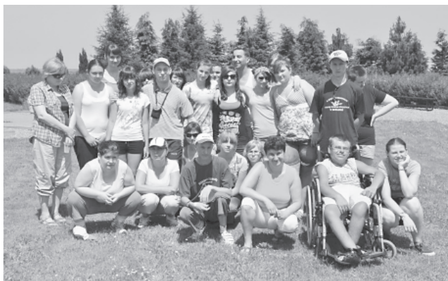
Uczestnicy imprezy oraz wolontariusze z gimnazjum