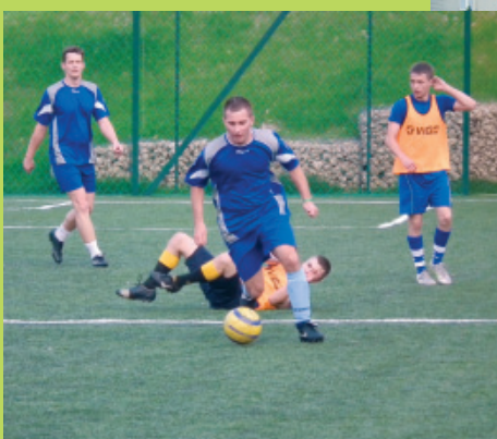
Amatorska Liga Orlika