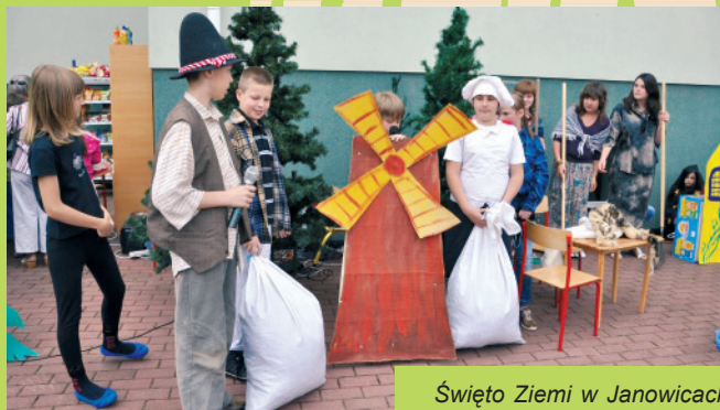
Święto Ziemi w Janowicach