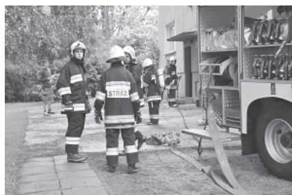
Ćwiczenia gminnych jednostek OSP