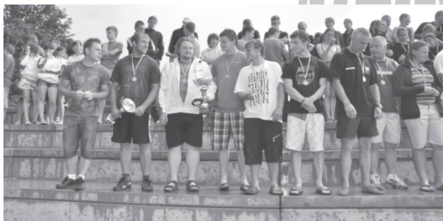
Rozdanie nagród dla zwycięzców zawodów