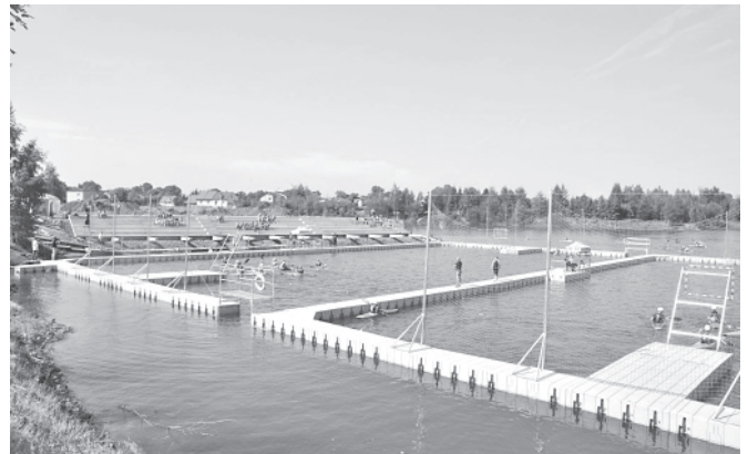
Budowany Ośrodek Sportów Wodnych

Podczas wizji zapoznano się z kolejnym etapem inwestycji. Wykonane są już konstrukcje pod trybuny, na których będą montowane krzeselka. Na plac budowy dostarczono już także elementy do pomostów pływających. Stare pomosty, zalane wodą zostały już usunięte ze zbiornika. Wylane zostały funda-