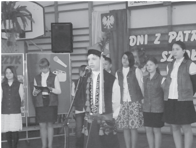
Dni z patronem szkoły w Kaniowie

Do ceremoniału Szkoły Podstawowej im. Tadeusza Kościuszki w Kaniowie należą przeprowadzane rocznie Dni z Patronem Szkoły.