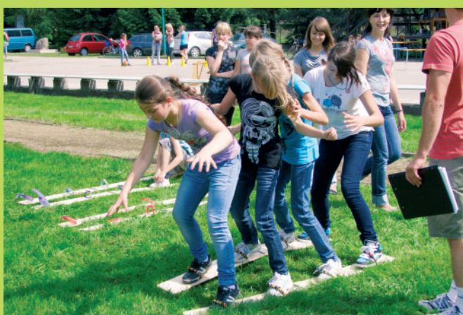
Dzień Radości w Kaniowie