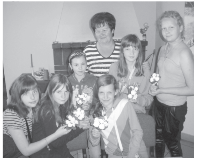
Uczestniczki zajęć w Muzeum i ich prace