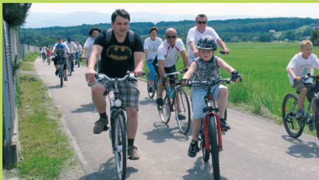
VI Janowicki Rajd Rowerowy