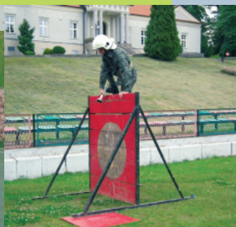
Zawody sportowo - pożarnicze