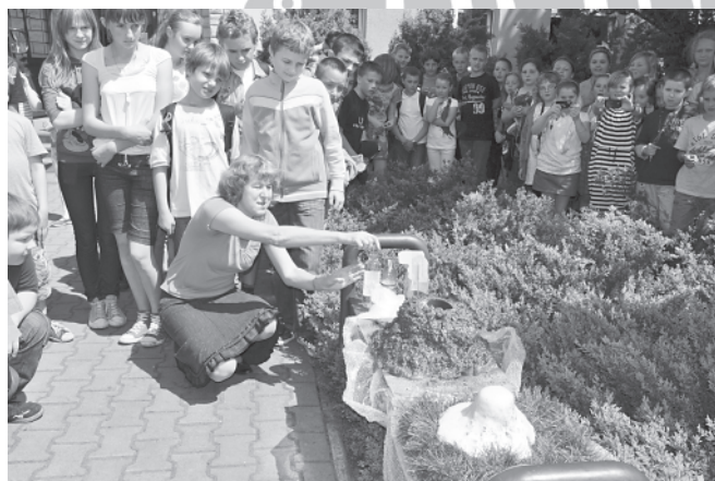
Doświadczenie chemiczne - wybuch wulkanu