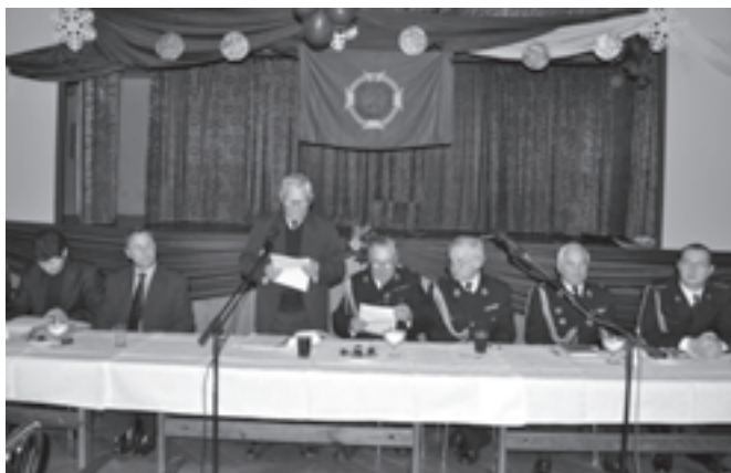
Walne zebranie OSP Bestwinka

Godna docenienia jest działalność długoletnich członków straży, szczególnie tych, którzy otrzymali członkostwo honorowe i odznaczenia stażowe. Nie należy jednak zapominać o młodzieży biorącej udział w zawodach pożarniczych i konkursach wiedzy. Strażacy ponadto obsługują uroczystości gminne, prowadzą działalność edukacyjną, pojawiają się w