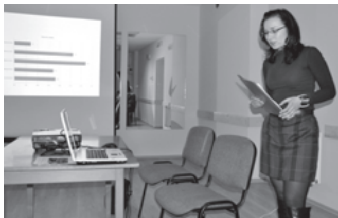
Prezentacja wyników badań społecznych przeprowadzonych w gminie Bestwina

Ważnym wyznacznikiem materialnego wymiaru życia rodzin jest także odniesienie się do zadłużenia mieszkańców w bankach, instytucjach finansowych czy u znajomych. Jak wskazują wyniki badań, prawie co trzeci ankietowany (32%) w ciągu minionego roku skorzystał z pożyczki/kredytu w banku lub instytucji finansowej, z czego 12% uczyniło to nawet kilka razy. Nieco mniej chętnie sięgano po pomoc znajomych, 11% ankietowanych z takiej pomocy skorzystało kilkakrotnie. Taki sam procent badanych zaciągnął pożyczkę u znajomych tylko raz. 68% respondentów w minionym roku nie korzystało z pomocy żadnych instytucji finansowych, 78% natomiast nie zaciągnęło zobowiązań wobec swoich znajomych.