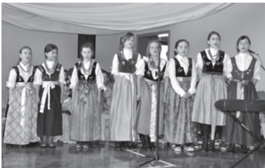
Utalentowane uczennice ZSP Bestwina

Takiej imprezy jeszcze nie było! 26 lutego 2011 r. uczniowie i nauczyciele ze Szkoły Podstawowej im. św. Jana Kantego w Bestwinie wykorzystali wszystkie możliwe środki, aby zorganizować jedyny w swoim rodzaju pokaz pod nazwą „Mam Talent”. Jednak w odróżnieniu od telewizyjnego pierwowzoru nikt z uczestników nie został odrzucony przez jury, każdy mógł zaprezentować gościom swoje umiejętności oraz zainteresowania.