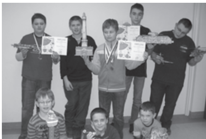
Nagrodzeni modelarze z sekcji "Samuraj"

Rozpoczyna się kolejny rok imprez modelarskich. W tym roku koło modelarskie „SAMURAJ” działające przy Centrum Kultury, Sportu i Rekreacji w Bestwinie zdecydowało się zaprezentować swoje dotychczasowe prace na Konkursie Modelarskim w Brnie. Impreza odbyła się w dniach 11 - 12.02.2011, w Centrum