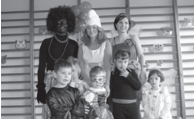
Zabawa karnawałowa w przedszkolu

ci uśmiechnięte od ucha do ucha uczestniczyły w wesołej zabawie oraz konkursach.