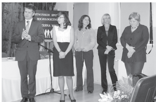
Organizatorzy i prelegenci Bestwińskich Spotkań Socjologicznych