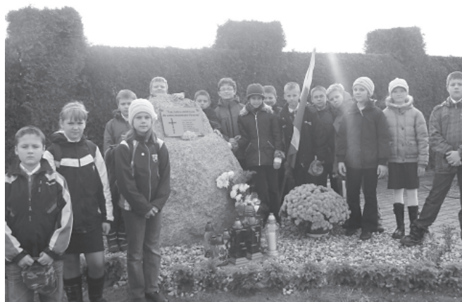
Uczniowie z Bestwinki przy pomniku

W przeddzień Święta Niepodległości uczniowie klasy IV Szkoły Podstawowej w Bestwinie złożyli kwiaty i zapalili znicze na