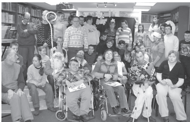
Aktorzy z gimnazjum wraz z podopiecznymi ŚDS "Centrum"

Wzorem lat ubiegłych w czytelni GBP młodzież z Gimnazjum im. Jana Pawła II wystawiła bardzo ciekawy spektakl z dużą ilością humoru i piosenek. Przedstawienie to przygotowane zostało z myślą o osobach niepełnosprawnych intelektualnie,