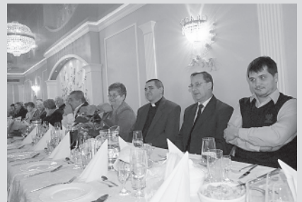
Goście spotkania barbórkowego