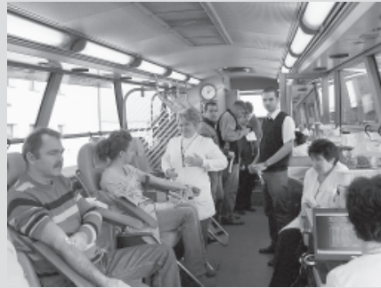
Akcja krwiodawstwa w Janowicach