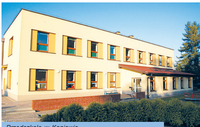
Przedszkole w Kaniowie

Wiele inwestycji przeprowadziliśmy w budynkach szkół i przedszkoli w naszych sołectwach.