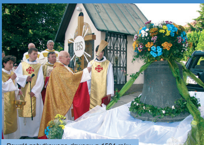
Powrót zabytkowego dzwonu z 1504 roku