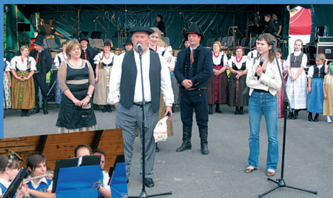
Goście z miasta Berango w Kraju Basków