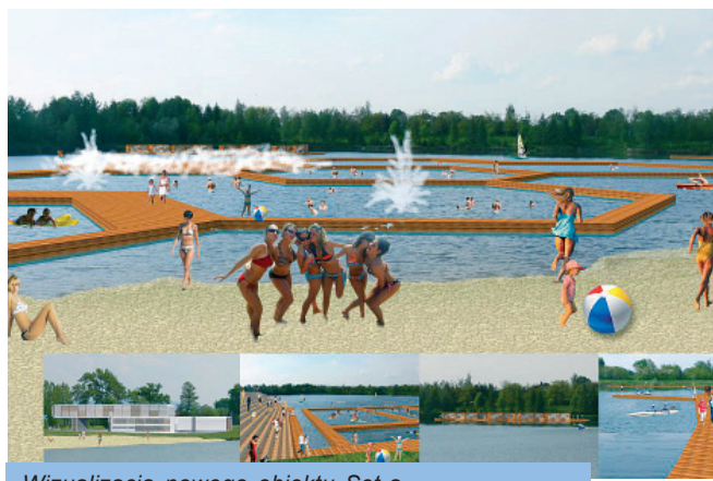
Wizualizacja nowego obiektu Set-a

W chwili, gdy pojawiła się możliwość pozyskania środków na rekultywację terenów zdegradowanych, z możli-