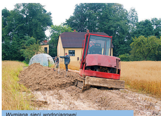
Wymiana sieci wodociągowej

Koszt tych inwestycji to około 2 400 000 zł., z tego 1 600 000 zł. to środki pozyskane ze źródeł zewnętrznych!