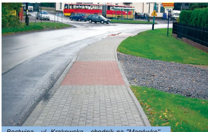
Bestwina - ul. Krakowska - chodnik na "Magówkę"

Poprawa bezpieczeństwa naszych mieszkańców to kolejny ważny cel, równoległy z inwestycjami drogowymi, dla wójta i Rady Gminy w mijającej kadencji. W tym czasie zostało wykonanych ponad dwa kilometry chodników i dojeżdż do przystanków.