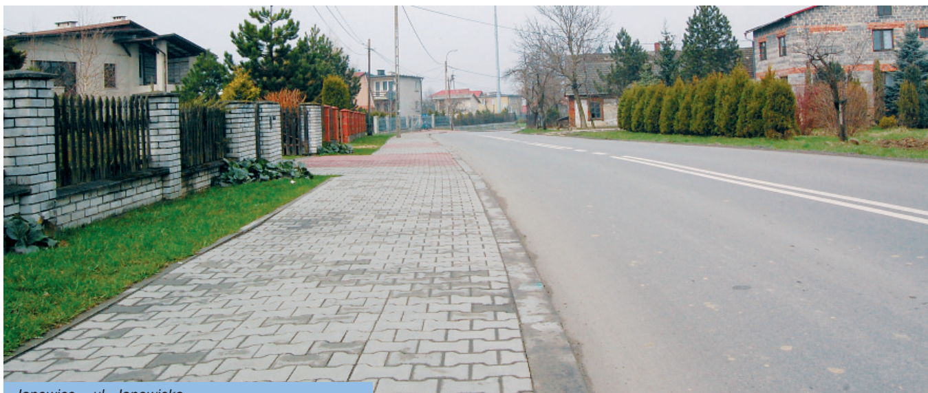
Janowice - ul. Janowicka

Zostaną również wykonane projekty na chodniki przy ul. Witosa od „spółdzielni” w kierunku ul. Młyńskiej, przy ul. Krakowskiej. W perspektywie dalszych lat na pewno sprawy bezpieczeństwa pieszych nie zostaną zapomniane i będziemy czynili dalsze starania o jego poprawę.