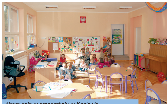
Nowa sala w przedszkolu w Kaniowie

Na bieżąco w naszych placówkach oświatowych przeprowadzane są bieżące remonty by jak najlepiej mogły służyć naszym dzieciom nie tylko podczas nauki ale także podczas wielu zajęć pozalekcyjnych. W szkołach odbywają się półkolonie, organizowane są wycieczki i rajdy, także wdrażanych jest wiele programów, na które pozyskiwane są fundusze zewnętrzne.