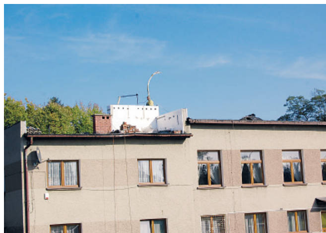
Dach Domu Sportowca w Bestwinie

Z budżetu Gminy poprzez Centrum Kultury finansowani są trenerzy drużyn i grup młodzieżowych (dotyczy to również trenerów kajak – polo i tenisa stołowego). Także poprzez Centrum Kultury kluby corocznie mogą zaopatrzyć się w niezbędny sprzęt sportowy.