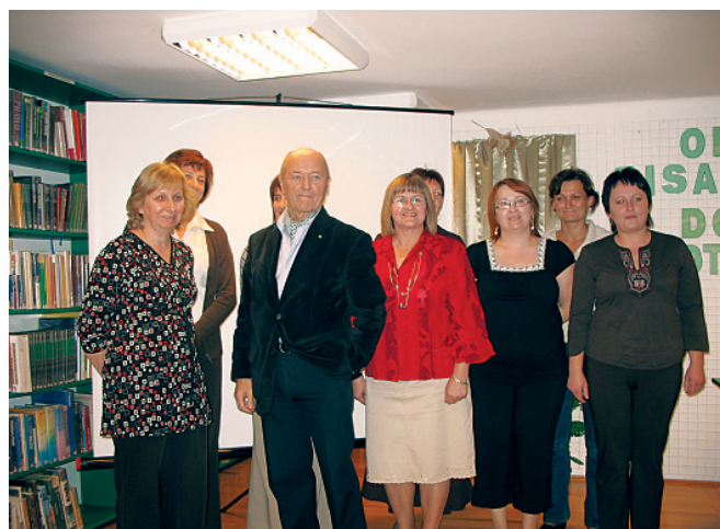
Z podróżnikiem Jackiem Pałkiewiczem