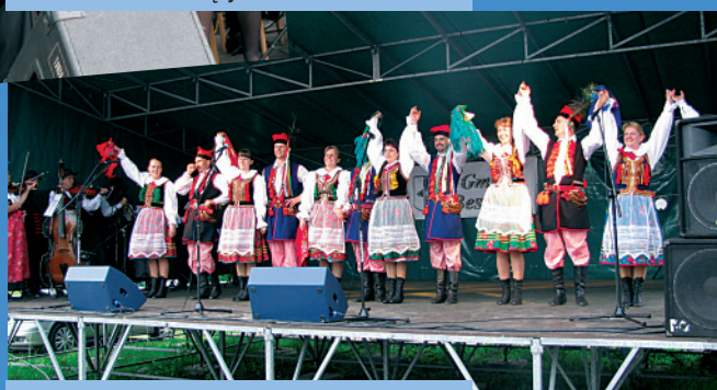
Zespół Regionalny "Bestwina"