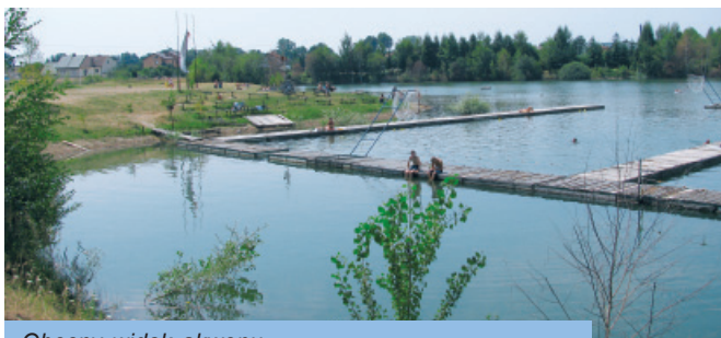
Obecny widok akwenu