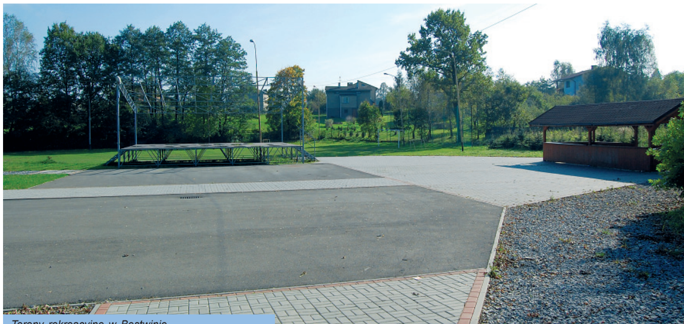
Tereny rekreacyjne w Bestwinie

Rozbudowa i doposażenie placów zabaw kosztowało 86 000 zł, w tym 31 000 zł to środki pozyskane z zewnątrz!