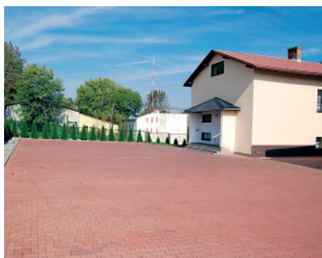
OSP Bestwinka - plac ćwiczeń

Z Urzędu Gminy zostało również częściowo dofinansowane wykonanie placu do ćwiczeń przy OSP Bestwinka, a także dofinansowana wymiana ogrzewania w budynku OSP Bestwinia i wymiana okien w siedzibie OSP Janowice.