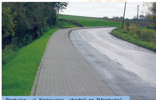
Bestwina - ul. Krakowska - chodnik na "Magówkę"

Koszt budowy chodnika to 1 200 000 zł z tego 500 000 zł to środki zewnętrzne !