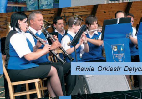
Rewia Orkiestr Dętych