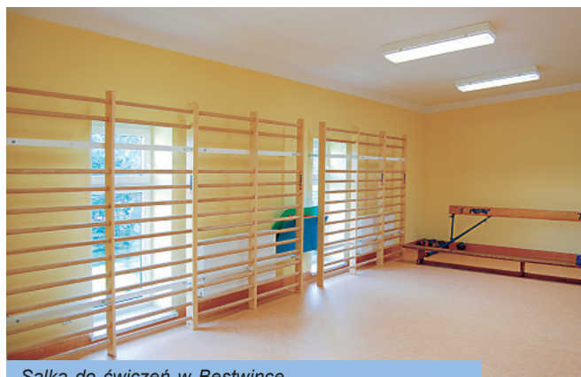
Salka do ćwiczeń w Bestwinie

W Janowicach rozpoczął się remont pomieszczeń po starym przedszkolu, w których już w następnym roku zajęcia będą miały dzieci z Janowic i pozostałych miejscowości naszej Gminy.