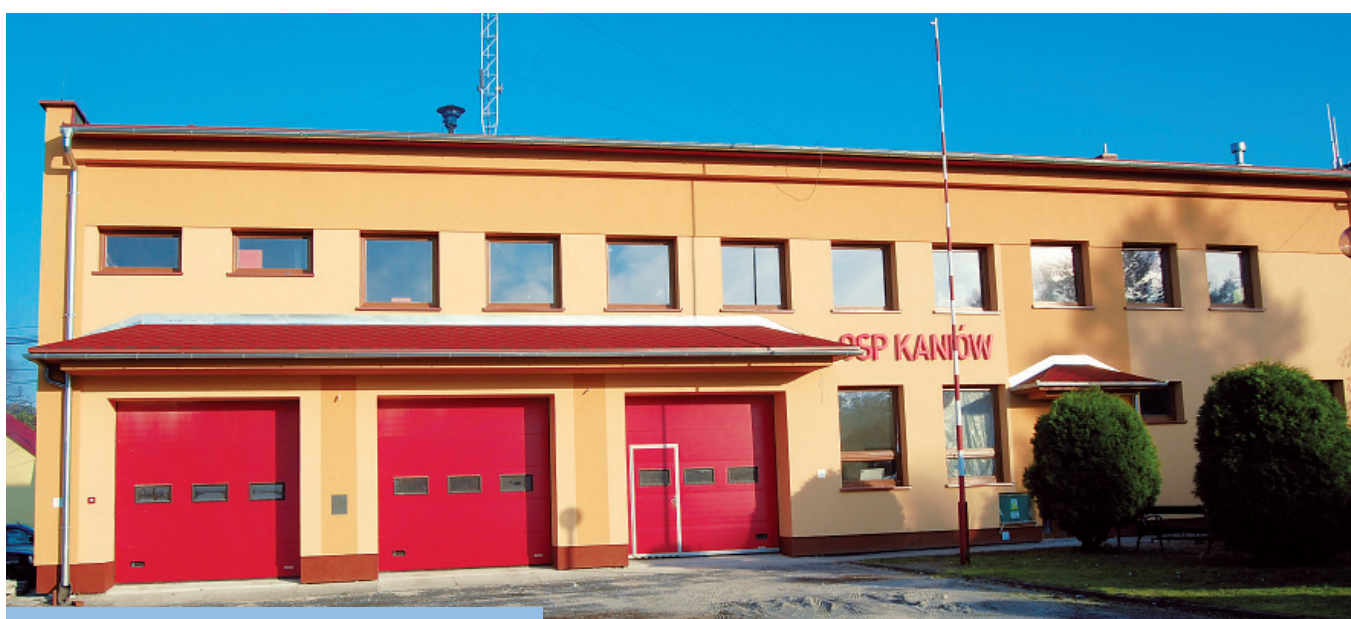
Strażnica OSP Kaniów