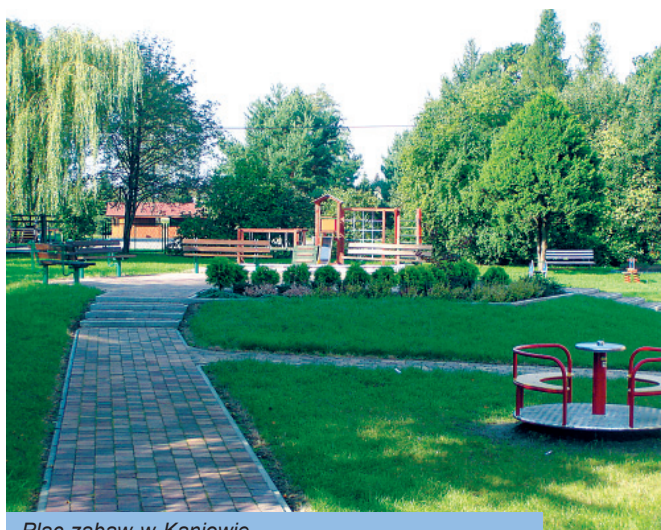
Plac zabaw w Kaniowie