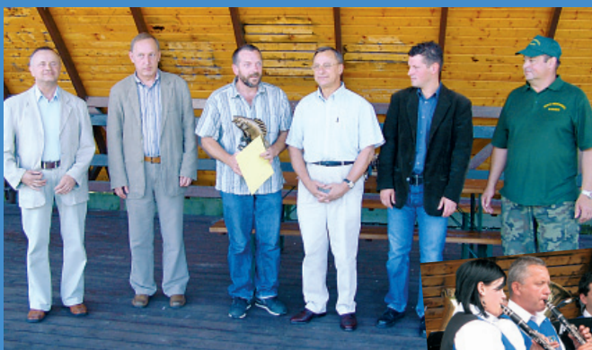
Święto Karpia Polskiego