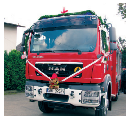
Samochód MAN dla OSP Bestwinia