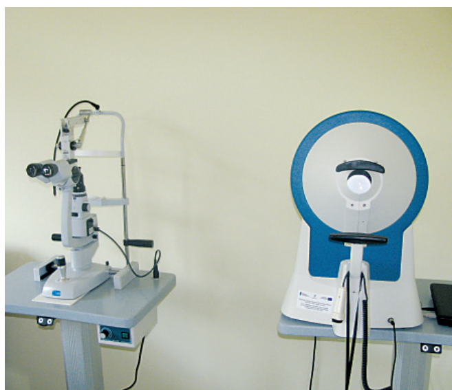
Nowy sprzęt okulistyczny

Już na kolejny rok jest planowane zagospodarowanie wokół terenu Ośrodka Zdrowia i budynków przyległych. Zostaną zwiększone powierzchnie parkingowe, poprawiona komunikacja, niewątpliwie poprawi się także estetyka wokół budynku Ośrodka.