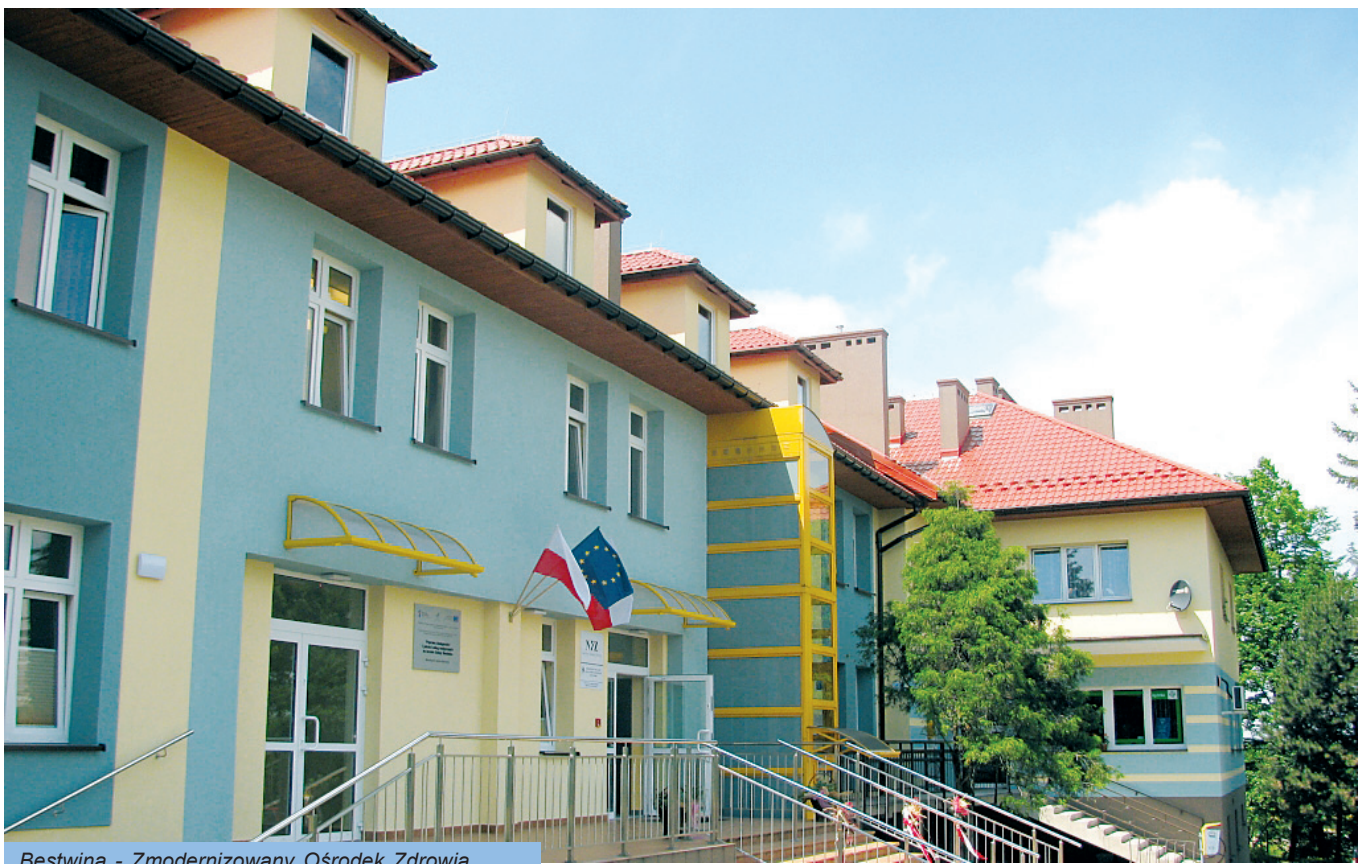
Bestwina - Zmodernizowany Ośrodek Zdrowia

Największą inwestycją obejmującą remont obiektu użyteczności publicznej była modernizacja i doposażenie Ośrodka Zdrowia w Bestwinie.