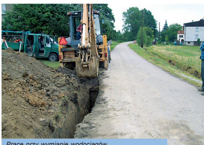
Prace przy wymianie wodociągów

Wymiana sieci wodociągowych z rur azbestowych na PCV, to oprócz budowy oczyszczalni ścieków i kanalizacji priorytet w działaniach proekologicznych obecnej kadencji.