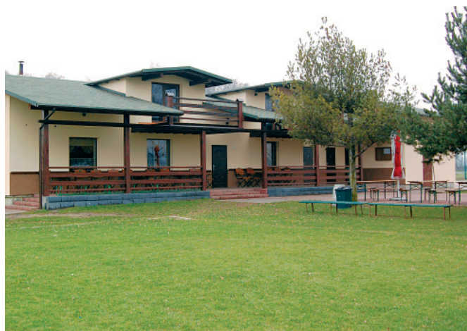
Budynek KS Bestwinka

Kwota inwestycji to 1 100 000 zł, a pozyskane dofinansowanie to 660 000 zł.