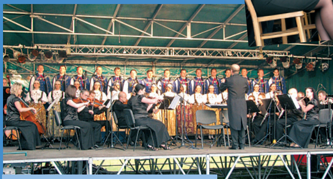
Występ zespołu "Śląsk"