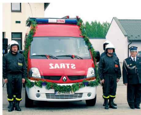
Nowy lekki wóz bojowy OSP Janowice