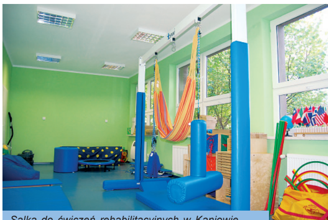
Salka do ćwiczeń rehabilitacyjnych w Kaniowie

W Kaniowie zostało wyremontowane przedszkole oraz w późniejszym czasie wyremontowano dodatkową salę dydaktyczną i salkę do ćwiczeń rehabilitacyjnych.