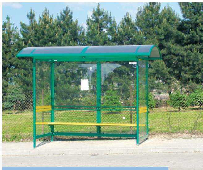
Jedna z nowych wiat przystankowych

W kolejnym roku dokończymy wymianę wiat przystankowych na terenie całej Gminy Bestwina.