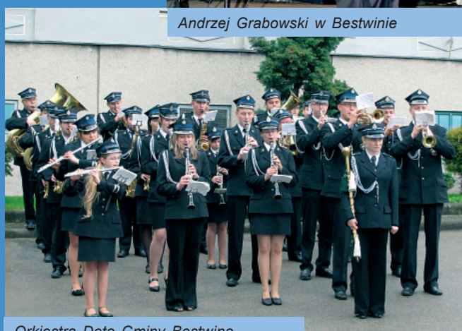
Orkiestra Dęta Gminy Bestwina