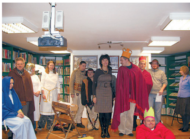
Jasełka w Bibliotece - występują podopieczni ŚDS "Centrum".

Stronę Biblioteki www.gbpbestwina.eu odwiedziło 74 500 Internautów.