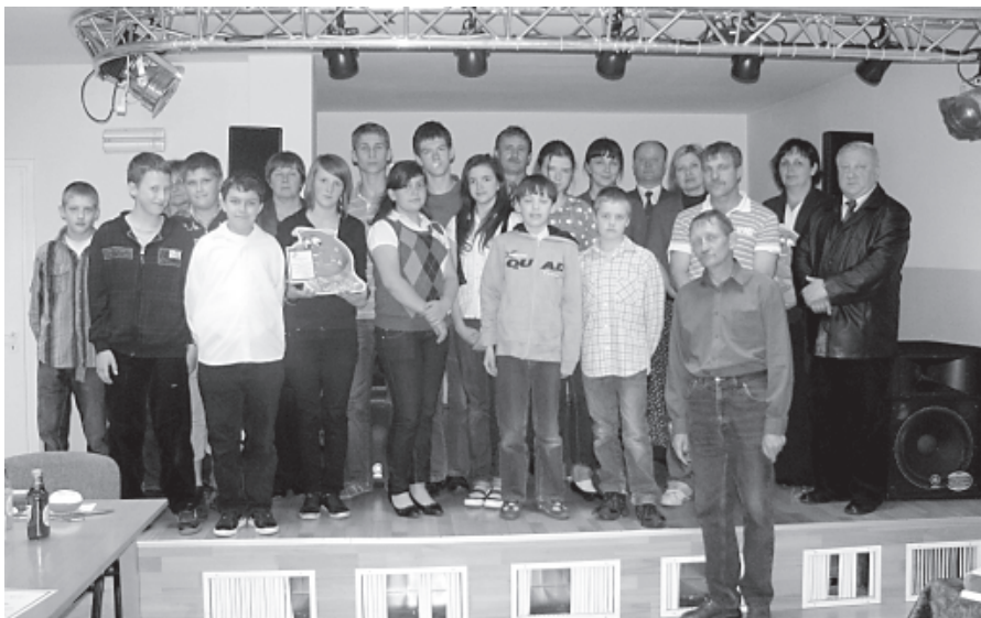
Uczestnicy konkursu wraz z organizatorami i jurorami

Tym płynem jest krew. Niezbędna dla funkcjonowania organizmu, zapatrująca go w tlen i składniki odżywcze. Jest zawsze potrzebna w leczeniu, podaje się ją podczas operacji oraz w różnych schorzeniach, m.in. w białaczkach. Krwi nigdy za wiele, dlatego też kluby Honorowych Dawców Krwi robią co mogą by rozpropagować ideę jej oddawania.