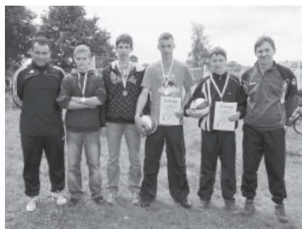
Medaliści i ich opiekunowie

Na jednym boisku grają dziewczęta, systemem „każdy z każdym”, a na drugim chłopcy, prowadzona jest klasyfikacja na najlepszą parę, a na podstawie tego rankingu dokonuje się podsumowania, które gimnazjum jest lepsze drużynowo. Ze względów technicznych, konieczność rozegrania 15 meczów na każdym z boisk, mecz trwa tylko dwa sety