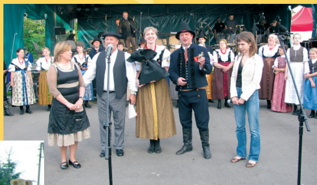
Dni Gminy Bestwina - życzenia od gości z Kraju Basków