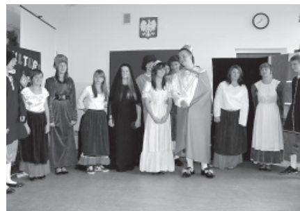
Uczniowie - uczestnicy projektu