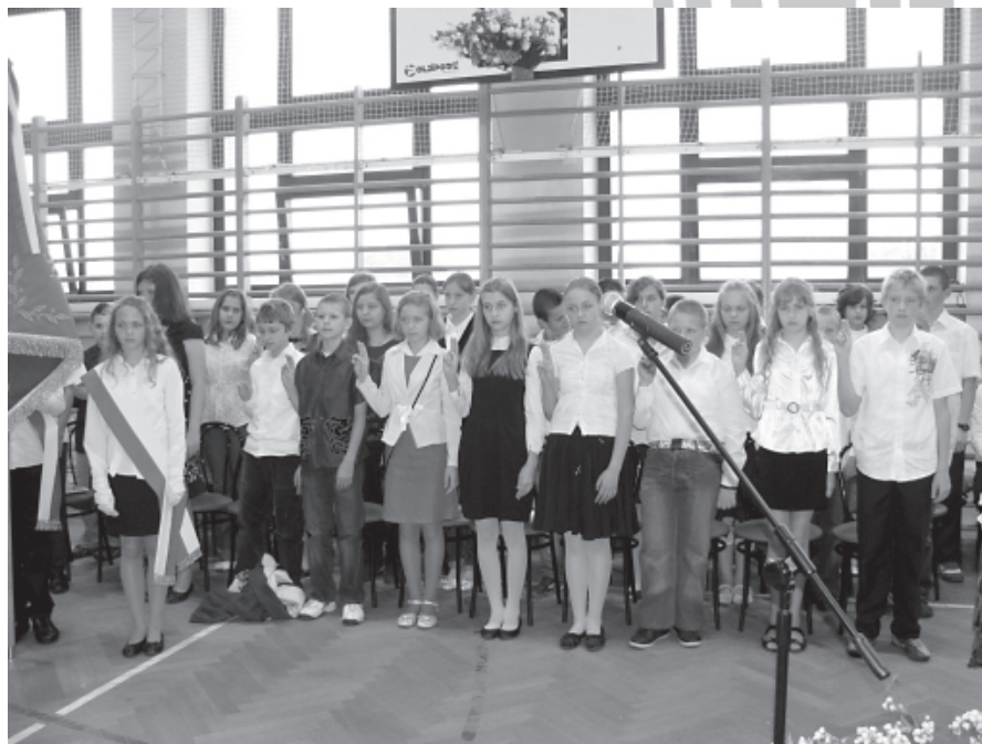
Pożegnanie klas szóstych