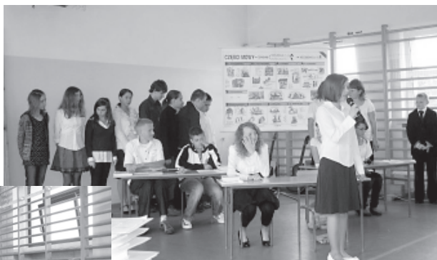
Akademia w Janowicach

kacje, życzymy im, by nawet pomimo ciężkich doświadczeń związanych z powodzią mogli nabrać sił. Po dwóch miesiącach znowu wrócą do klas, swoich nauczycieli i odnowionych szkół, które nieustannie się unowocześniają – został już rozstrzygnięty przetarg na boisko „Orlik 2010”, więc tym bardziej będzie chciało się spędzać czas z kolegami i koleżankami ze szkolnej ławki.