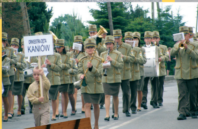
Maszeruje Orkiestra Dęta Gminy Bestwina