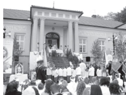
Uroczystość Bożego Ciała pod Urzędem