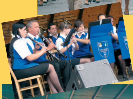
Rewia Orkiestr - występ muzyków z Tarnowskich Gór