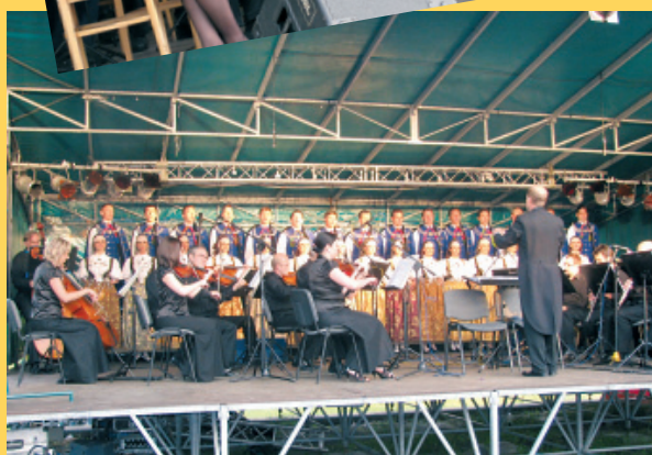
Zespół "Śląsk" - największa gwiazda Dni Gminy Bestwina