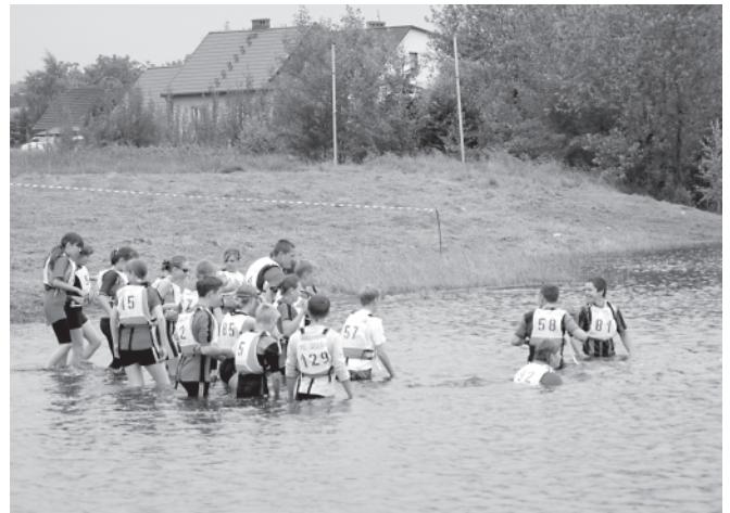
Start mini triathlonu