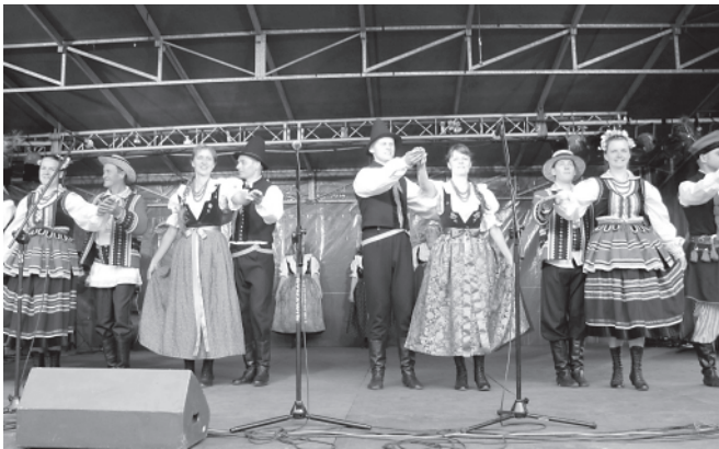
Regionalny Zespół Pieśni i Tańca „Bestwina”

W pierwszym i drugim dniu imprezy usłyszeliśmy także wiele innych ciekawych zespołów i kapel zaproszonych przez CKSiR. Oprócz naszej „Bestwiny” nurt ludowy reprezentowały „Cepelia – Fil” z Wilamowic, Zespół Tańca i Pieśni „Sądeczka-