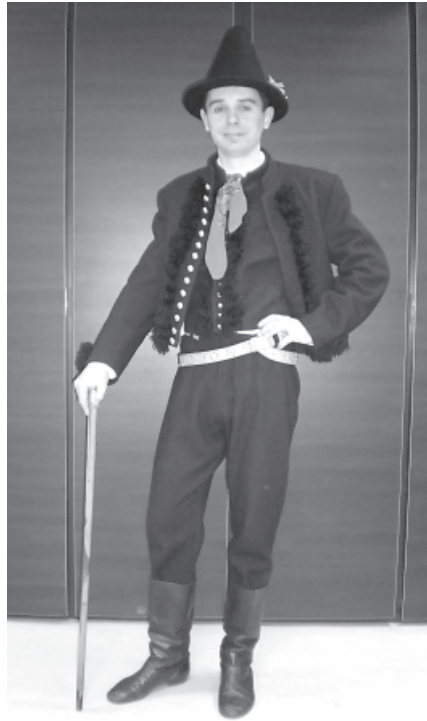
Strój męski odświętny