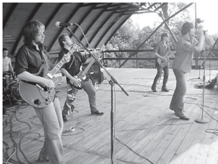
Występy na Underground Festival

Wśród zaproszonych zespołów znalazły się: Plagiat 199, The Coiots, The End, The Redskiss oraz A-front. Posłuchać więc można było zarówno punka, ale i miłośnicy rock'n'rolla znaleźli coś dla siebie. Organizatorzy zadbałi o każdy