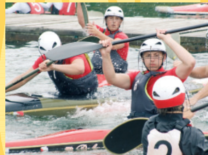
Jeden z zaciętych meczów Turnieju Kajak - Polo