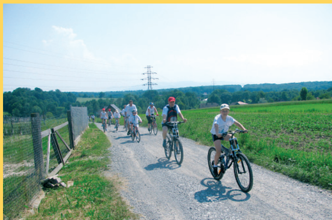
V Janowicki Rodzinny Rajd Rowerowy